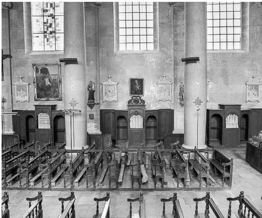
Ensemble de trois confessionnaux, bas-côté gauche.

70, Avrigny-Virey rue de l' Eglise, lieudit : Avrigny