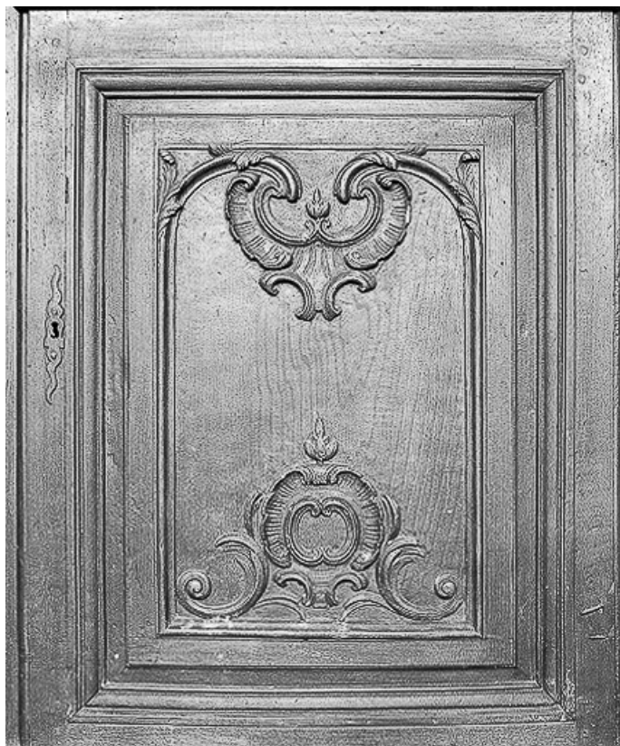
Détail : portillon du premier confessionnal gauche.

70, Avrigny-Virey rue de l' Eglise, lieudit : Avrigny