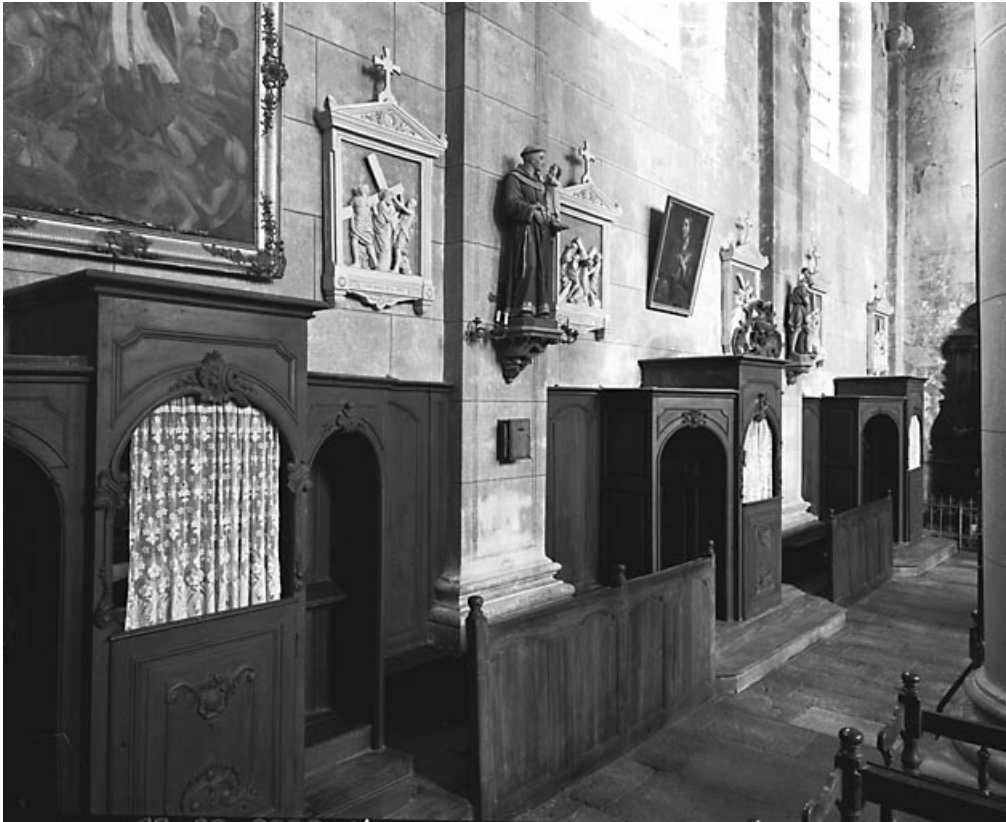
Ensemble de trois confessionnaux vue de trois quarts gauche, bas-côté gauche.

70, Avrigny-Virey rue de l' Eglise, lieudit : Avrigny