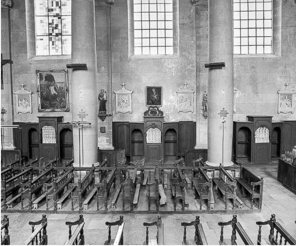
Ensemble de trois confessionnaux, bas-côté gauche.

70, Avrigny-Virey rue de l' Eglise, lieudit : Avrigny