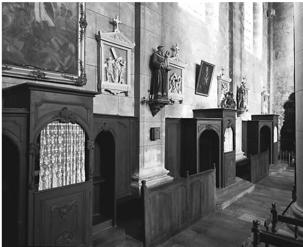
Ensemble de trois confessionnaux vue de trois quarts gauche, bas-côté gauche.

70, Avrigny-Virey rue de l' Eglise, lieudit : Avrigny