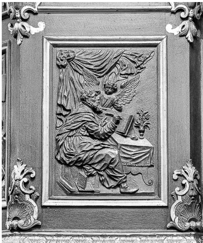
Détail, panneau de la cuve : saint Matthieu.

70, Avrigny-Virey rue de l' Eglise, lieudit : Avrigny