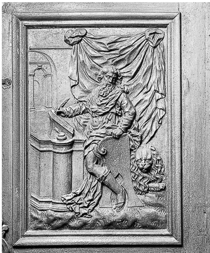
Détail, panneau de la cuve : saint Marc.

70, Avrigny-Virey rue de l' Eglise, lieudit : Avrigny