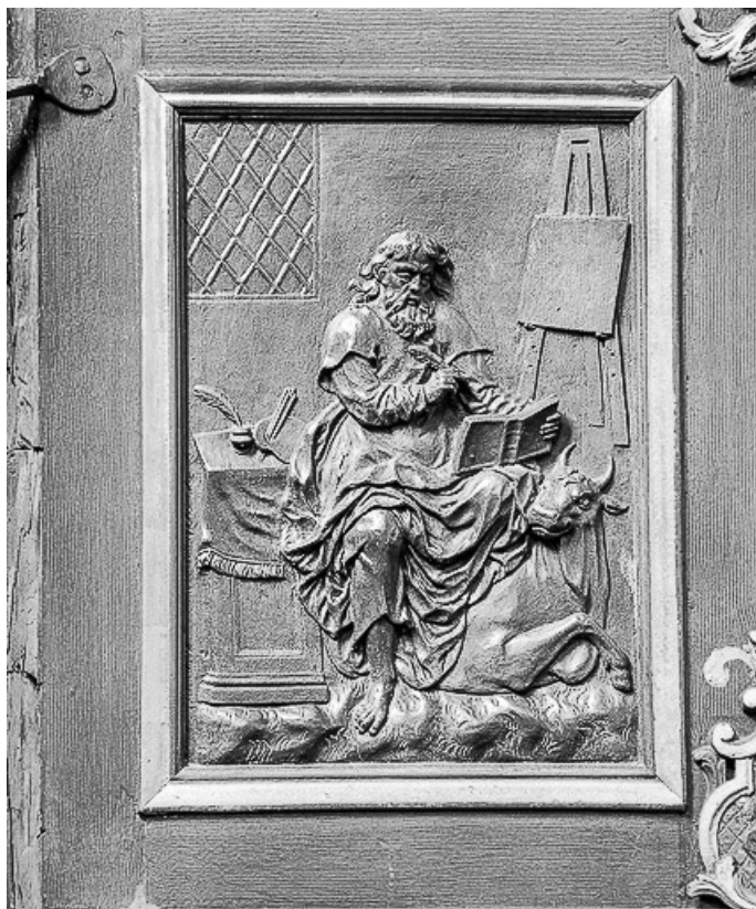
Détail, panneau de la cuve : saint Luc.

70, Avriigny-Virey rue de l' Eglise, lieudit : Avriigny