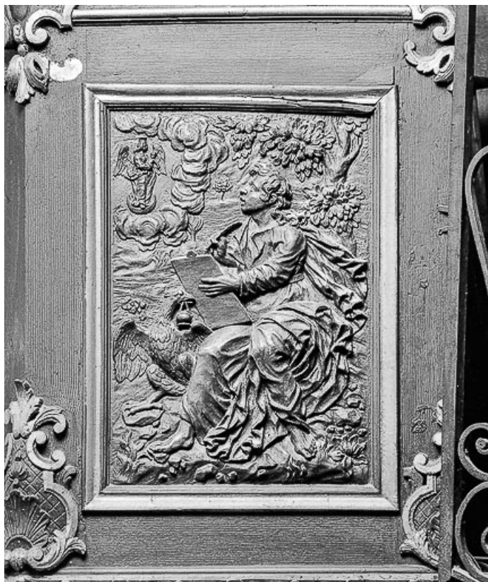
Détail, panneau de la cuve : saint Jean.

70, Avrigny-Virey rue de l' Eglise, lieudit : Avrigny