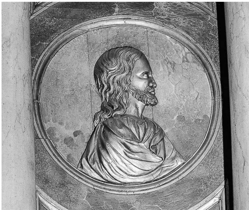
Détail du médaillon gauche : le Christ.

70, Avriigny-Virey rue de l' Eglise, lieudit : Avriigny