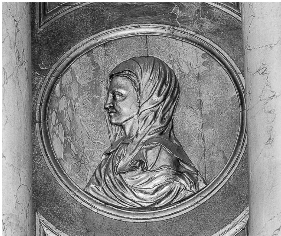
Détail du médaillon droit : la Vierge.

70, Avriigny-Virey rue de l' Eglise, lieudit : Avriigny