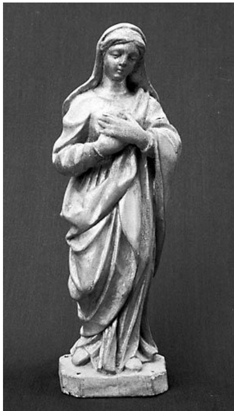
Vue de face.