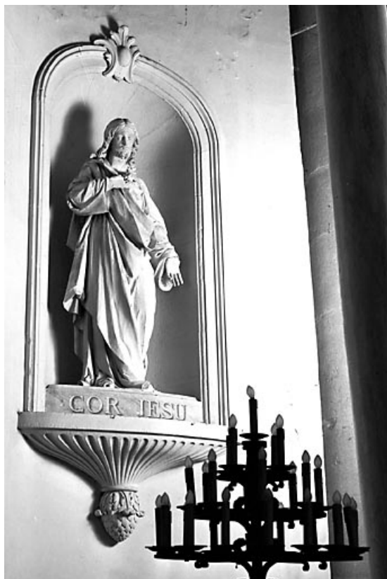
Vue du Sacré-Coeur de Jésus.