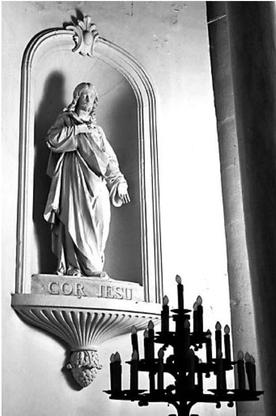
Vue du Sacré-Coeur de Jésus.