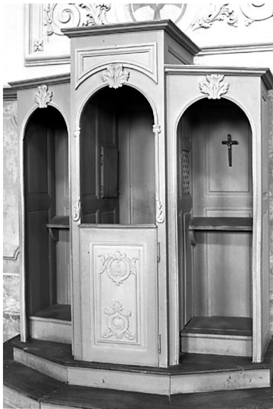
Vue d'un confessionnal.