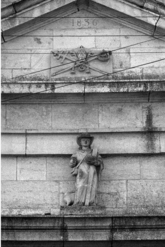
Vue d'ensemble avec cartouche.