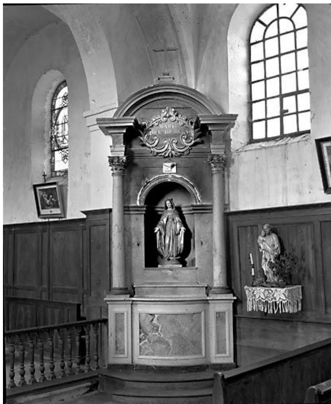
Vue d'ensemble. 70, Citey