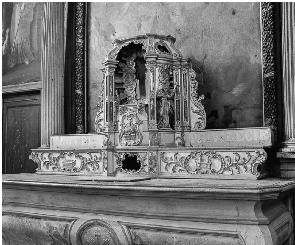
Tabernacle du maître-autel, vue de trois quarts droit. 70, Citey