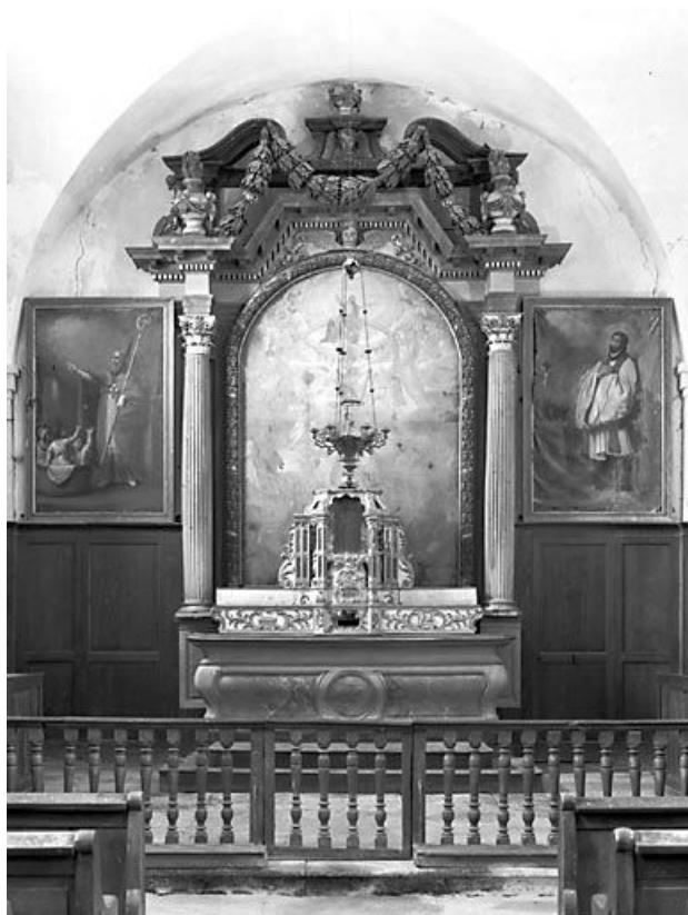
Vue d'ensemble. 70, Citey