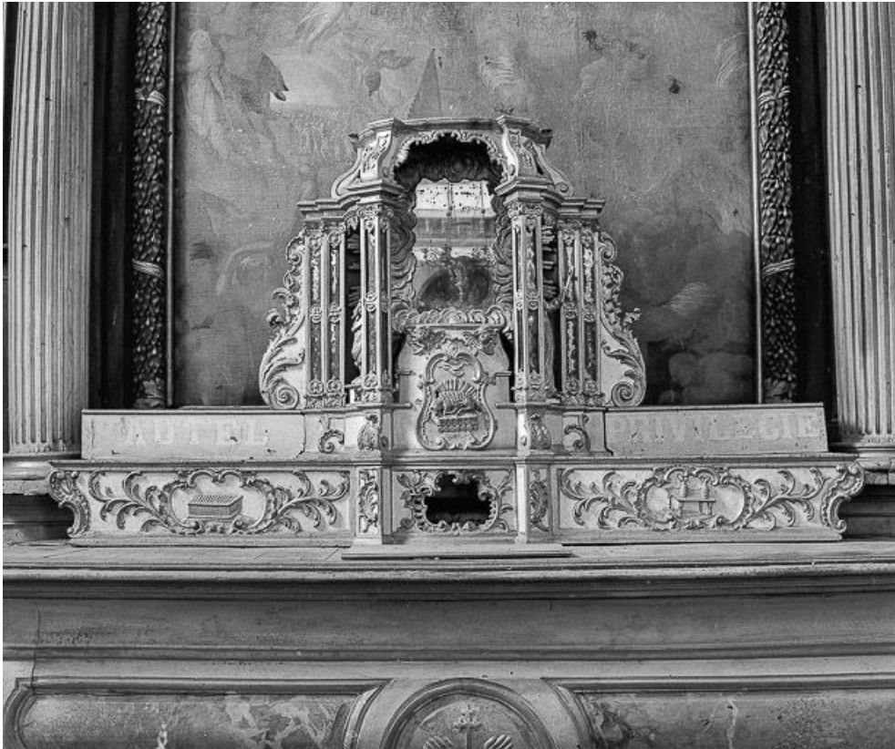
Tabernacle du maître-autel, vue de face.