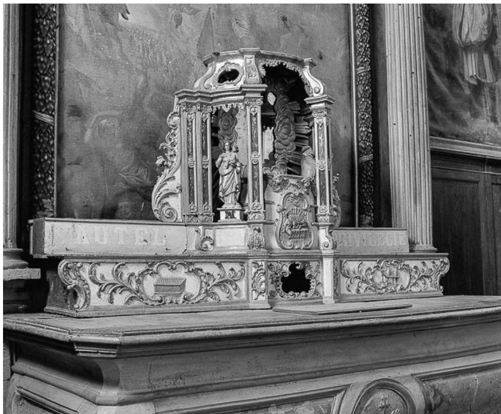
Tabernacle du maître-autel, vue de trois quarts gauche. 70, Citey