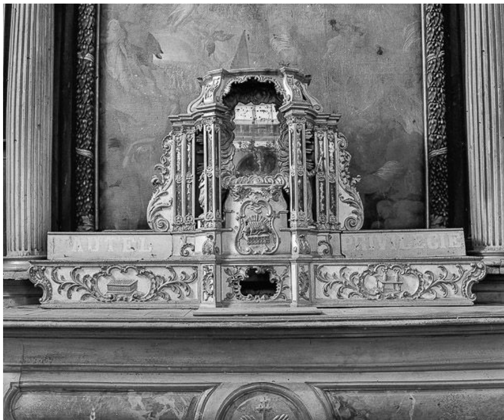
Tabernacle du maître-autel, vue de face. 70, Citey