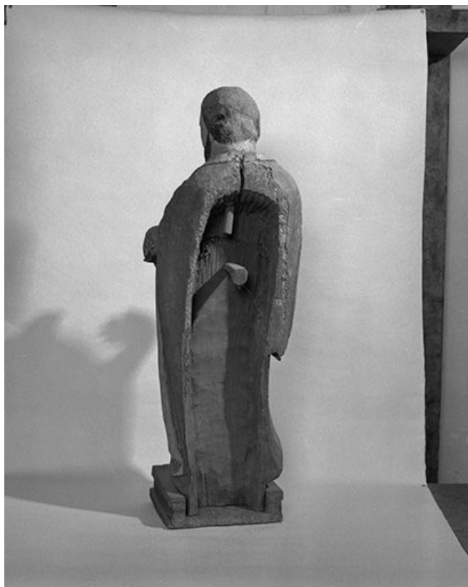
Vue de dos.