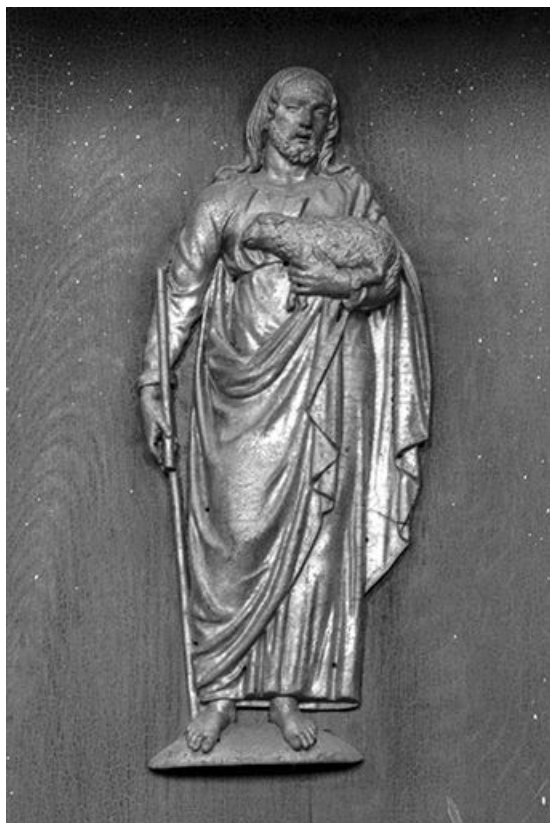
Détail : panneau Le Bon Pasteur.