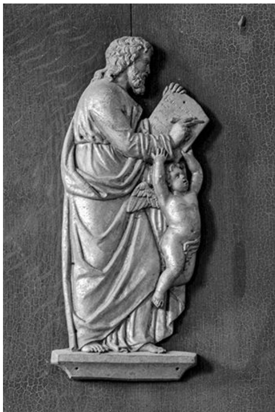
Détail : panneau de saint Matthieu.