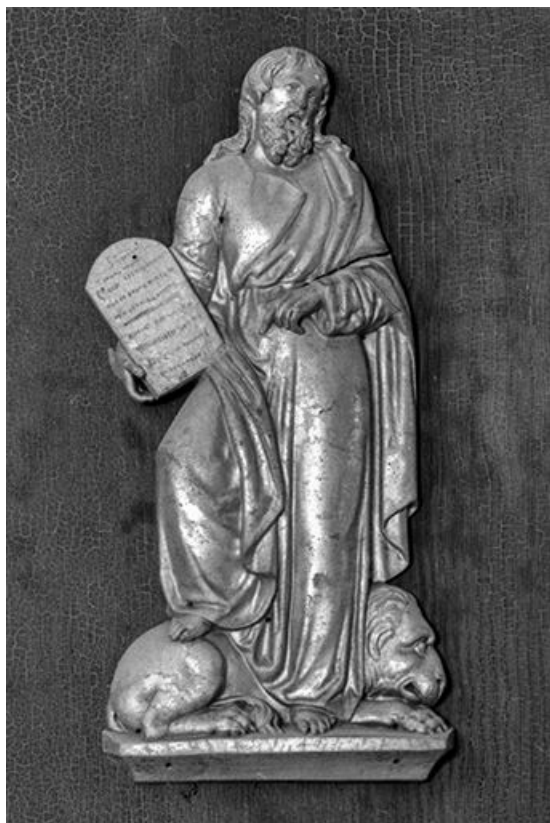
Détail : panneau de Saint Marc.