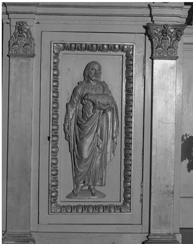
Autel-retable latéral droit : détail de la porte du tabernacle.