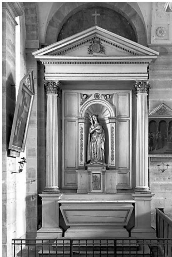
Vue de l'autel-retable latéral gauche.