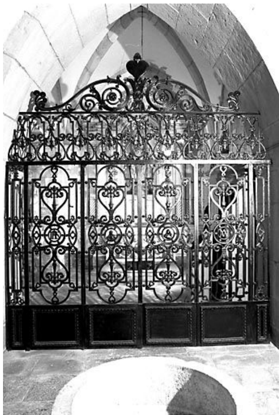
Vue d'ensemble. 70, Bucey-lès-Gy