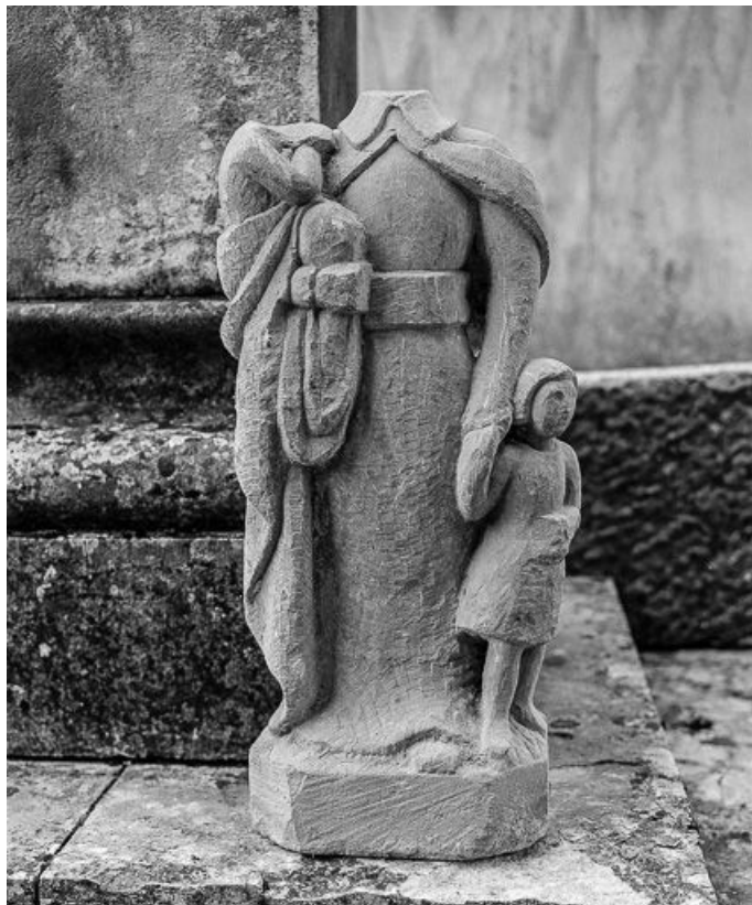
Personnage avec deux enfants.

70, Bonnevent-Velloreille, lieudit : Bonnevent