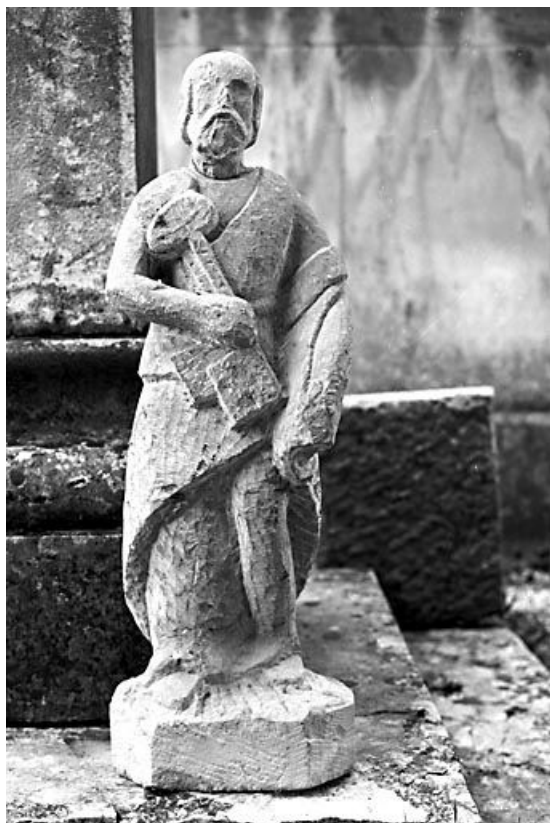
Saint Pierre vu de face.

70, Bonnevent-Velloreille, lieudit : Bonnevent