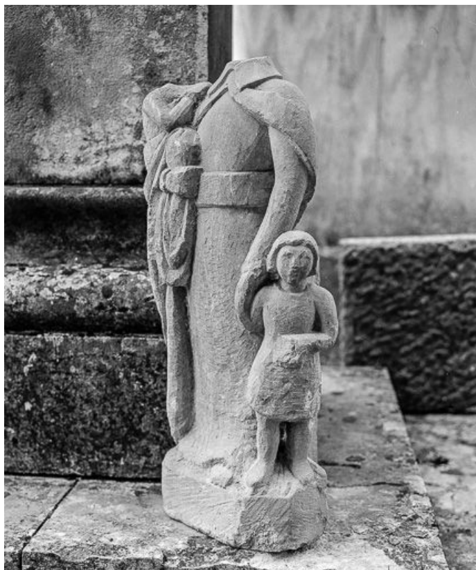
Personnage avec deux enfants.

70, Bonnevent-Velloreille, lieudit : Bonnevent