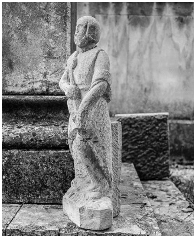
Saint Pierre vu de trois quart.

70, Bonnevent-Velloreille, lieudit : Bonnevent