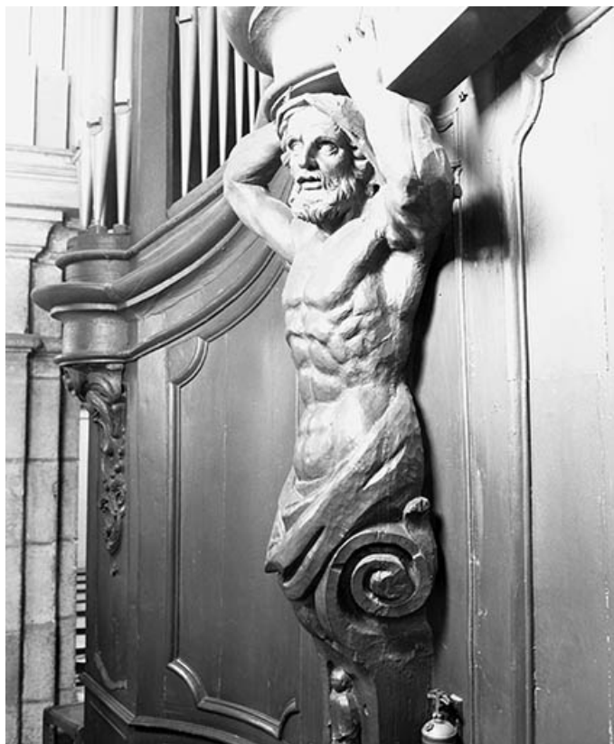
Détail : atlante gauche.