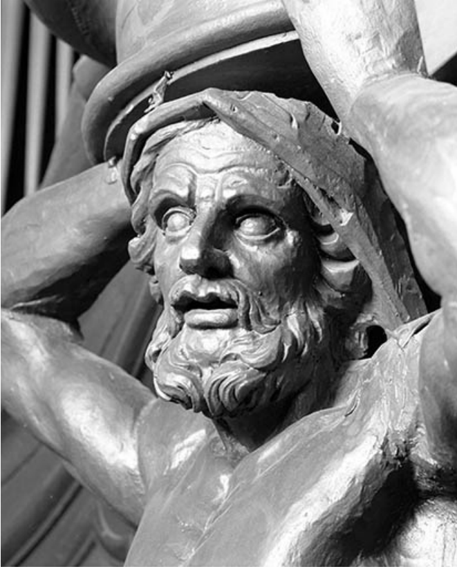
Détail : visage de l'atlante gauche.