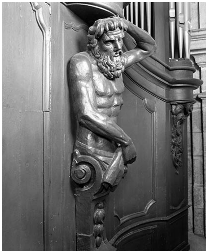
Détail : atlante droit.