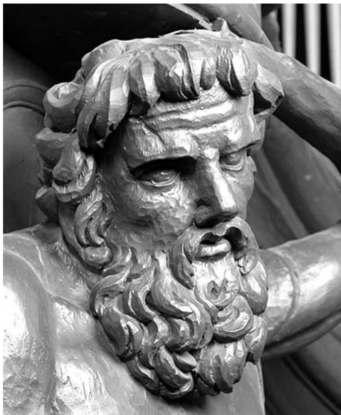
Détail : visage de l'atlante droit.