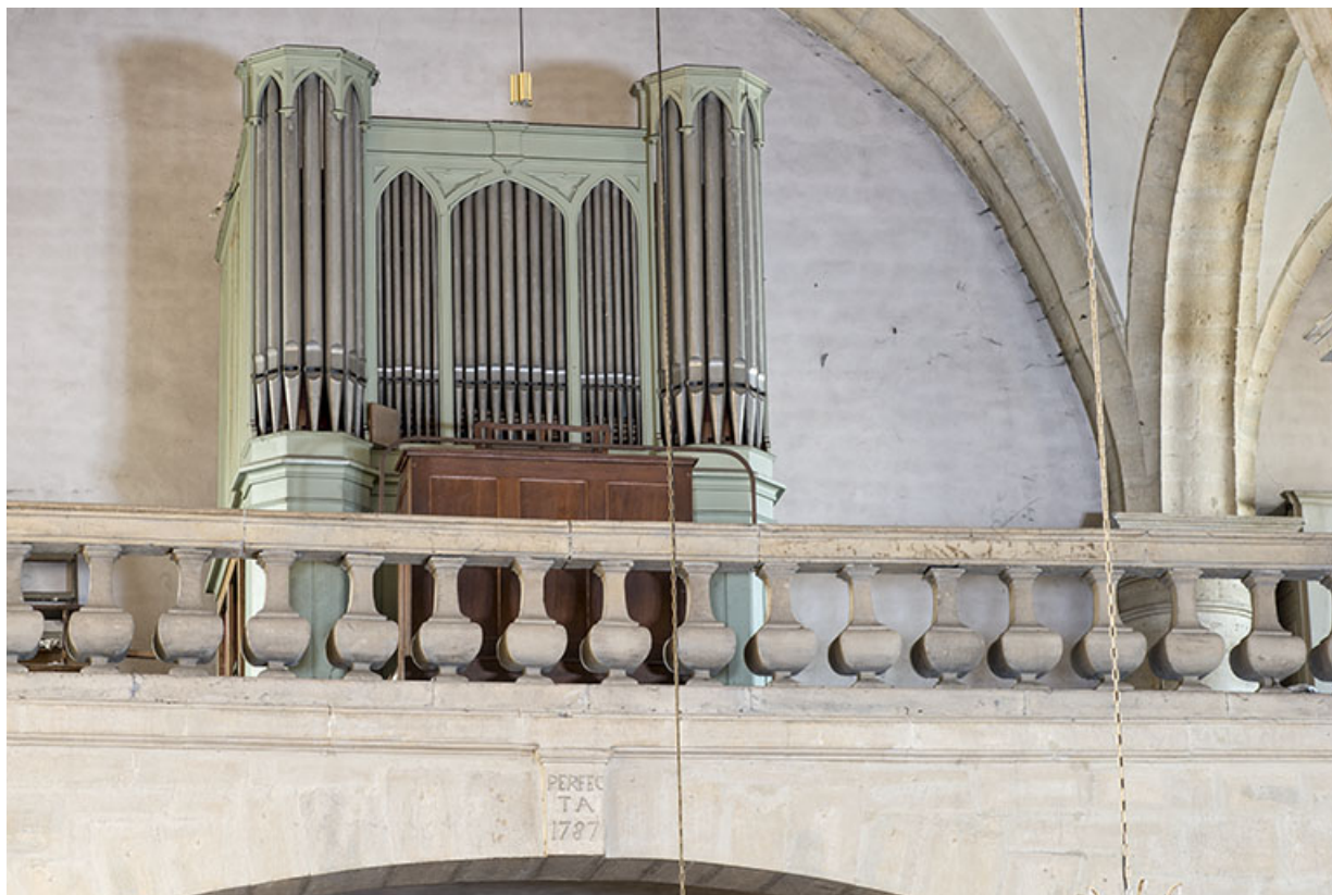
Vue de trois quarts en 2017