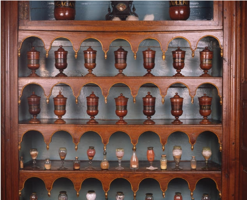
Vue d'ensemble des pots en bois sur l'étagère du mur est.