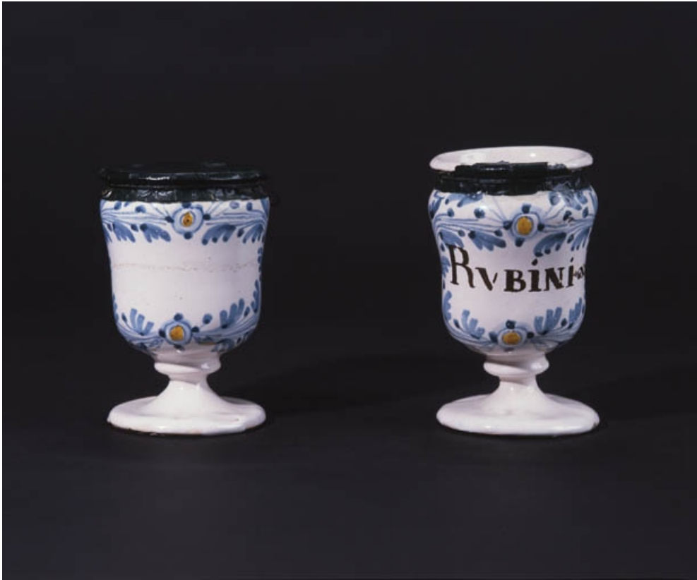
Vue d'ensemble de deux piluliers à décor bleu et jaune.