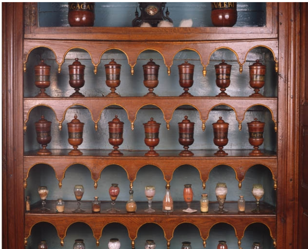
Vue d'ensemble des pots en bois sur l'étagère du mur est.