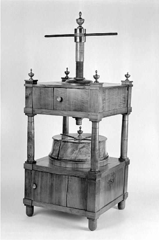
Vue d'ensemble avec le couvercle.