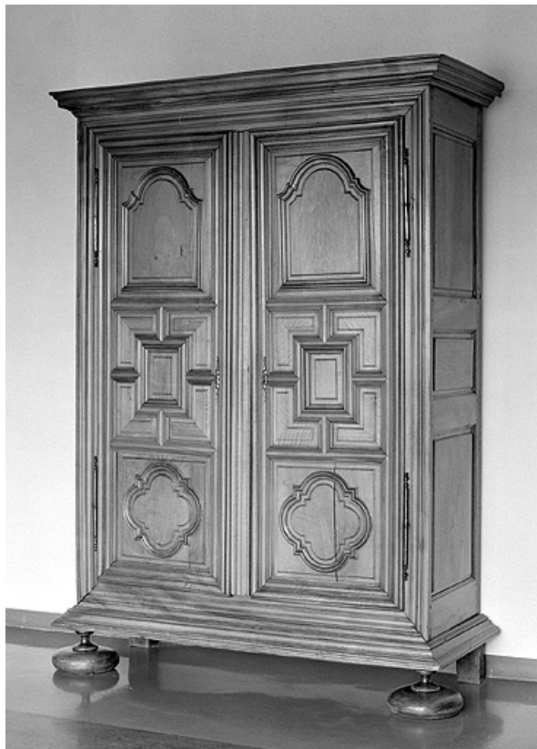
Vue d'ensemble de trois quarts droit.