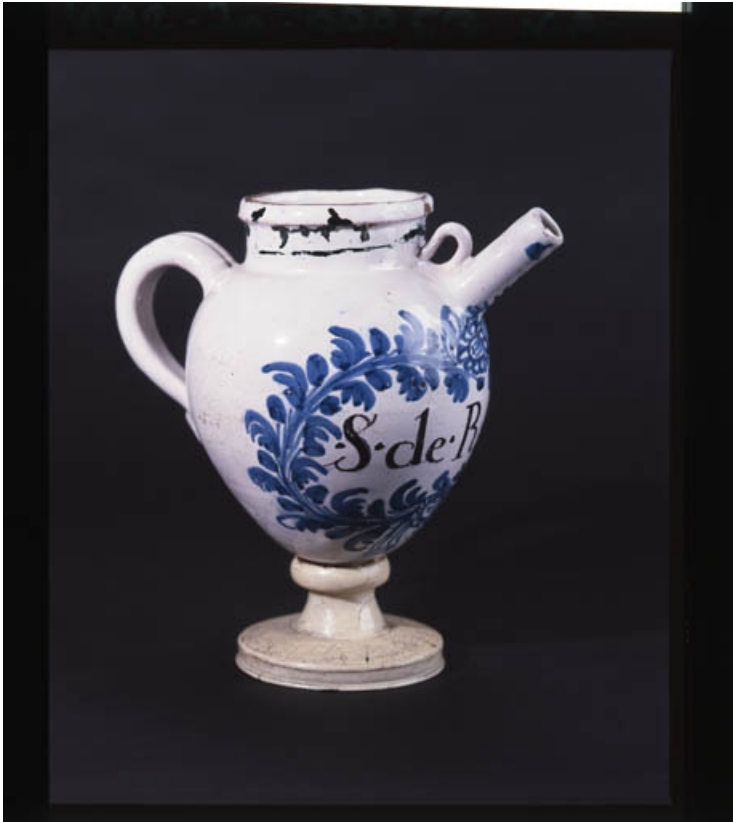
Vue d'ensemble d'une chevrette à décor bleu touffu situé sous le goulot.