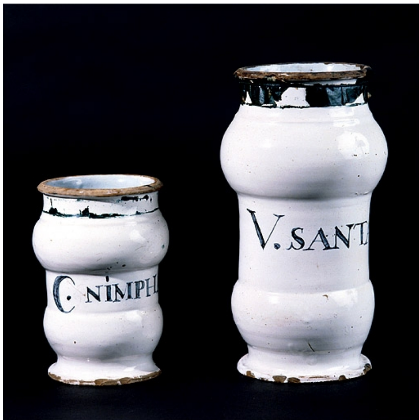
Vue d'ensemble de deux albarellos blancs à double renflement.