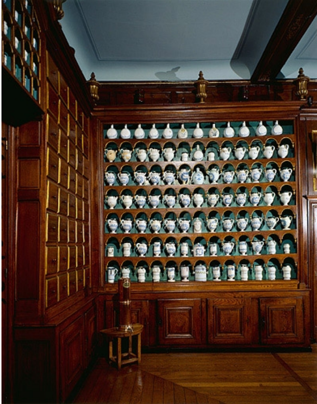
Vue d'ensemble du meuble mur nord.