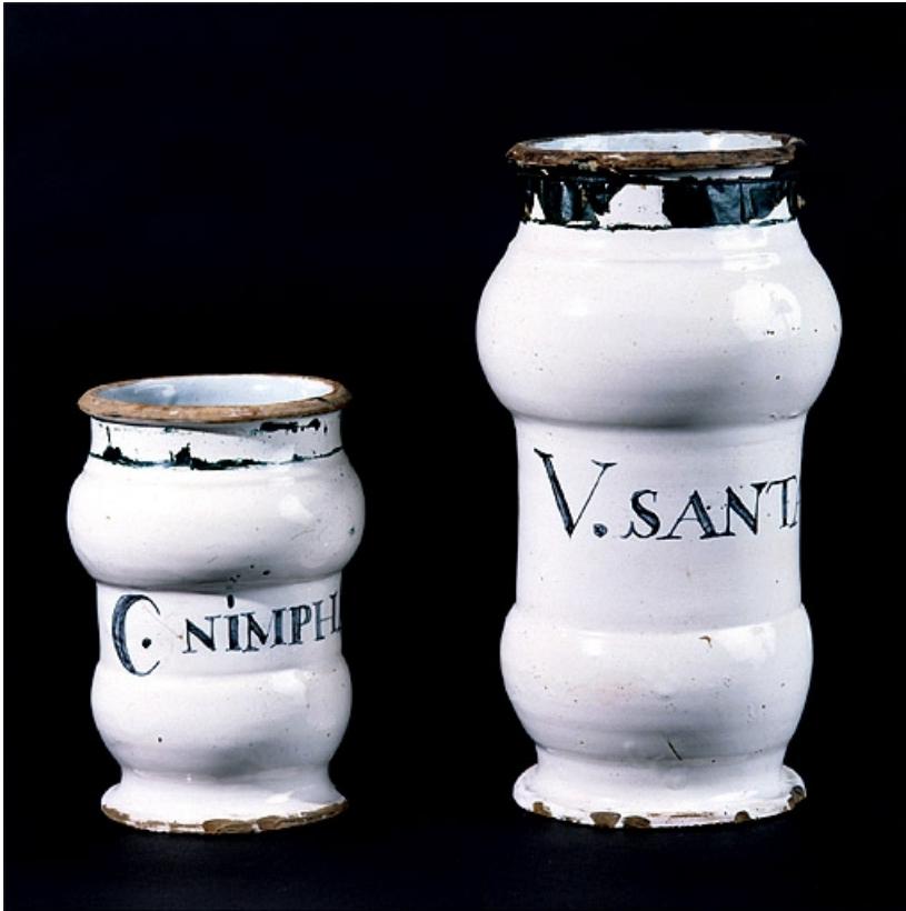
Vue d'ensemble de deux albarellos blancs à double renflement.