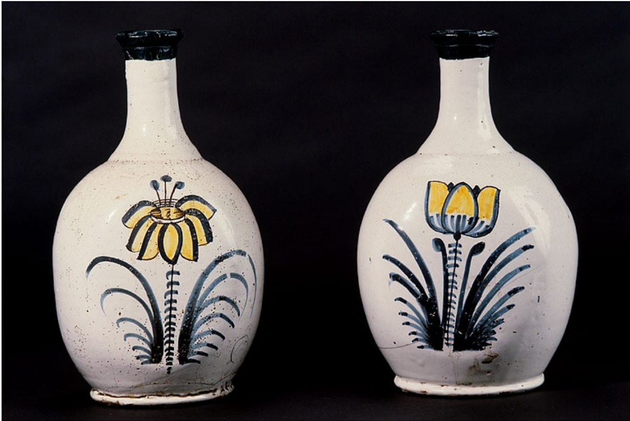
Vue d'ensemble de deux bouteilles décorées d'une fleur stylisée.