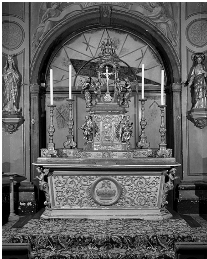
Vue d'ensemble, de face.