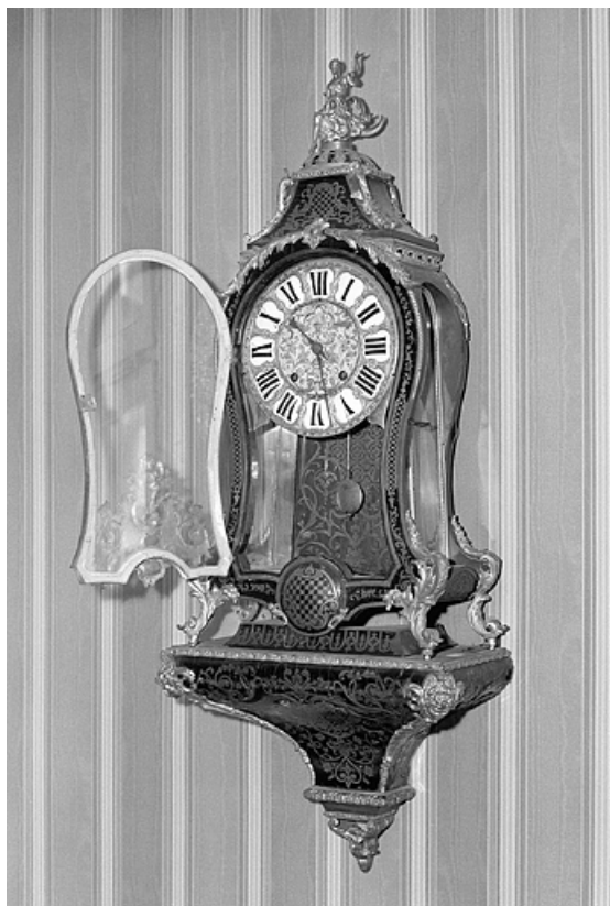
Vue d'ensemble, porte vitrée ouverte.