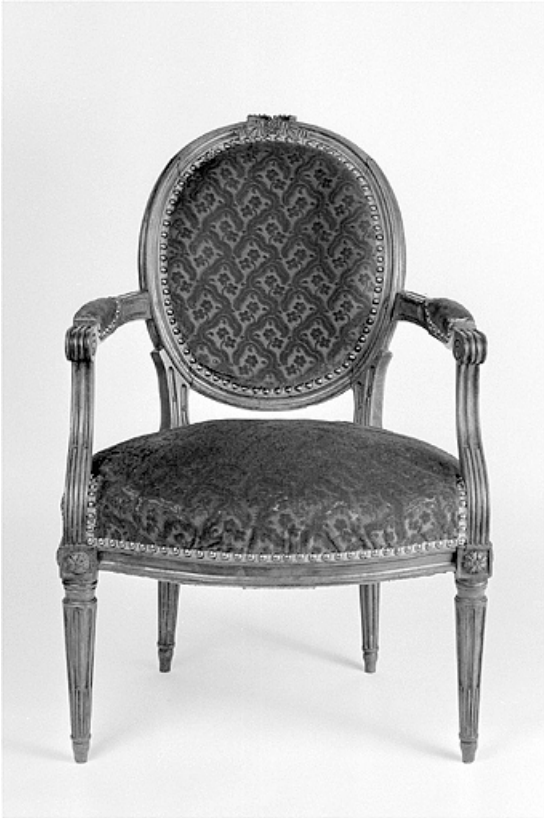
Vue d'ensemble de face.