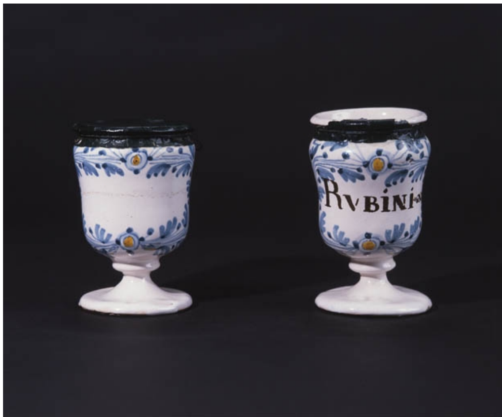
Vue d'ensemble de deux piluliers à décor bleu et jaune.