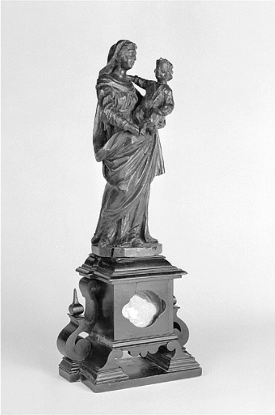
Vue d'ensemble de trois quarts gauche.