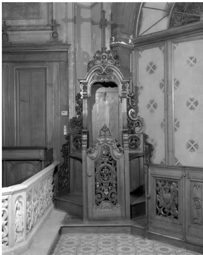
Vue d'ensemble, de face.