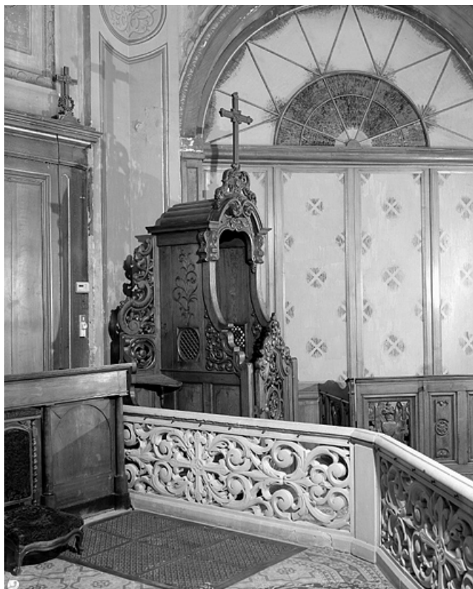
Vue d'ensemble, de trois quarts gauche.