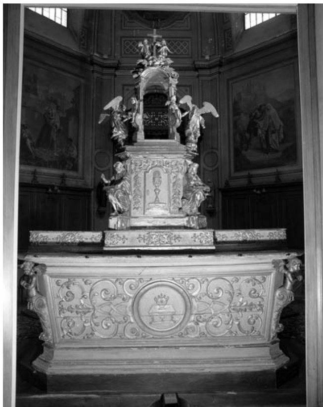
Vue générale, de face.