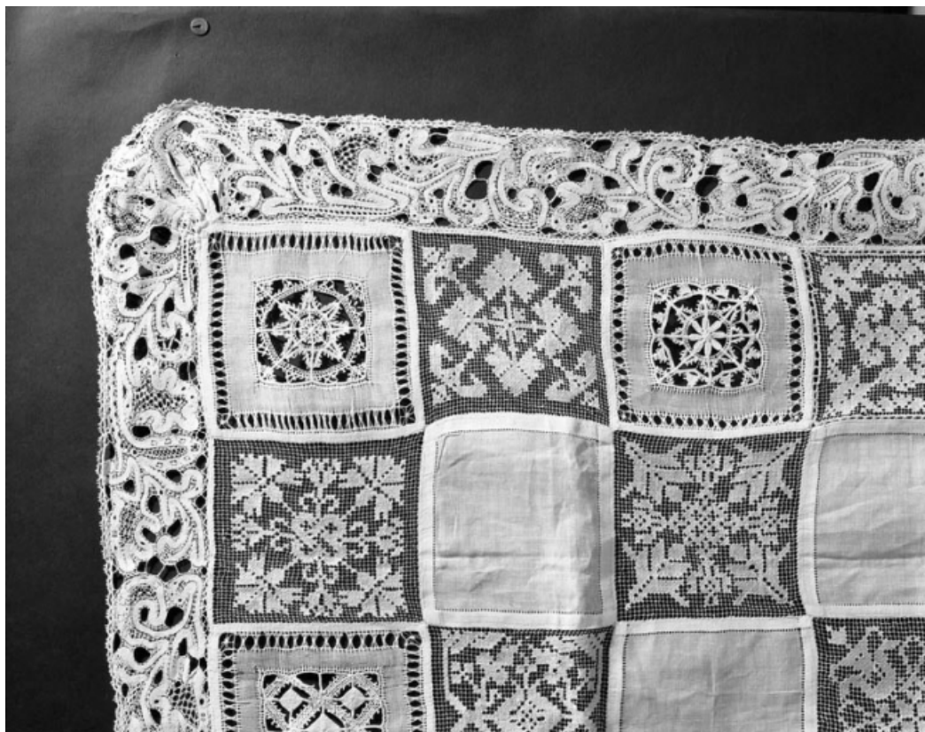
Détail du bord inférieur droit.