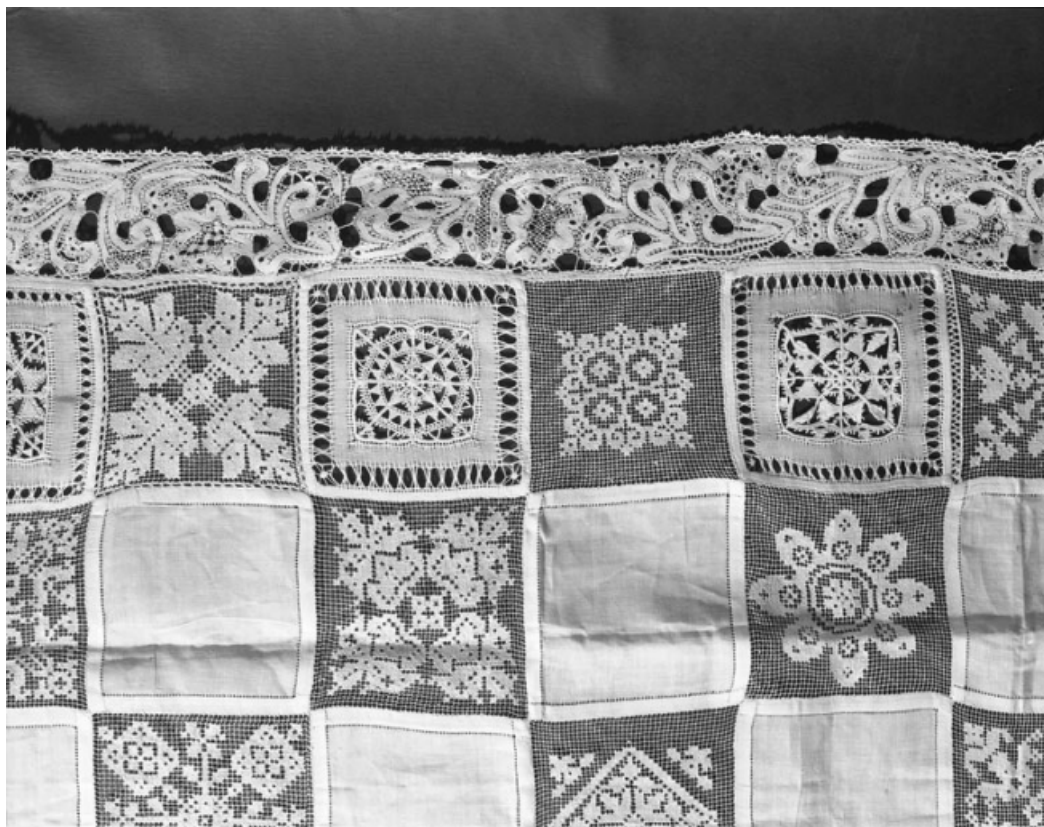
Détail du bord gauche.