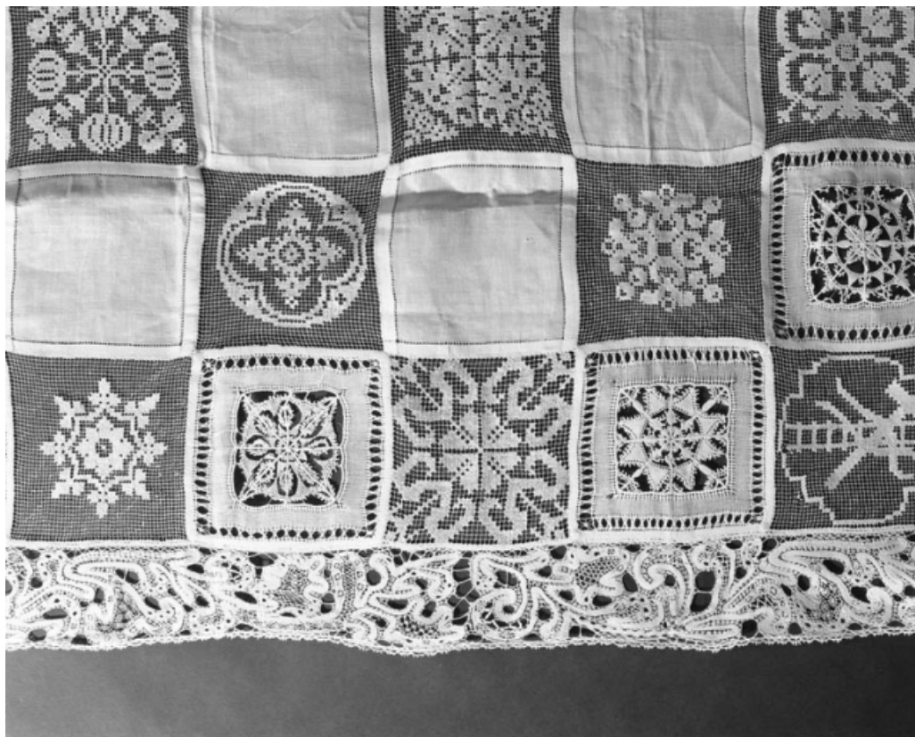
Détail du bord supérieur droit.