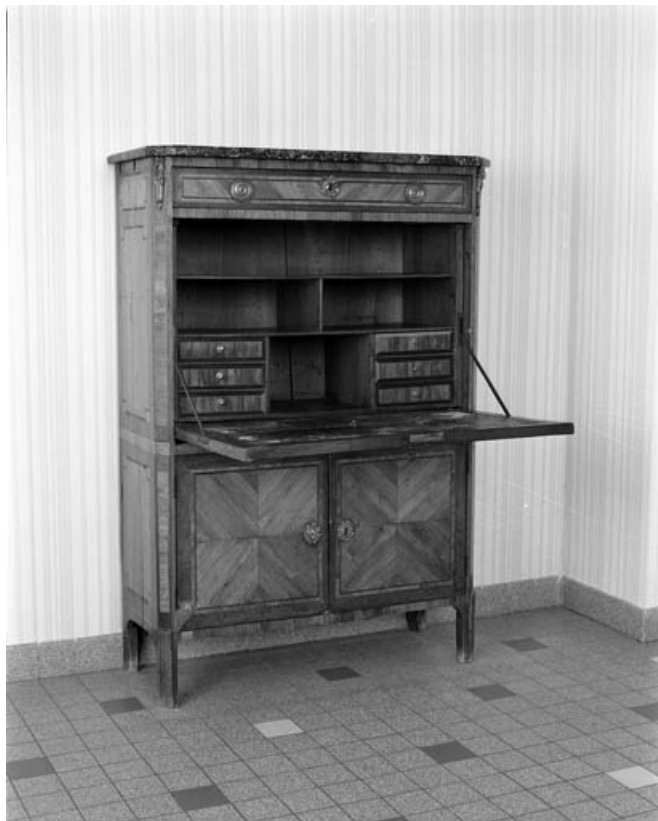
Vue d'ensemble de trois quarts gauche, abattant ouvert.