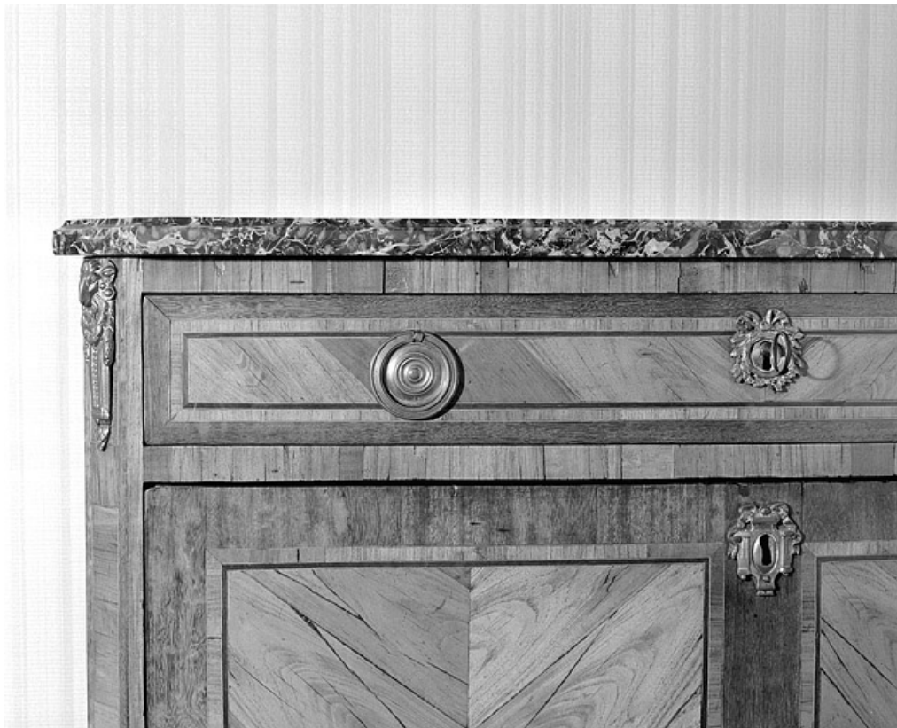
Détail de l'angle supérieur gauche.