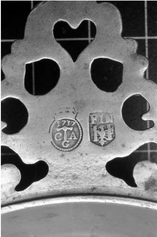
Détail des poinçons du maître potier d'étain et de contrôle.