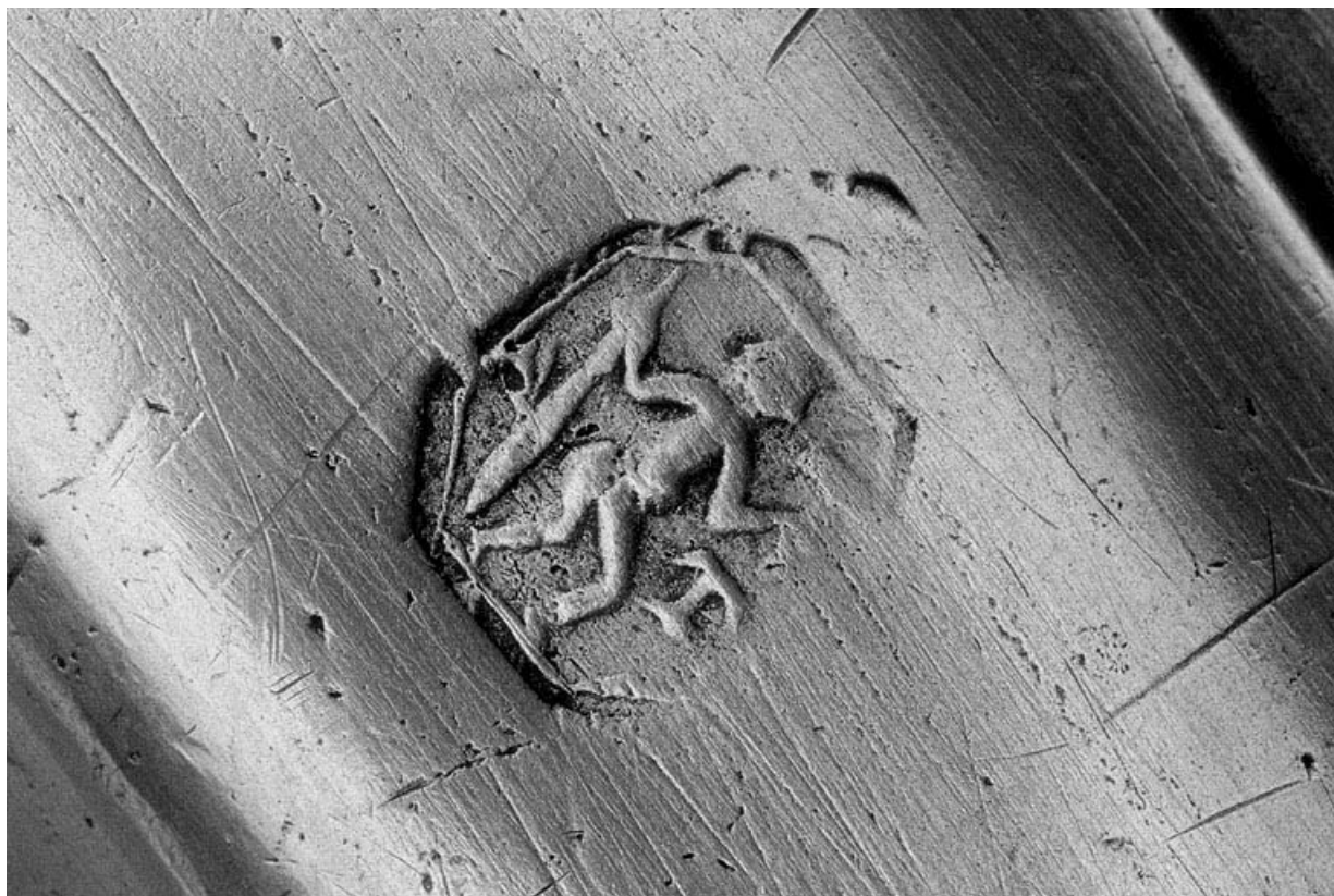
Détail du poignon de maître potier d'étain.