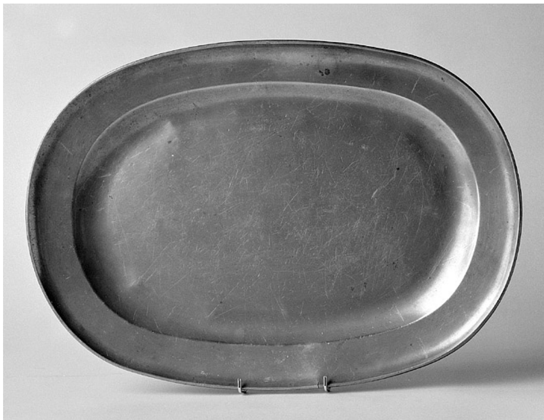
Vue d'ensemble, de face.