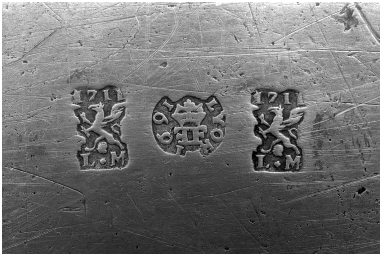
Détail des poinçons du maître potier d'étain et de contrôle.