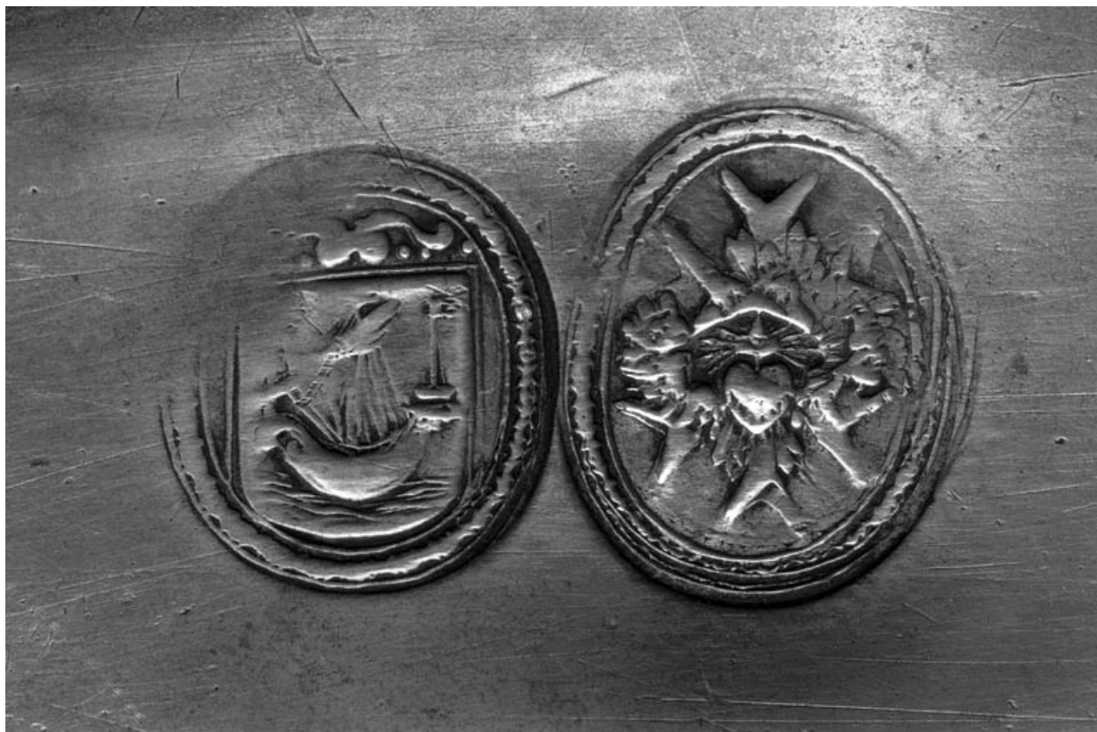
Détail des deux marques de collection.