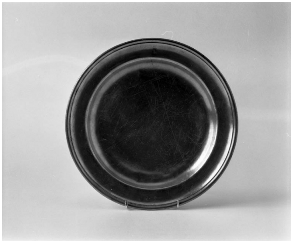
Vue d'ensemble, de face.