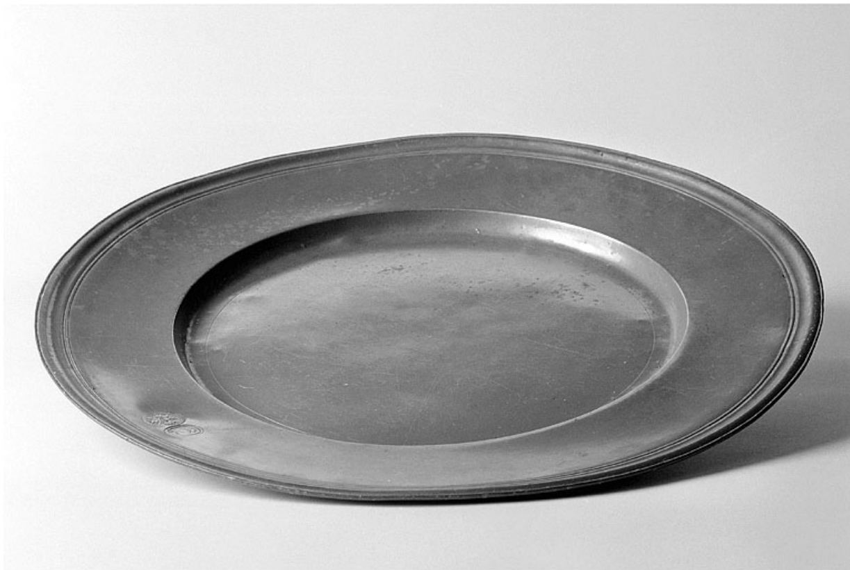
Vue d'ensemble, à plat.