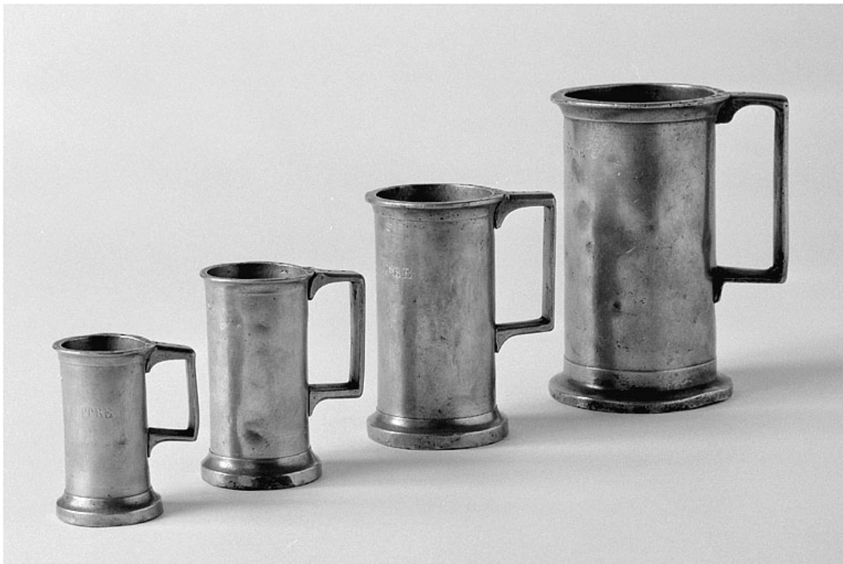
Vue d'ensemble des quatres pichets mesures.