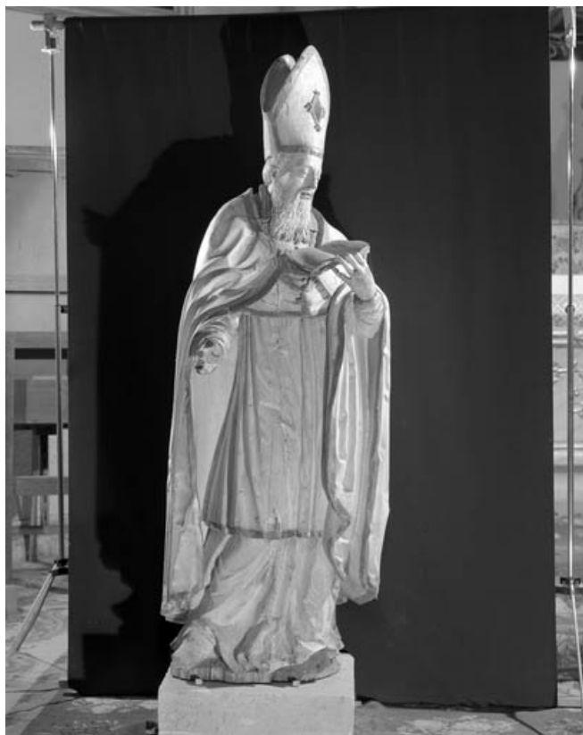
Saint Ambroise : de face.