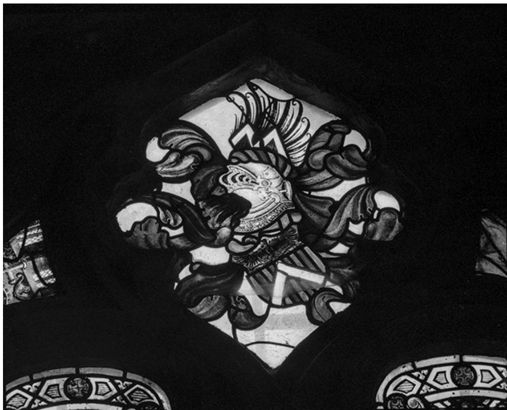
Tympan avec les armoiries de la famille de Vandenesse.