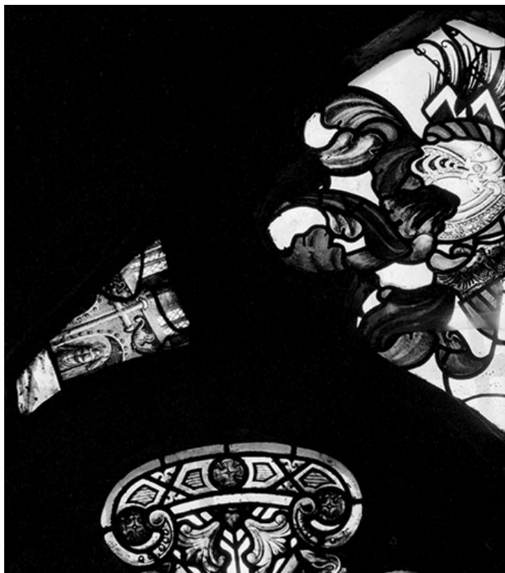
Détail : écoinçon gauche avec personnage et éléments d'architecture. 70, Gray place de la Sous-Préfecture