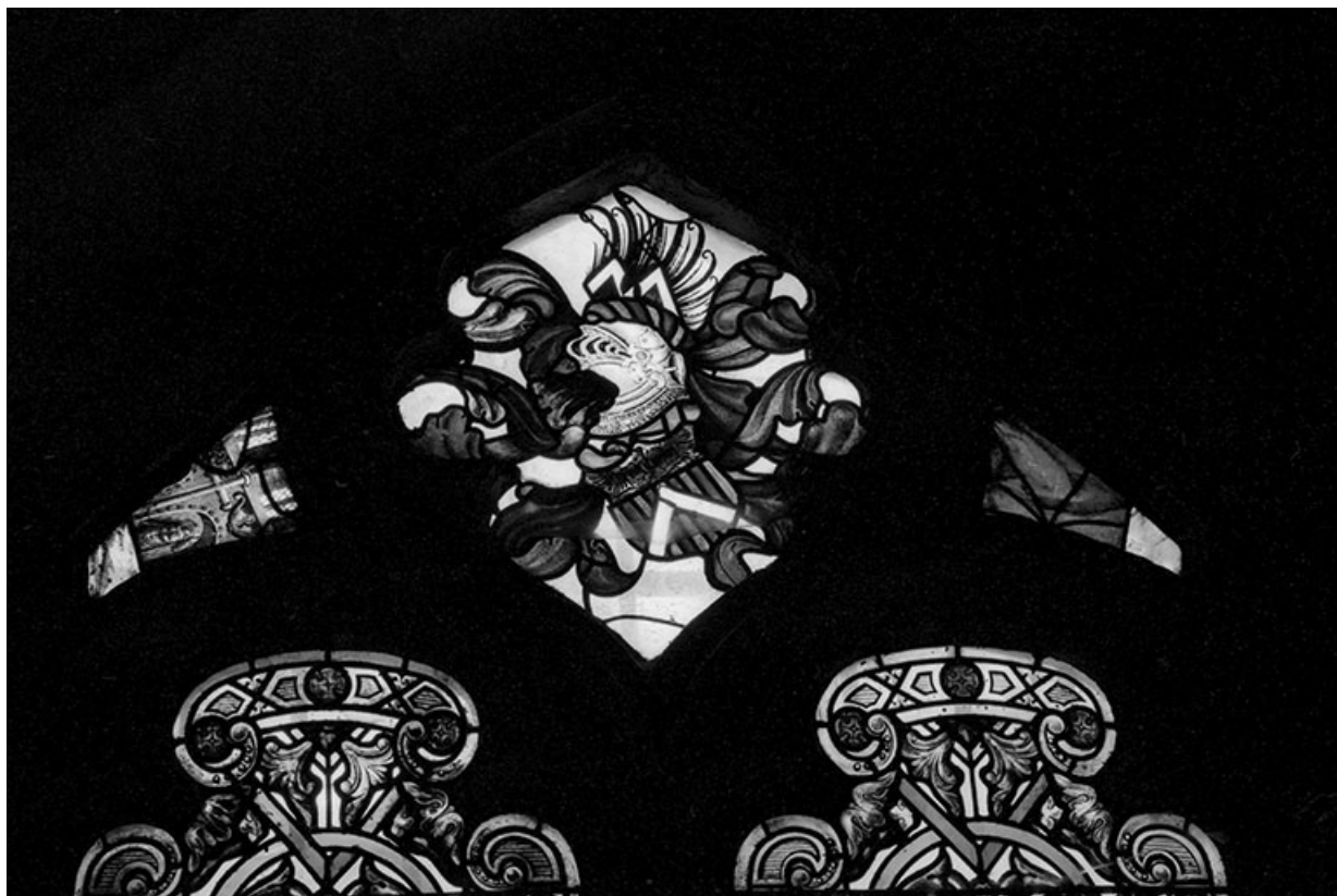
Tympan avec les armoiries de la famille de Vandenesse.