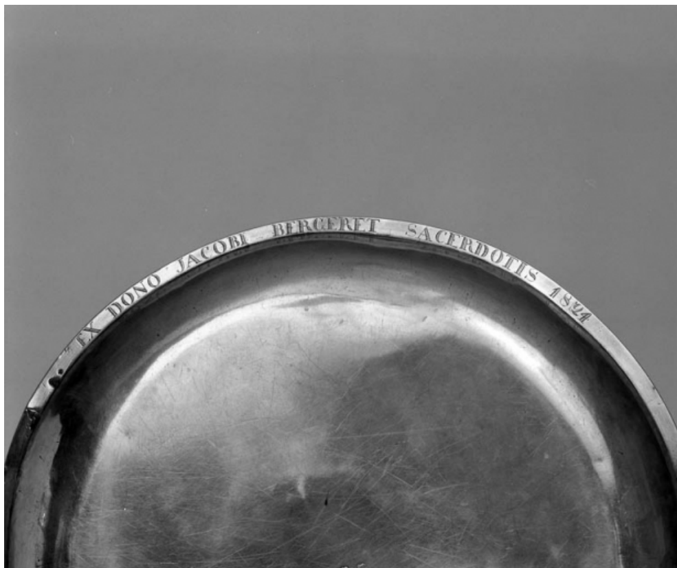
Détail du rebord du plateau avec l'inscription.