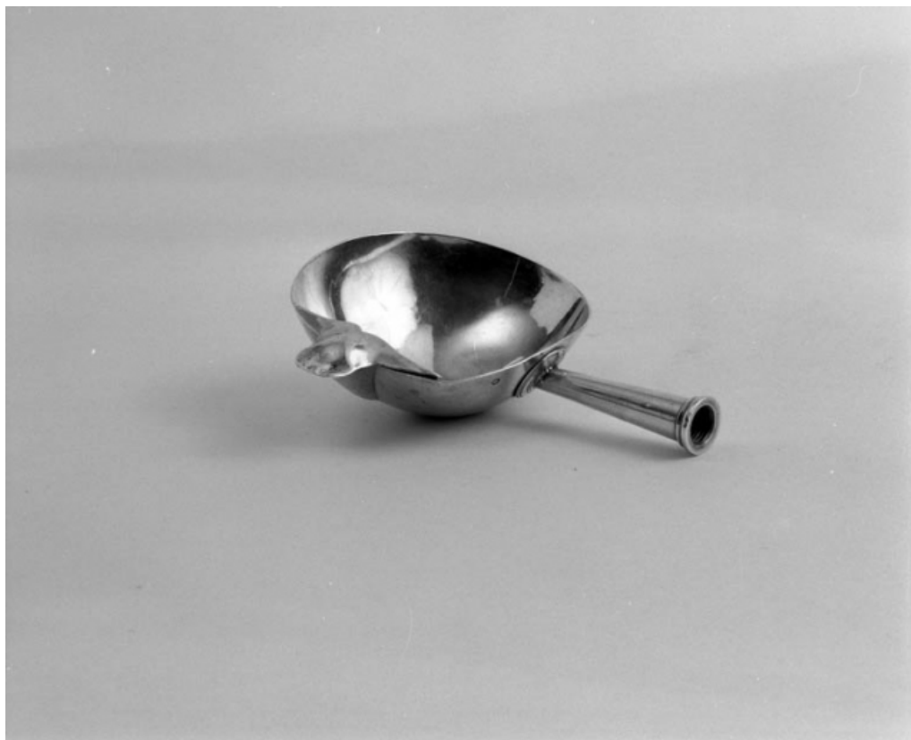
Vue d'ensemble de la coquille de baptême.