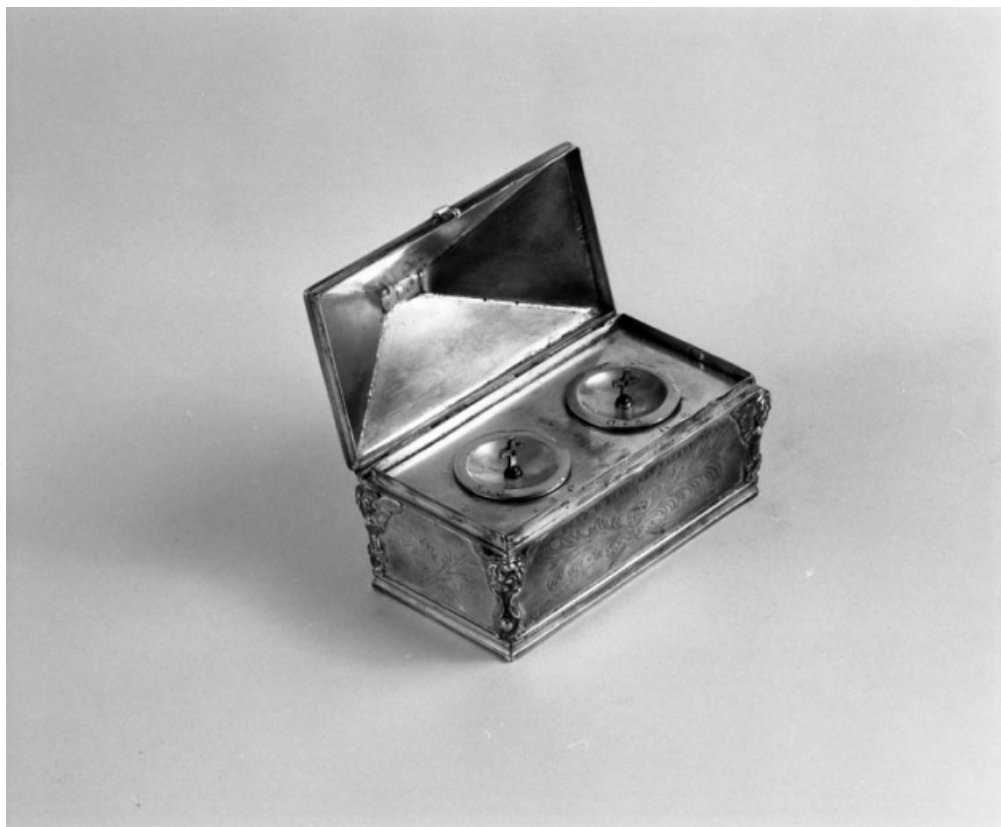
Vue d'ensemble de la boîte à saint Chrême, couvercle ouvert : vue plongeante.