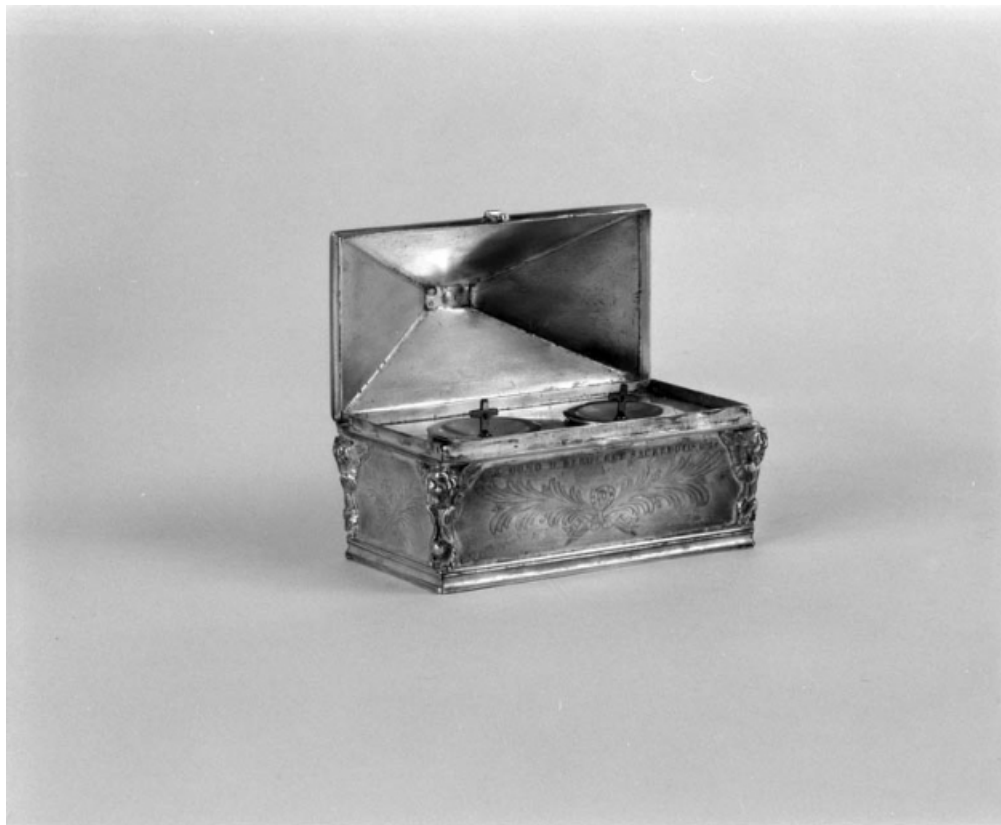
Vue d'ensemble de la boîte à saint Chrême : couvercle ouvert.