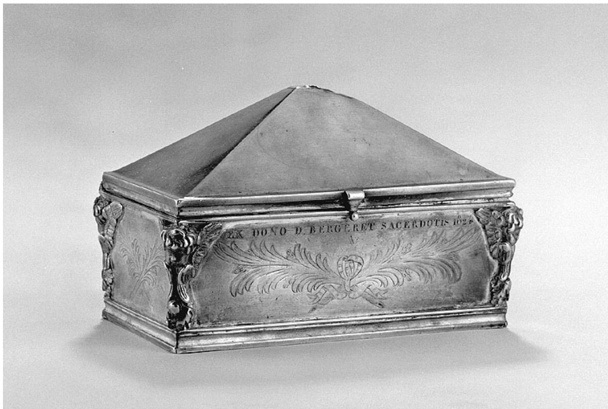
Vue d'ensemble de la boîte à saint Chrême.