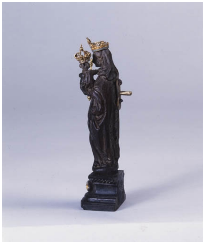
Vue d'ensemble : de profil.