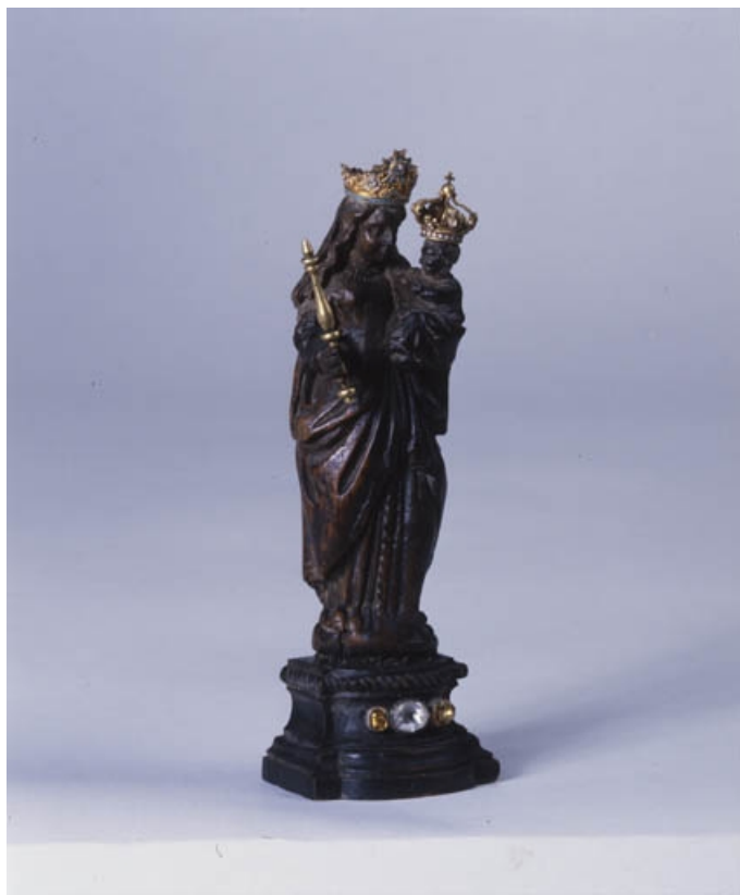
Vue d'ensemble : de trois quarts droit.