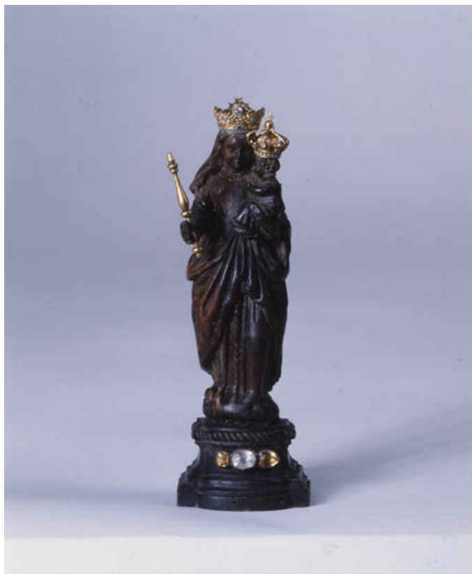
Vue d'ensemble : de face.