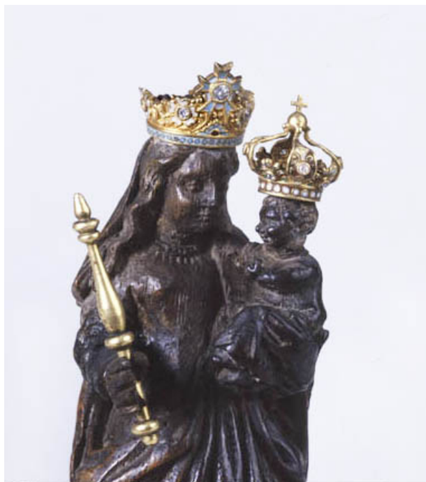
Détail du buste de la Vierge à l'Enfant.