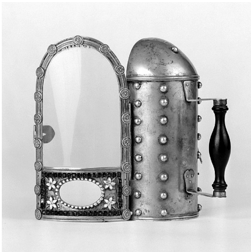
Vue d'ensemble : de profil, porte ouverte.