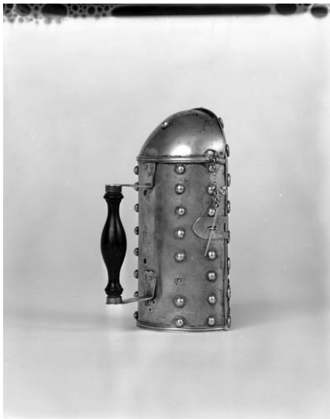
Vue d'ensemble : de profil, porte fermée.