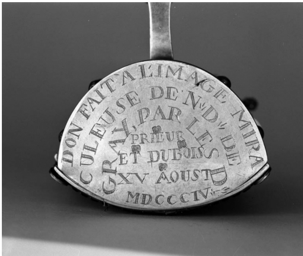
Détail de l'inscription sous la base du reliquaire.