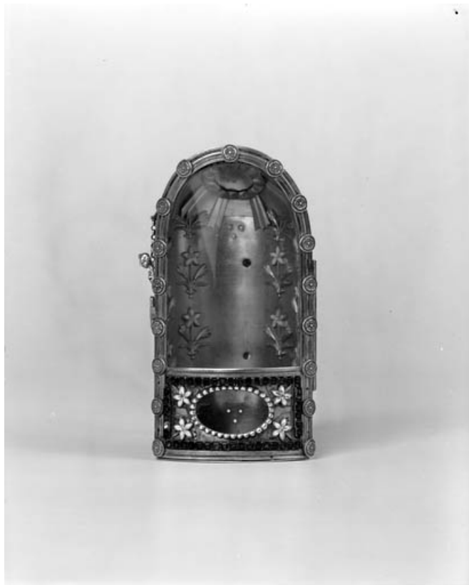
Vue d'ensemble : de face, fermé.