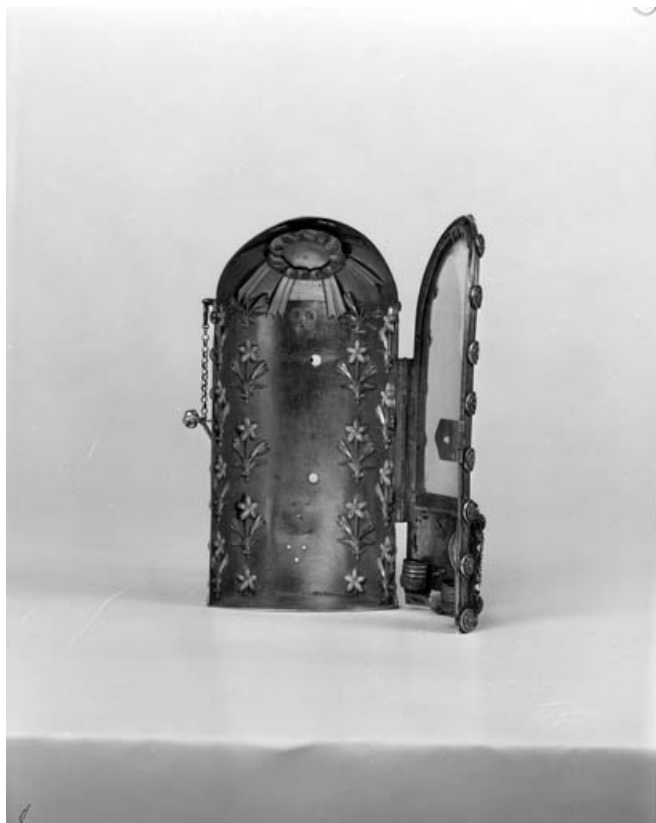
Vue d'ensemble : de face, ouvert.