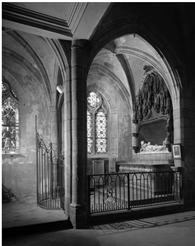
Vue d'ensemble de la chapelle des fontes baptismaux.