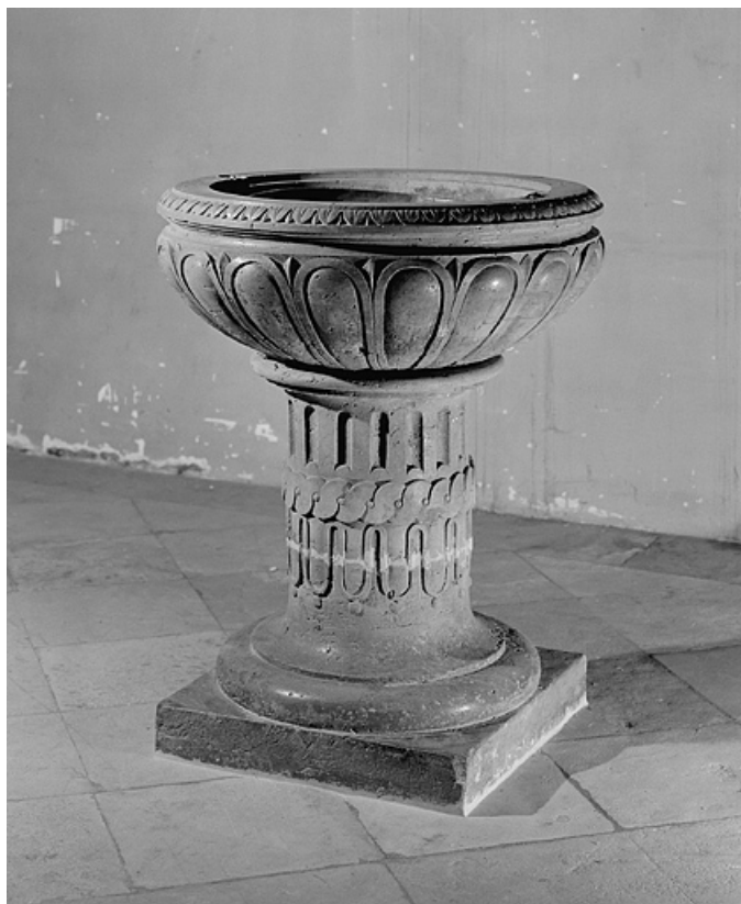
Vue d'ensemble de la cuve baptismale.