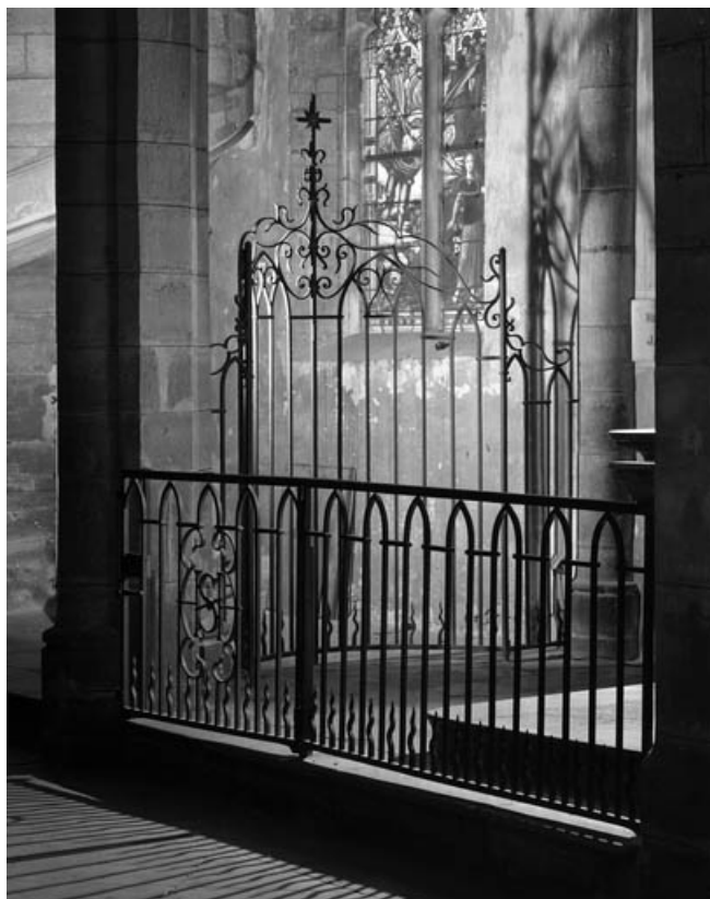
Vue d'ensemble rapprochée de la grille, de trois quarts gauche. 70, Gray place de la Sous-Préfecture