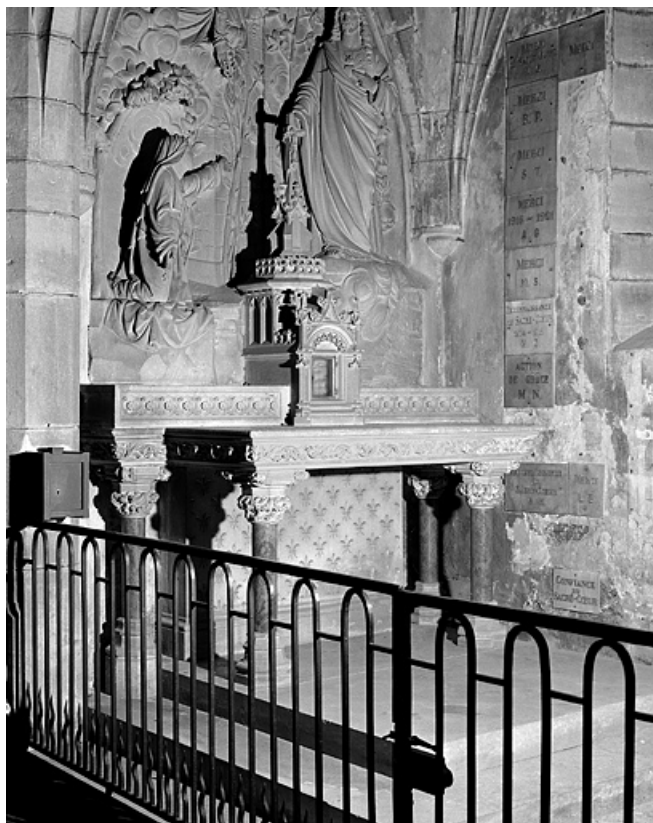
Vue d'ensemble de trois quarts gauche.