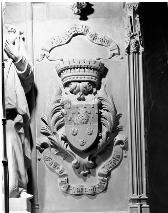
Détail du blason de la ville de Gray.