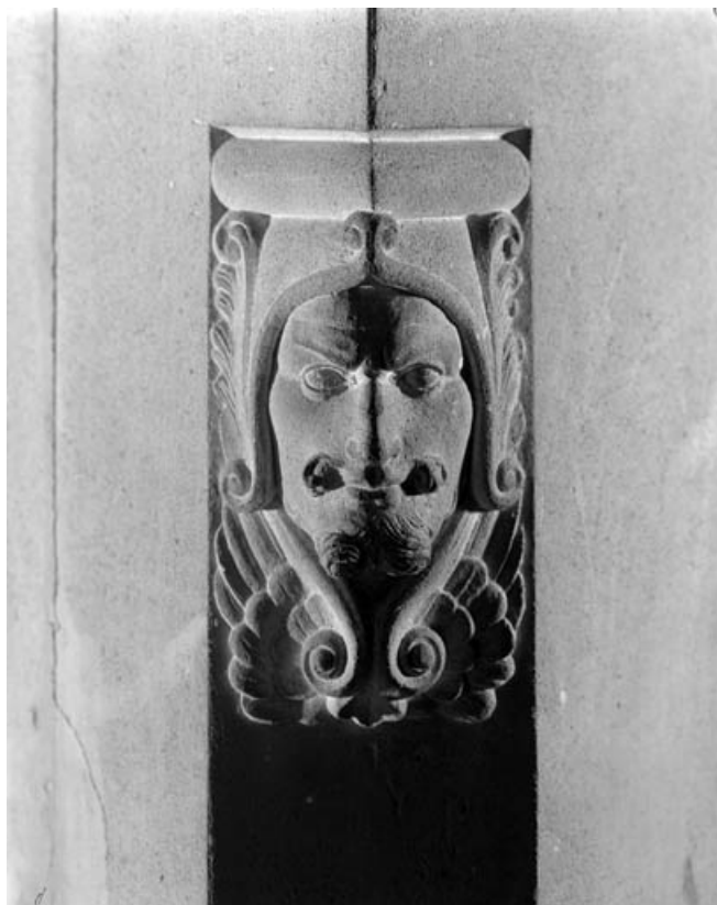
Détail d'un bas-relief de la table d'autel.