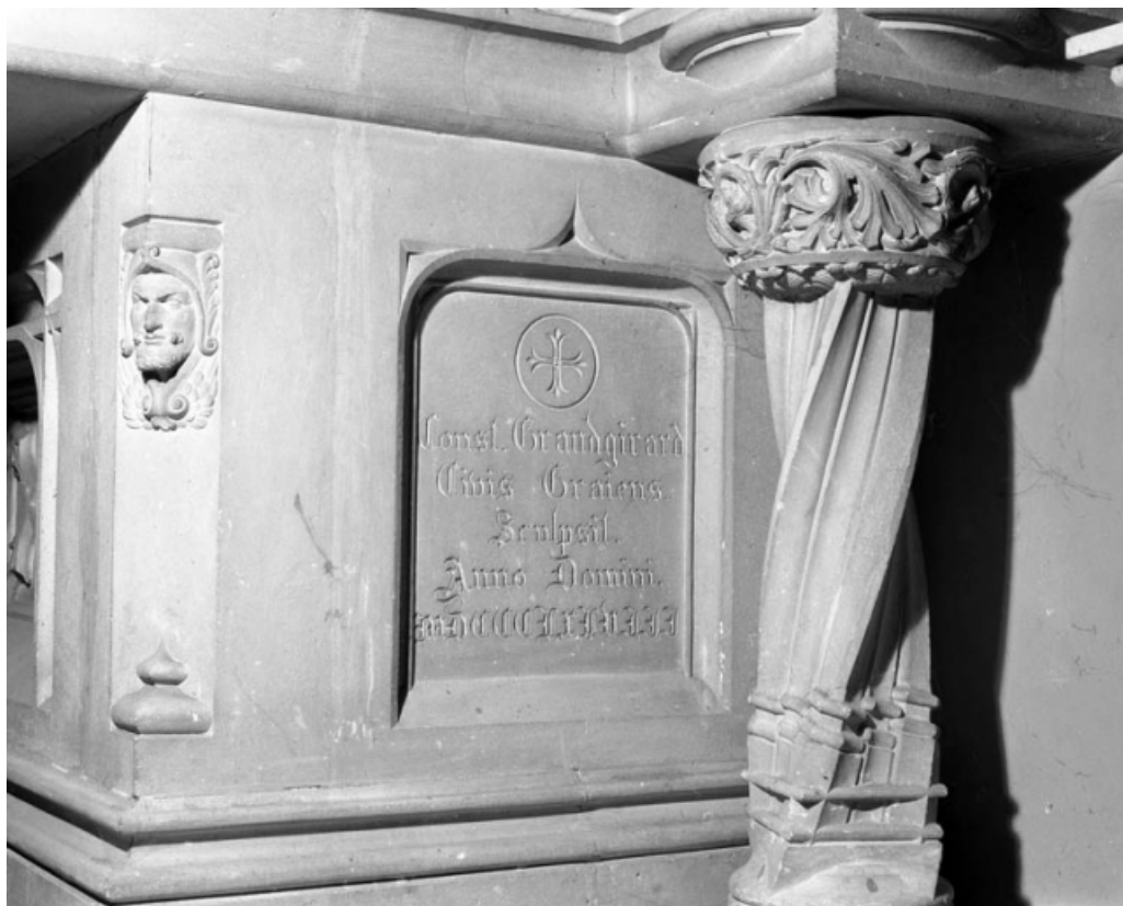
Détail de la face latérale droite de l'autel avec date et signature.