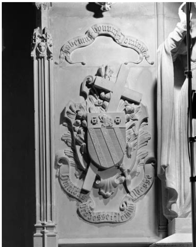
Détail du pied droit de la table d'autel.