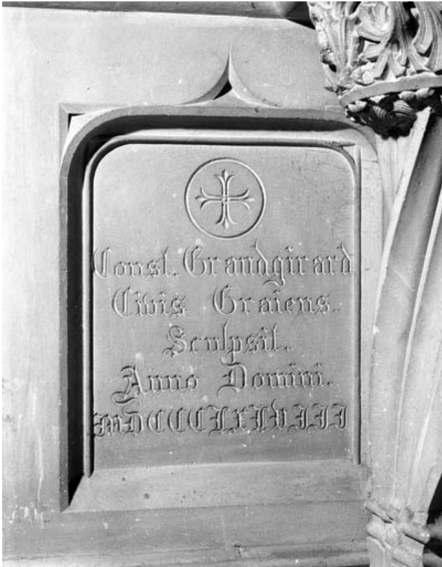
Détail : date et signature.