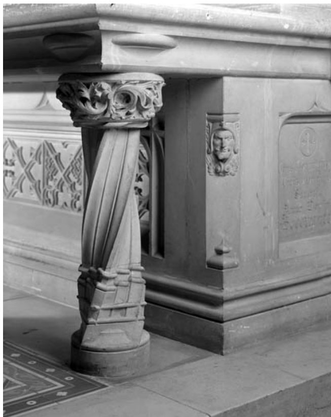
Détail du blason de saint Pierre Fourier.