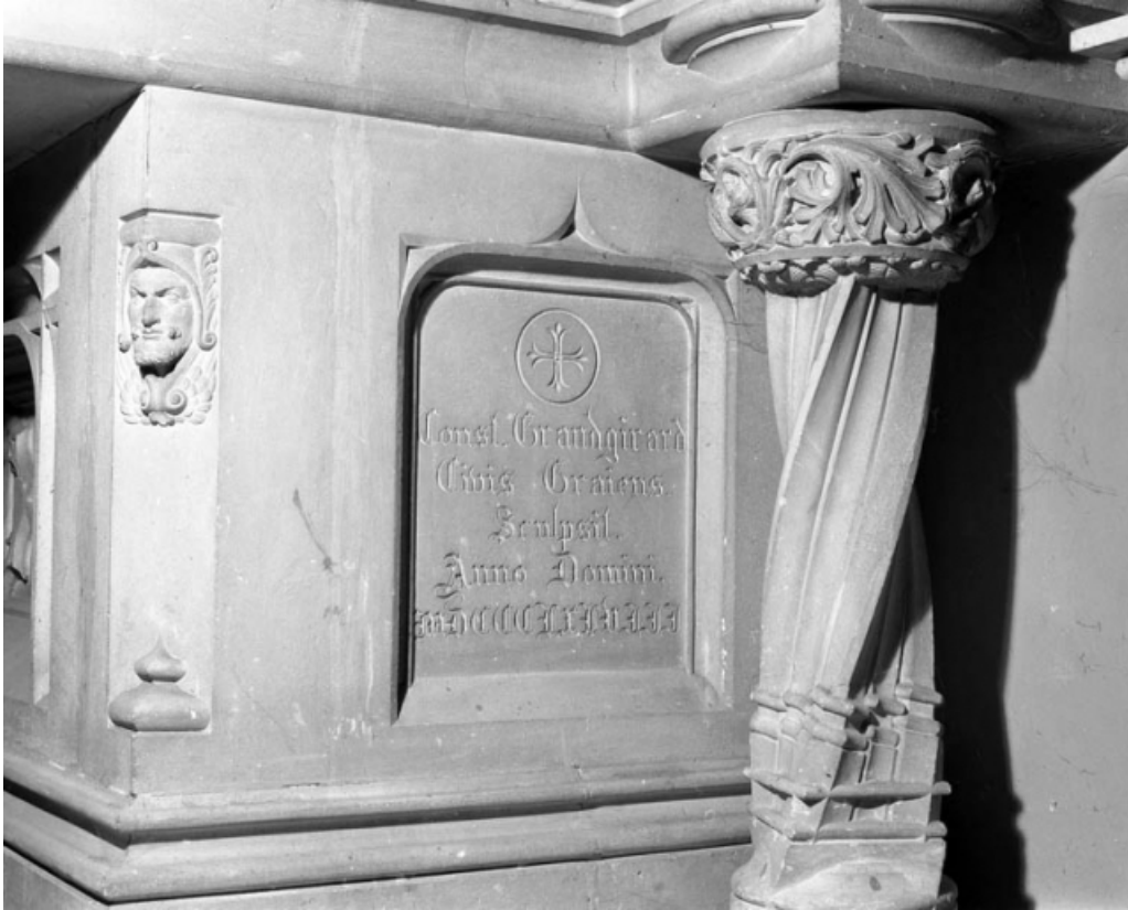
Détail de la face latérale droite de l'autel avec date et signature.