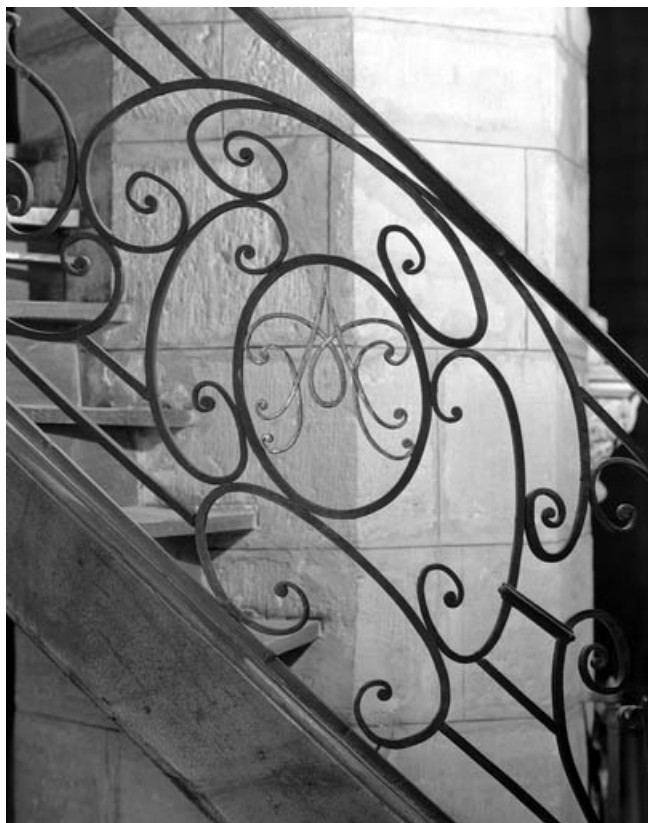
Détail de la ferronnerie de l'escalier avec monogramme de la Vierge.