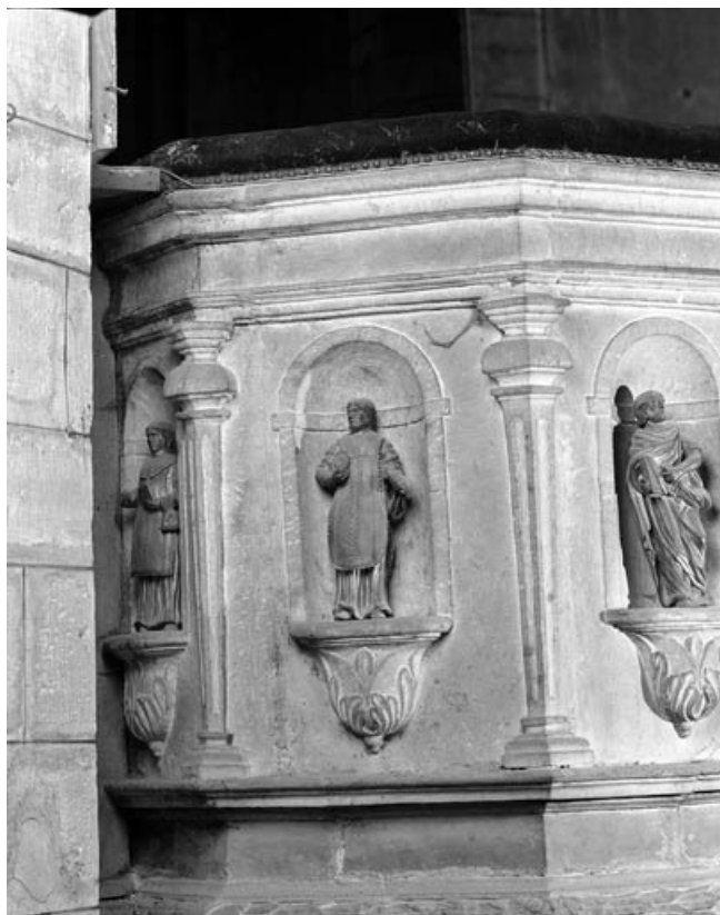
Détail de la cuve : partie gauche avec statuette d'un diacre.