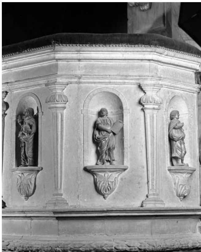
Détail de la cuve : partie droite avec statuette de deux évangélistes.