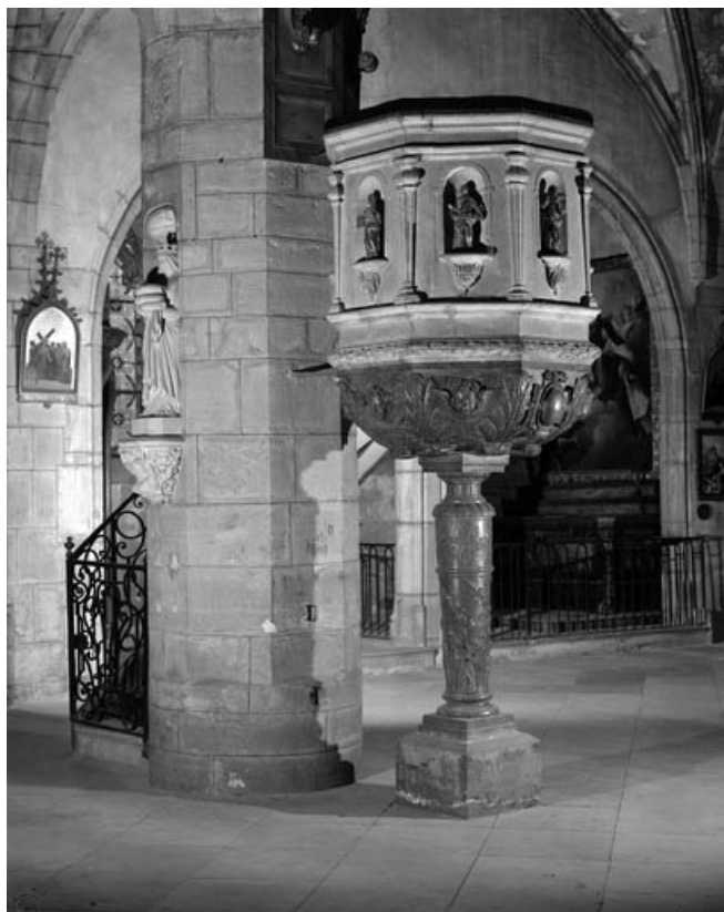
Vue d'ensemble de la cuve et du pied.