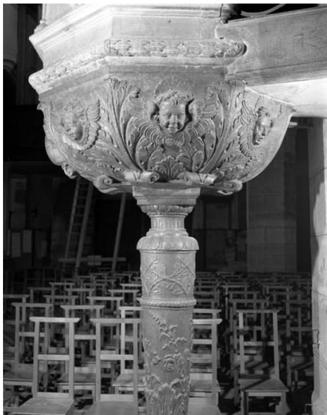
Détail de la partie inférieure de la cuve et du pied : partie droite.