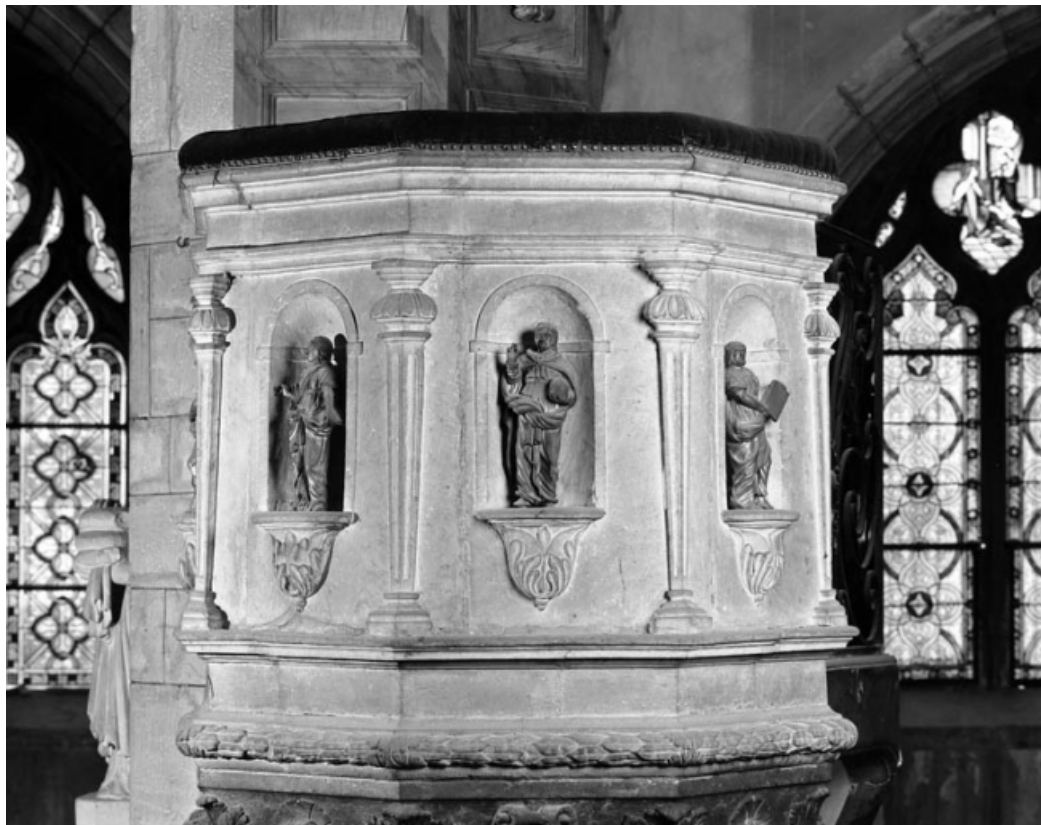
Détail de la cuve, de face : avec statuette du Christ et de deux évangélistes.