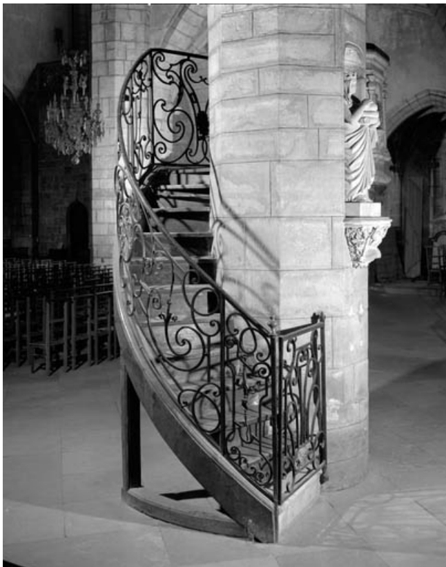
Vue d'ensemble de l'escalier en ferronnerie.