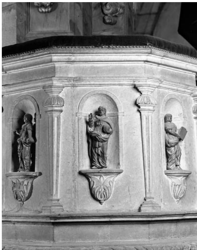
Détail de la cuve, de face : vue rapprochée avec statuette du Christ.