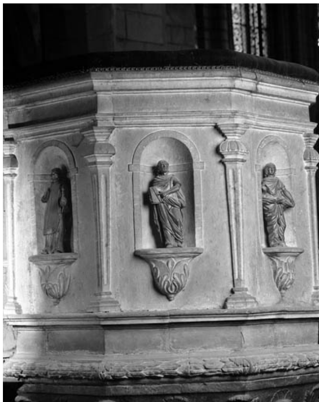
Détail de la cuve : partie gauche avec statuette d'un évangéliste.