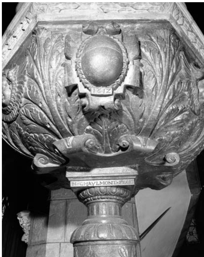
Détail de la partie inférieure de la cuve : de face.