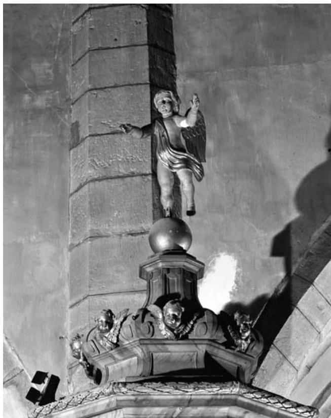
Détail du sommet de l'abat-voix.