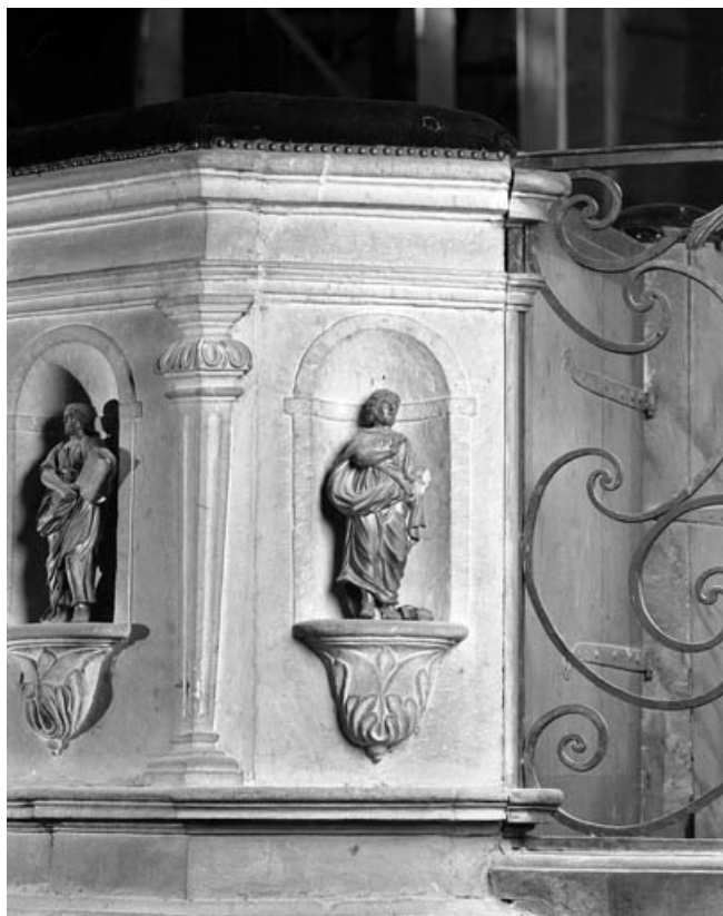
Détail de la cuve : partie droite avec statuette d'un évangéliste.