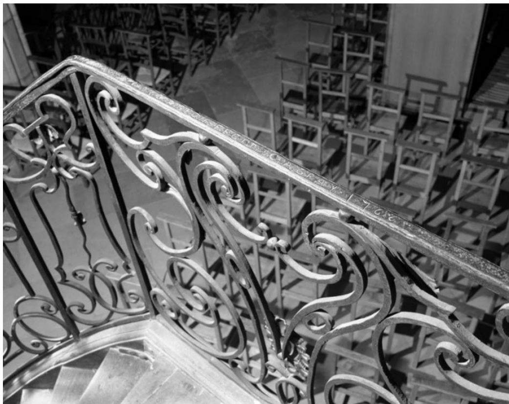
Détail de la ferronnerie de l'escalier avec date et signature.