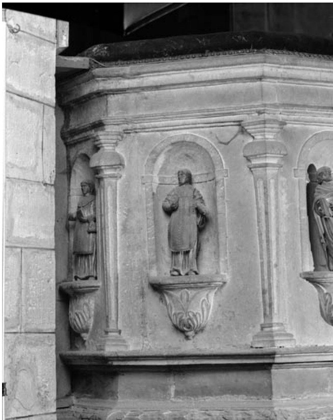
Détail de la cuve : partie gauche avec statuette de deux diacres.