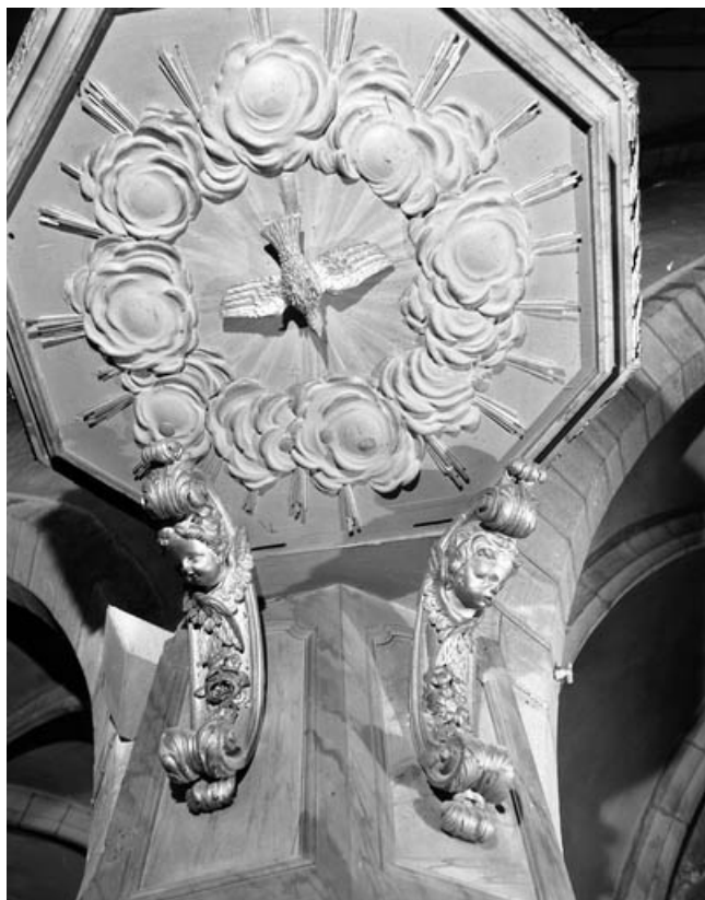
Détail du plafond de l'abat-voix.