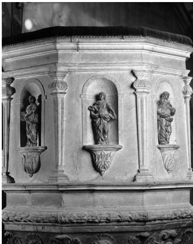
Détail de la cuve : partie gauche avec statuette d'un évangéliste (saint Jean ?).