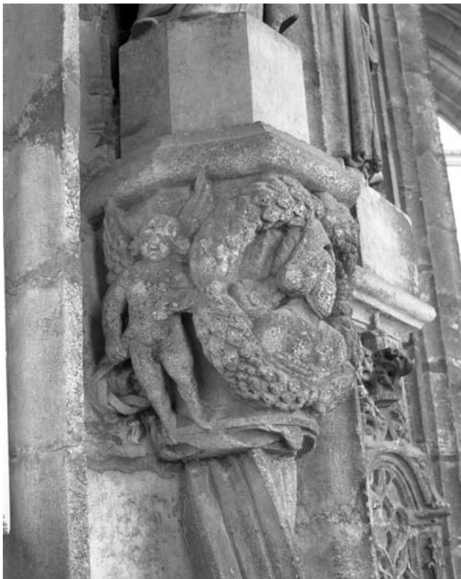
Premier bas-relief droit : allégorie de la vertu, partie gauche. 70, Gray place de la Sous-Préfecture