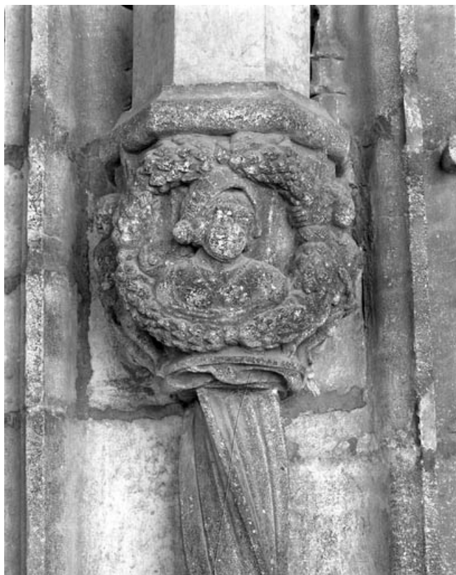
Premier bas-relief droit : allégorie de la vertu, de face.