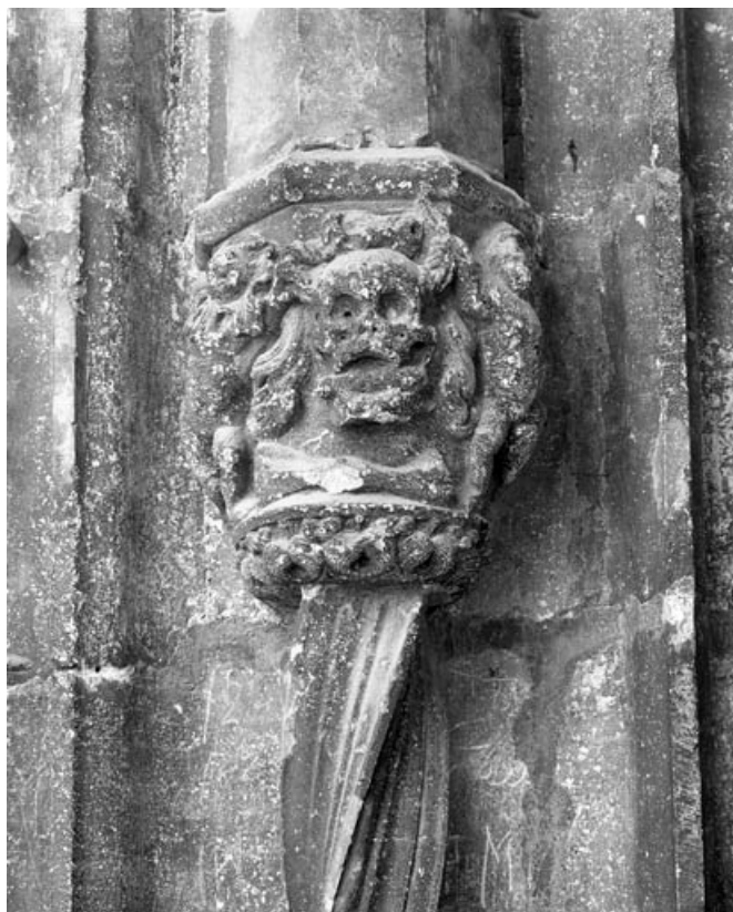
Premier bas-relief gauche : allégorie de la mort, de face.