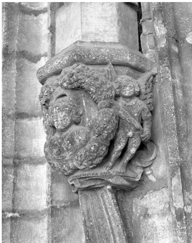
Premier bas-relief droit : allégorie de la vertu, partie droite.