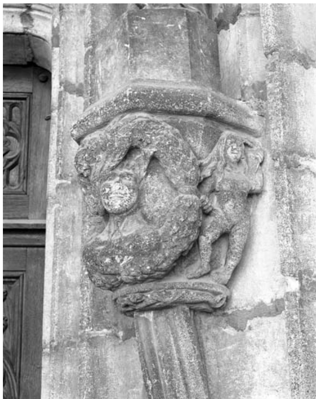
Deuxième bas-relief droit : allégorie du vice, de face.