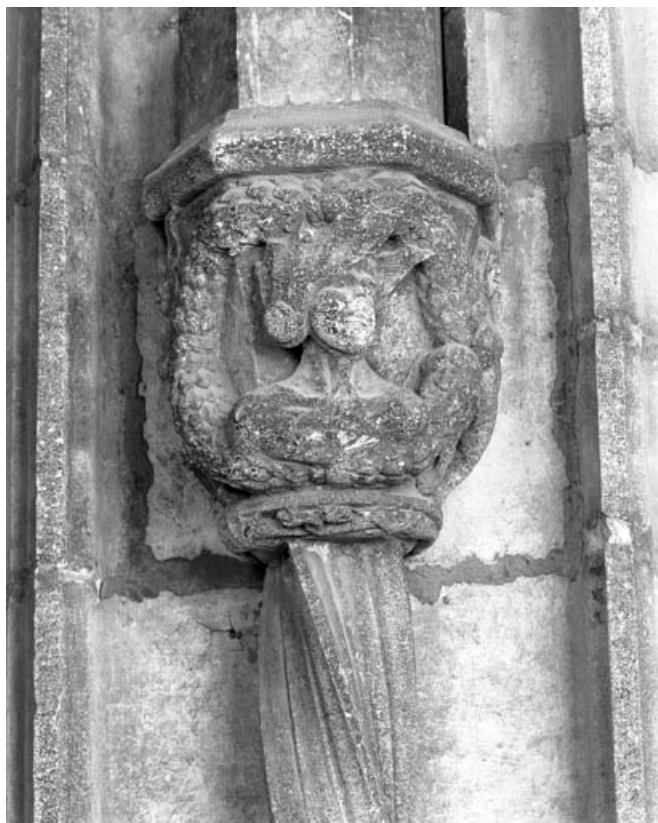
Deuxième bas-relief droit : allégorie du vice, partie droite.