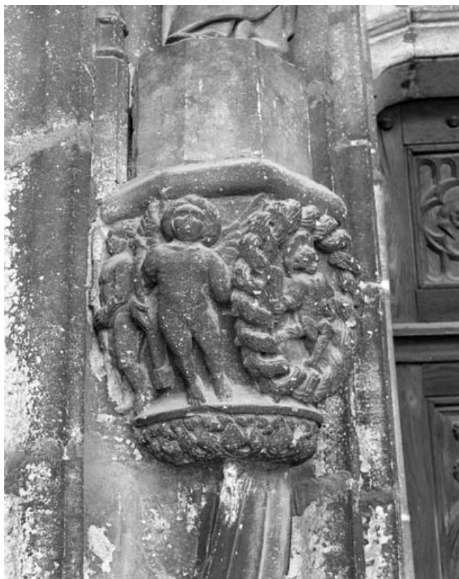
Deuxième bas-relief gauche : allégorie de la vie, partie gauche. 70, Gray place de la Sous-Préfecture