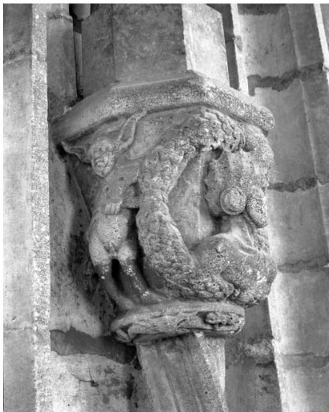
Deuxième bas-relief droit : allégorie du vice, partie gauche.