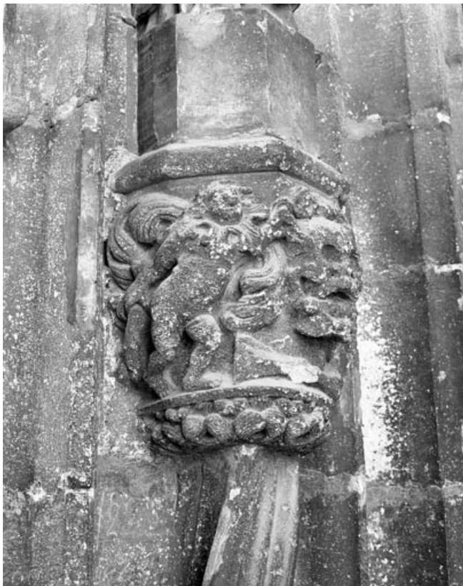
Premier bas-relief gauche : allégorie de la mort, partie gauche. 70, Gray place de la Sous-Préfecture