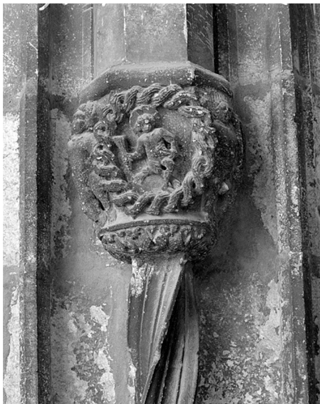
Deuxième bas-relief gauche : allégorie de la vie, de face.