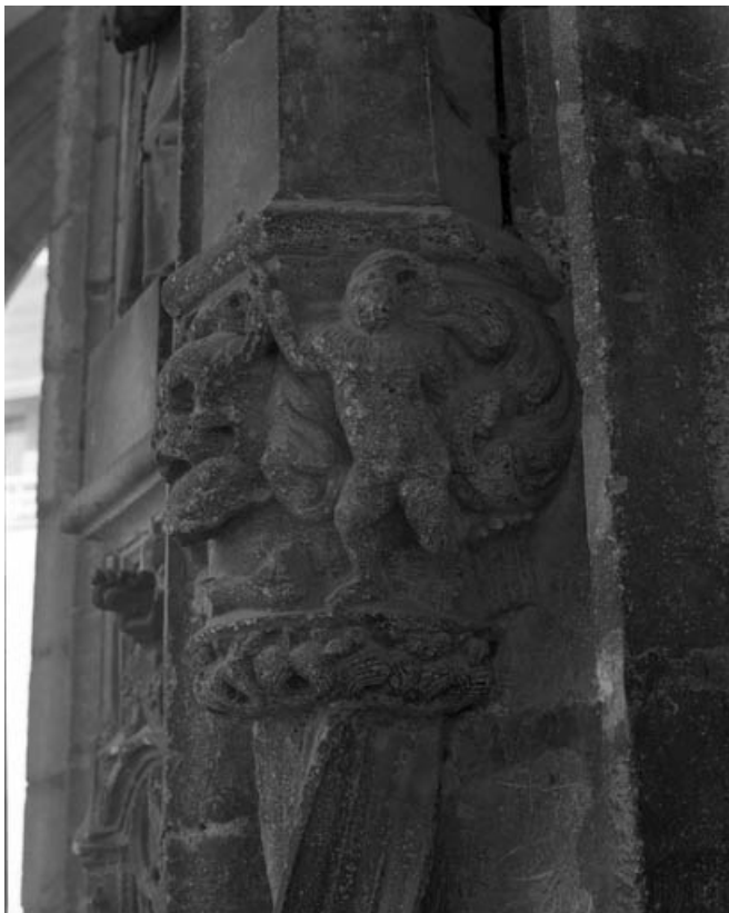
Premier bas-relief gauche : allégorie de la mort, partie droite. 70, Gray place de la Sous-Préfecture