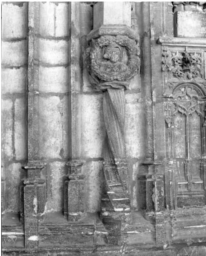
Premier bas-relief droit : allégorie de la vertu, vue d'ensemble. 70, Gray place de la Sous-Préfecture