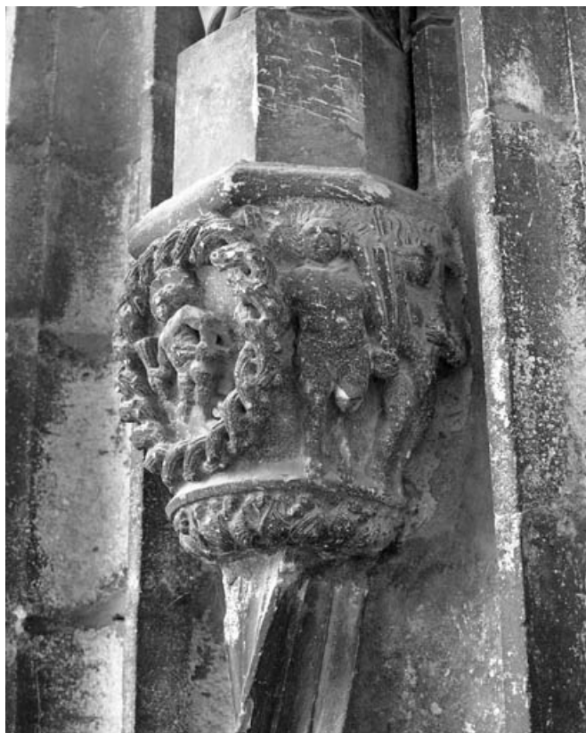
Deuxième bas-relief gauche : allégorie de la vie, partie droite. 70, Gray place de la Sous-Préfecture