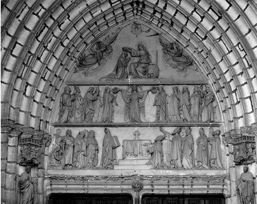
Vue d'ensemble, de face.