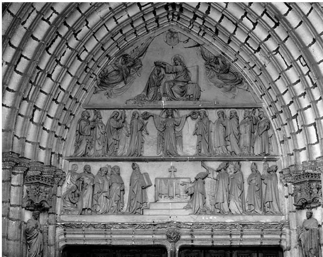
Vue d'ensemble, de face.