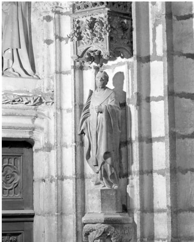
Saint Ferjeux : de trois quarts droit.