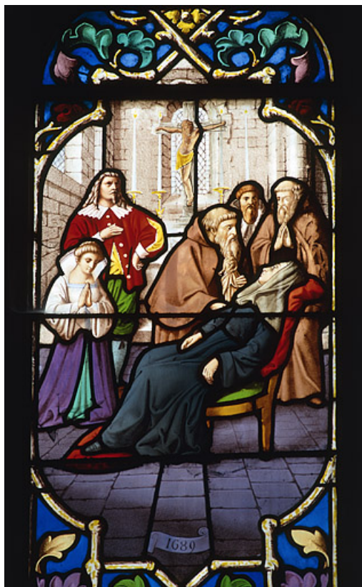
Détail de la guérison d'une religieuse ursuline, 1689 70, Gray place de la Sous-Préfecture