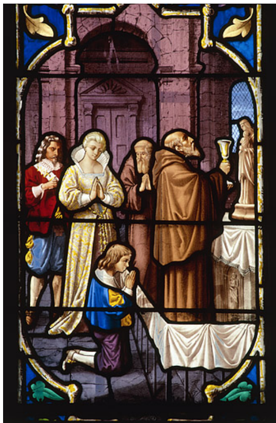
Détail de l'action de grâce du premier miraculé 70, Gray place de la Sous-Préfecture