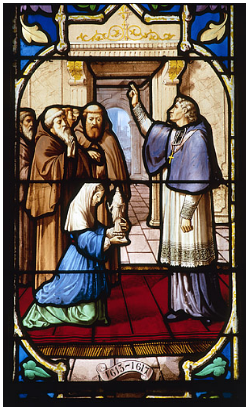
Détail de la bénédiction de la statue miraculeuse, 1613 70, Gray place de la Sous-Préfecture