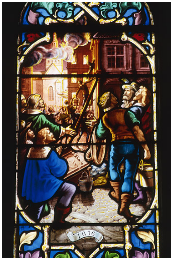
Détail de l'hôtel de ville préservé des flammes, 1676 70, Gray place de la Sous-Préfecture