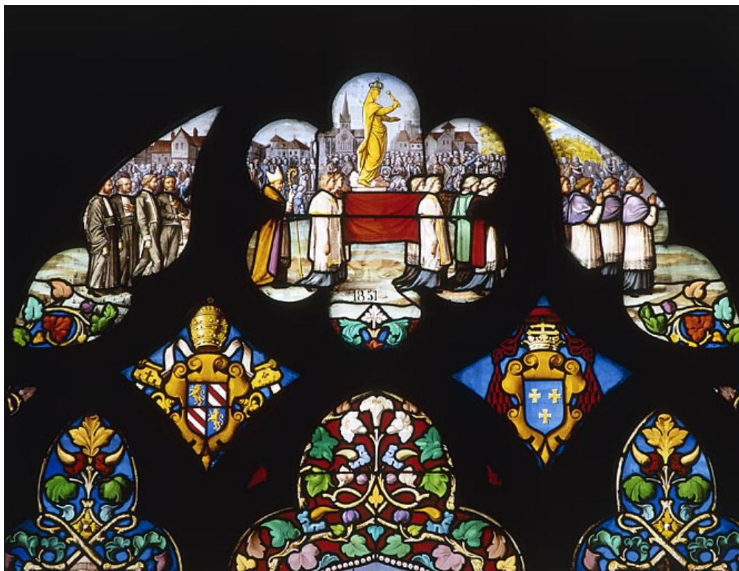
Détail de la procession de Notre-Dame de Gray en 1857