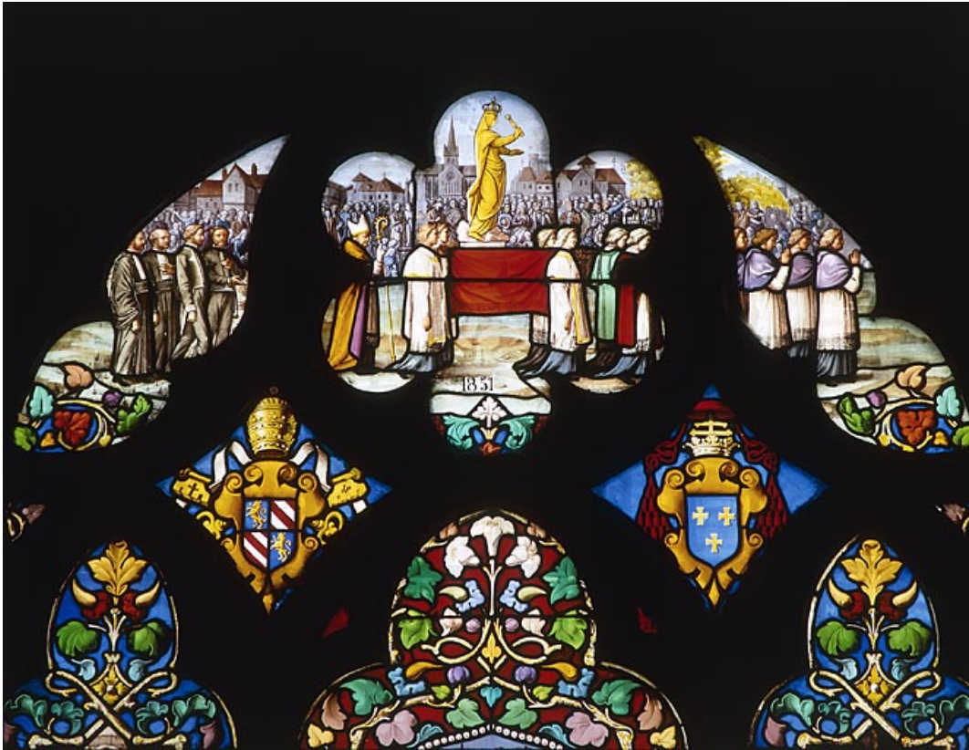
Détail de la procession de Notre-Dame de Gray en 1857