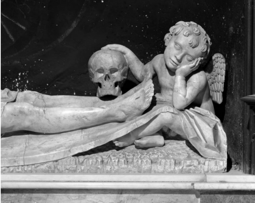
Le Christ mort : détail des pieds avec un ange, la main posée sur un crâne. 70, Gray place de la Sous-Préfecture