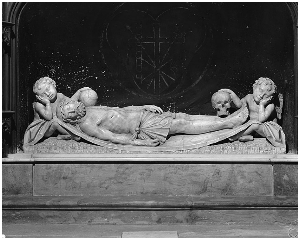
Le Christ mort : vue de face.