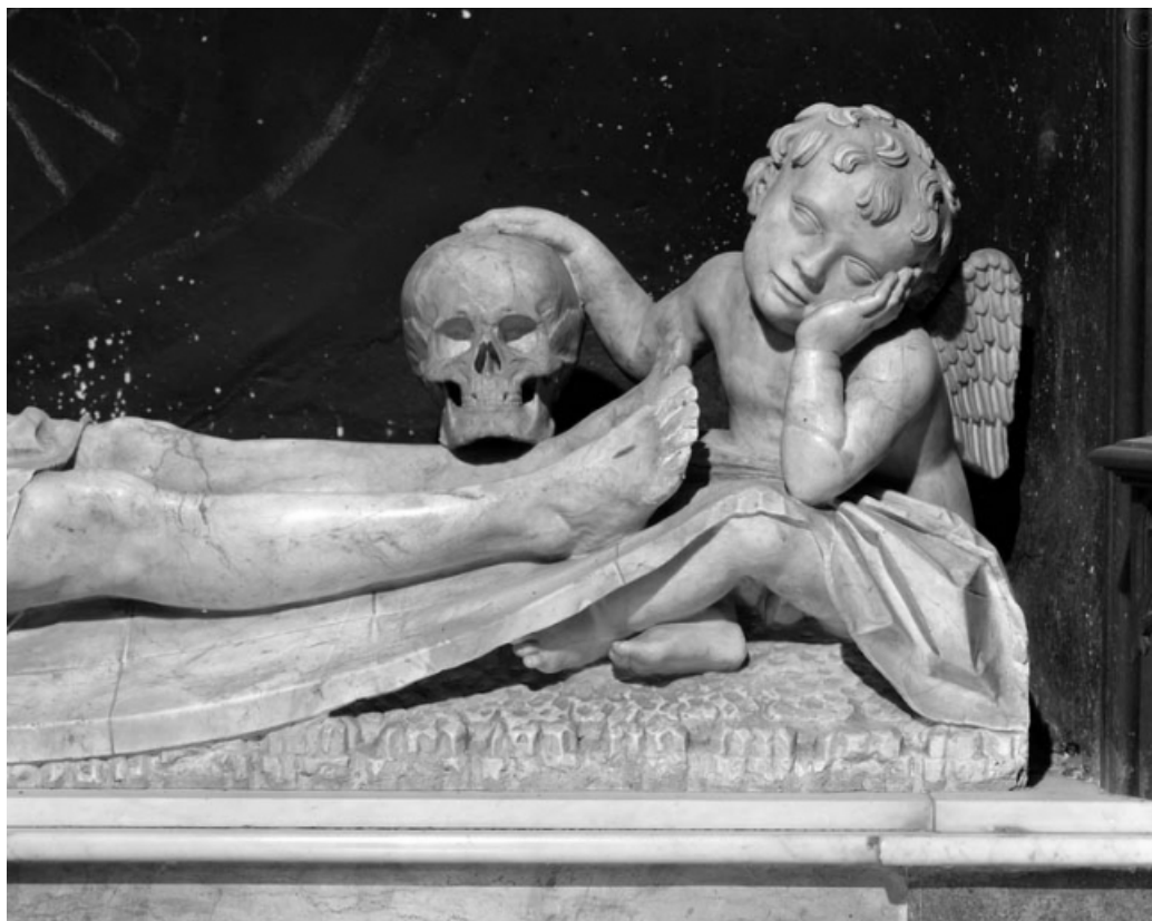
Le Christ mort : détail des pieds avec un ange, la main posée sur un crâne. 70, Gray place de la Sous-Préfecture