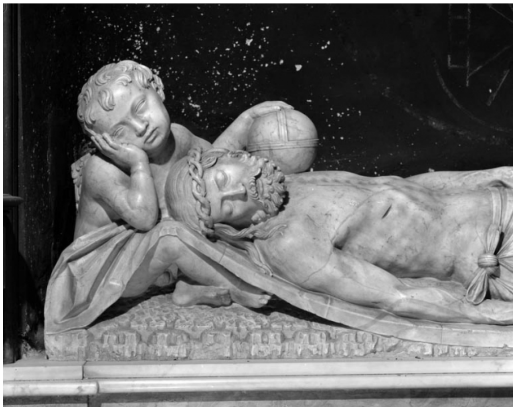
Le Christ mort : détail du buste et de la tête.