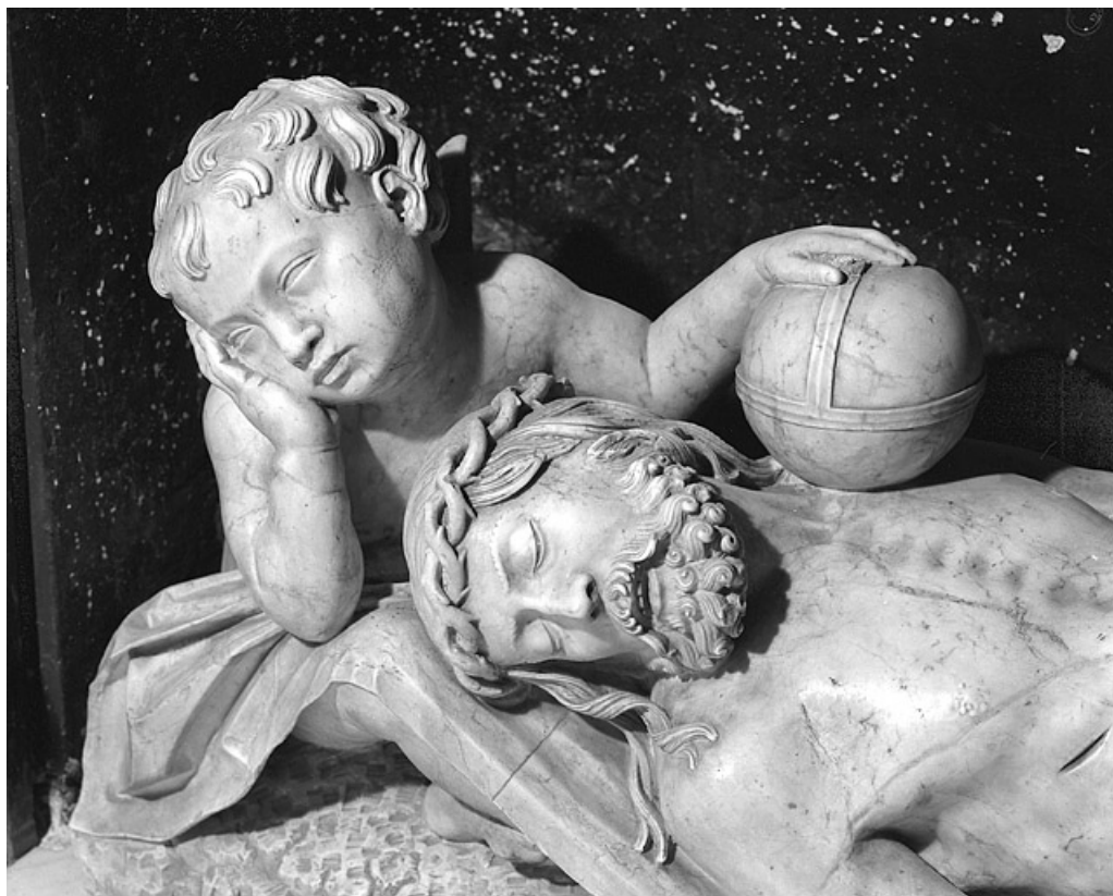
Le Christ mort : détail de la tête avec un ange, la main posée sur un globe. 70, Gray place de la Sous-Préfecture