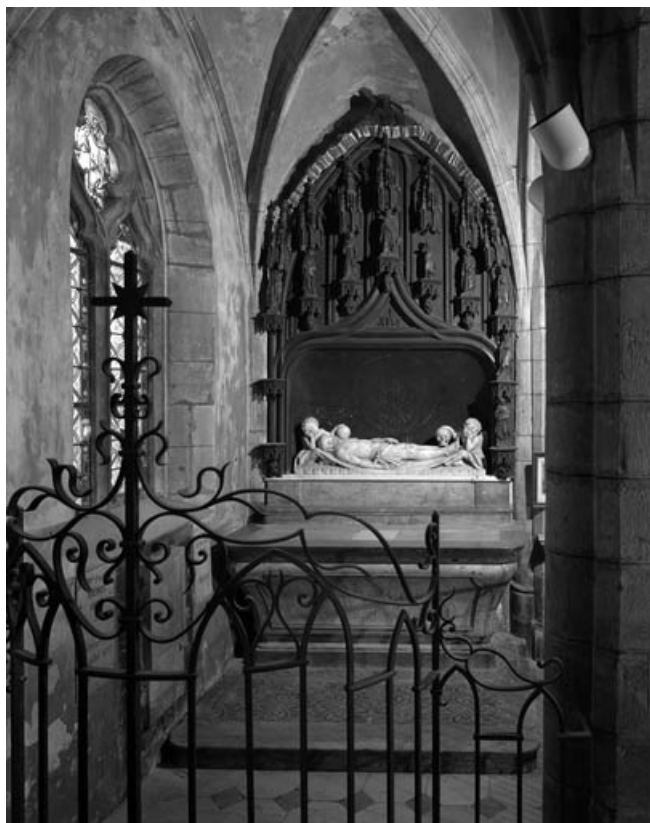
Vue d'ensemble depuis la grille des fonds baptismaux.