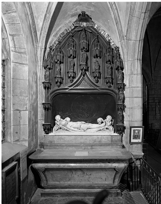
Vue d'ensemble, de face.