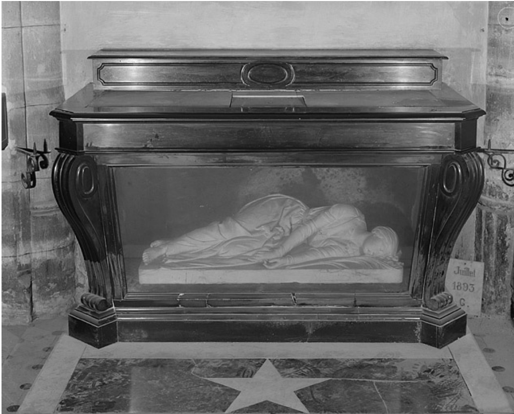
Vue d'ensemble rapprochée.