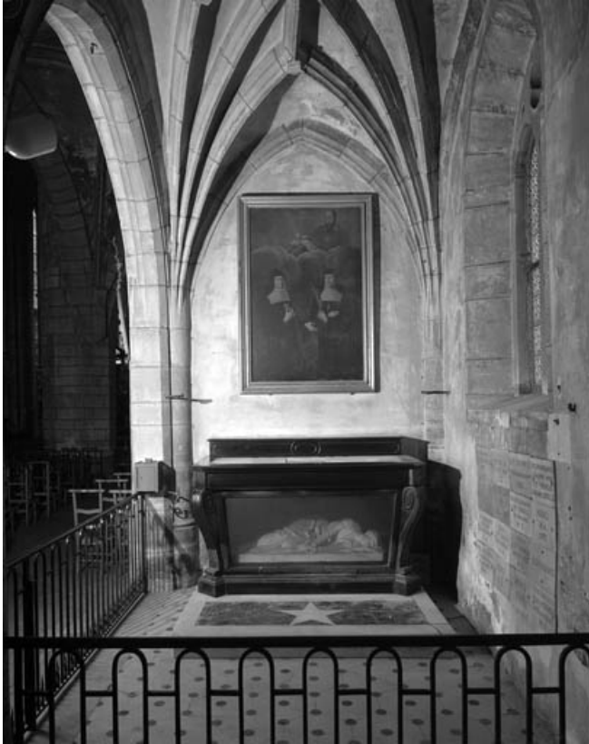
Vue d'ensemble, de face.