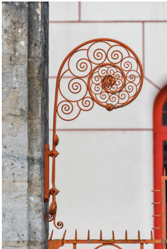
Élément en forme de volute sur le poteau de gauche (vue rapprochée).

58, Cosne-Cours-sur-Loire, 2 rue Saint-Agnan