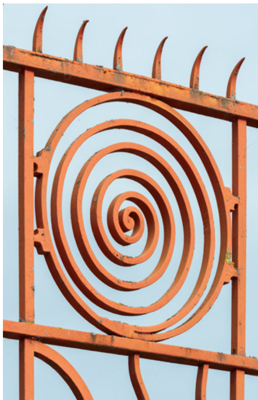
Partie haute d'un vantail : motif circulaire.

58, Cosne-Cours-sur-Loire, 2 rue Saint-Agnan