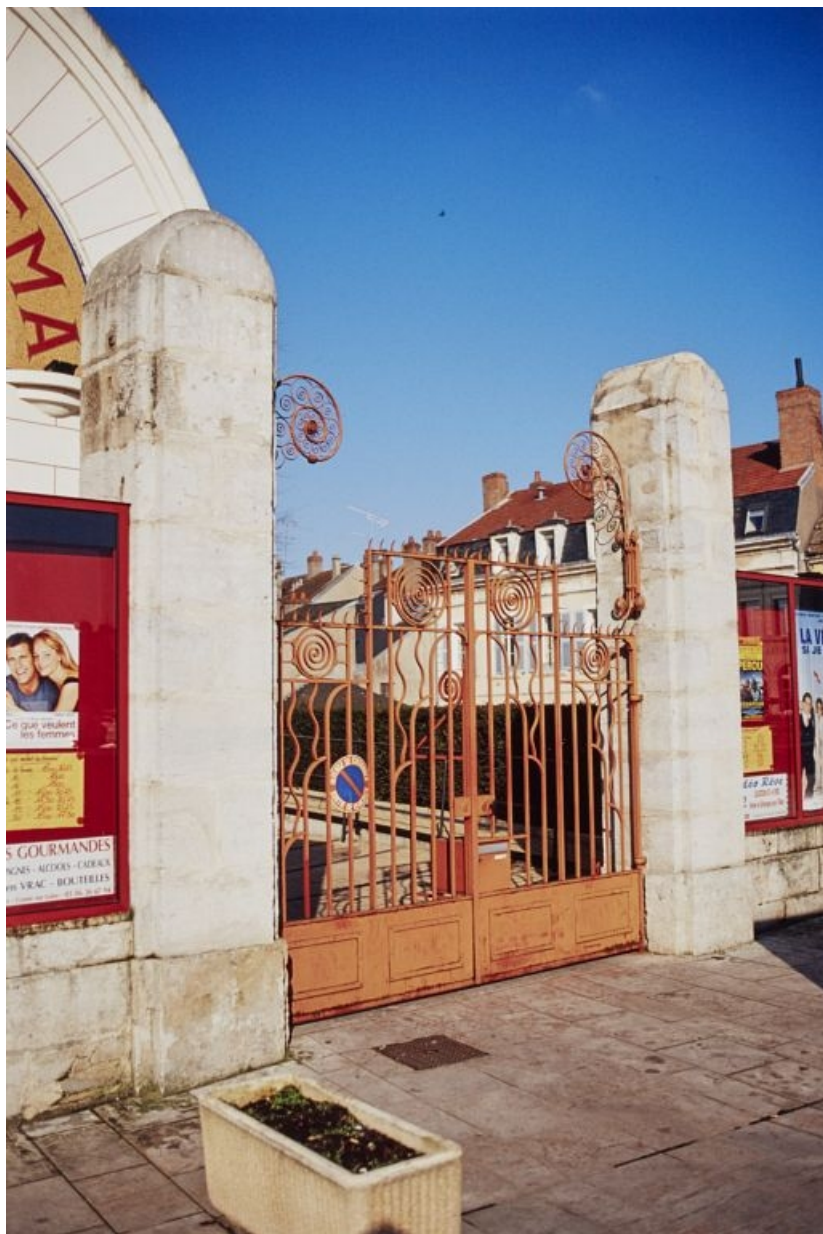
Vue d'ensemble de trois quarts gauche, en 2001.

58, Cosne-Cours-sur-Loire, 2 rue Saint-Agnan