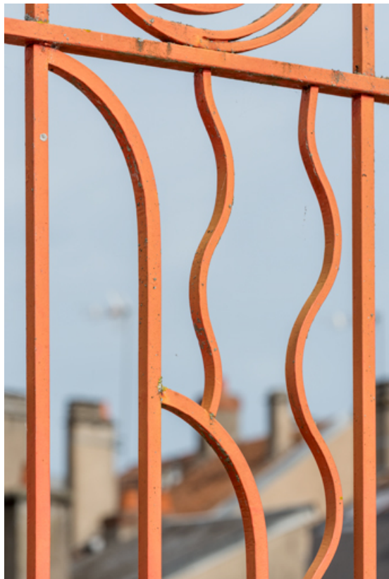
Partie haute d'un vantail : motif en vague.

58, Cosne-Cours-sur-Loire, 2 rue Saint-Agnan