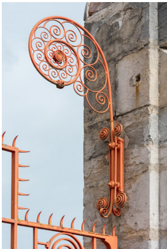
Élément en forme de volute sur le poteau de droite.

58, Cosne-Cours-sur-Loire, 2 rue Saint-Agnan