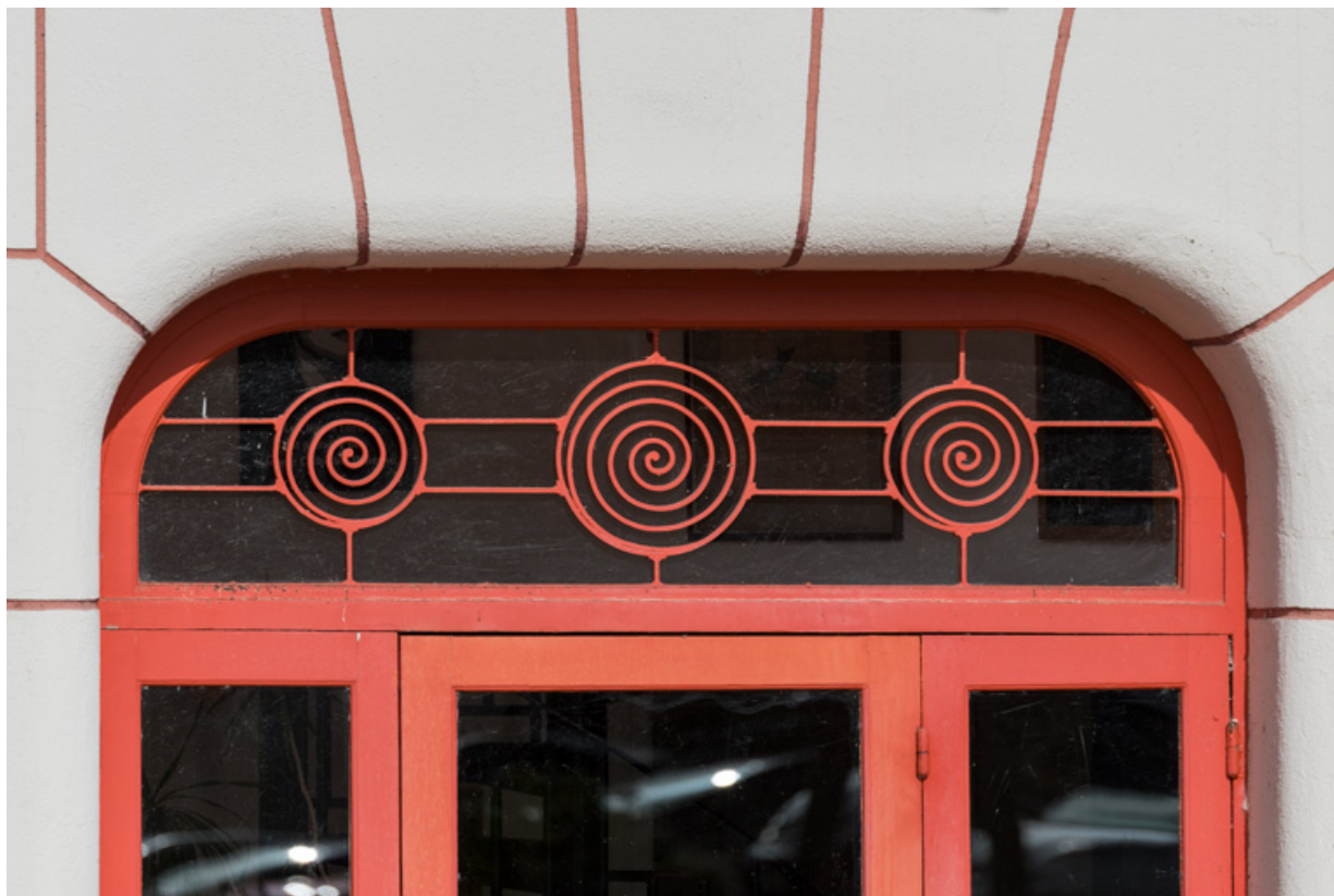
Façade antérieure : ferronnerie de la baie centrale.

58, Cosne-Cours-sur-Loire, 2 rue Saint-Agnan