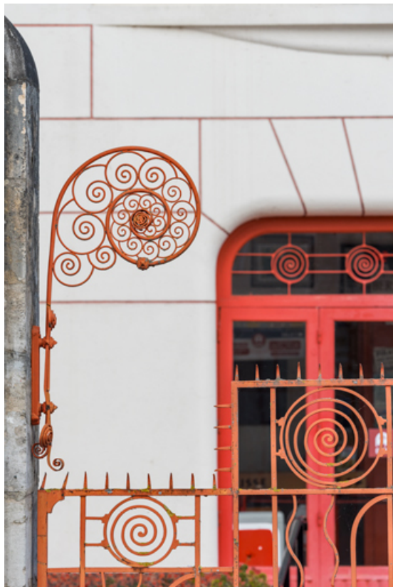
Élément en forme de volute sur le poteau de gauche.

58, Cosne-Cours-sur-Loire, 2 rue Saint-Agnan