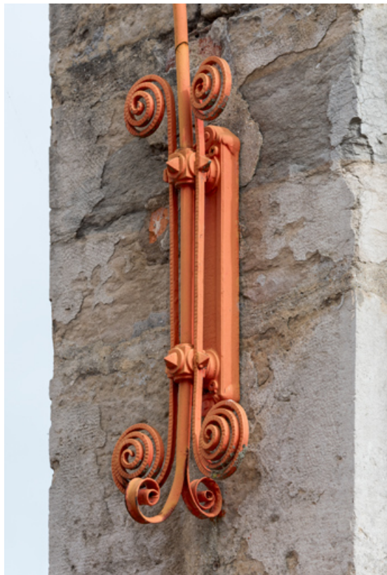
Élément en forme de volute sur le poteau de droite (détail).

58, Cosne-Cours-sur-Loire, 2 rue Saint-Agnan