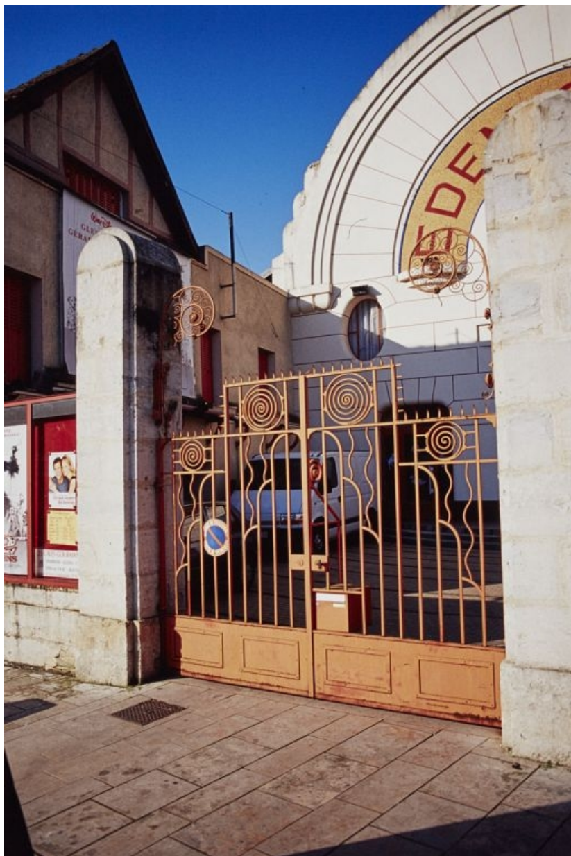
Vue d'ensemble de trois quarts droite, en 2001.

58, Cosne-Cours-sur-Loire, 2 rue Saint-Agnan