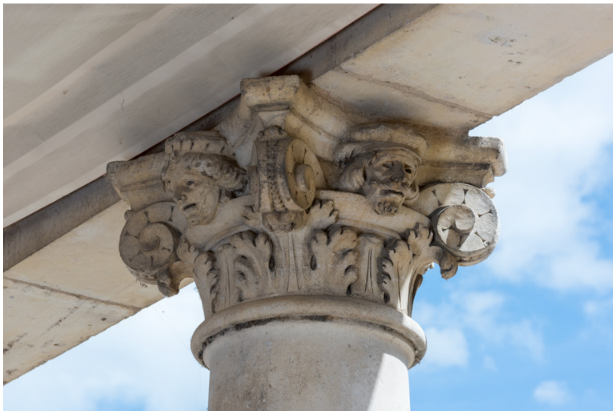
3e colonne, chapiteau : deux têtes (sur les faces arrière et gauche). 58, Nevers, 8 place des Reines de Pologne