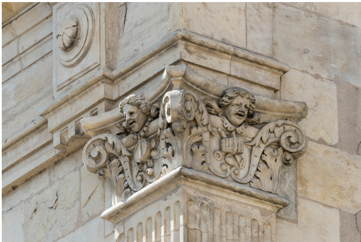
4e pilastre à l'étage carré (à droite), chapiteau : deux têtes.

58, Nevers, 8 place des Reines de Pologne