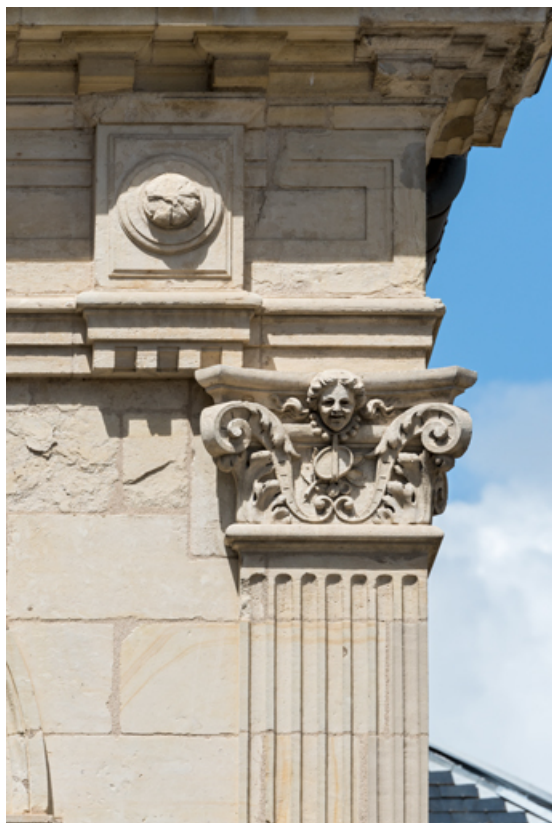
4e pilastre à l'étage carré (à droite), chapiteau : tête sur la face avant. 58, Nevers, 8 place des Reines de Pologne