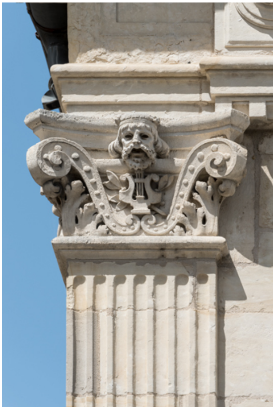
1er pilastre à l'étage carré (à gauche), chapiteau : tête sur la face avant. 58, Nevers, 8 place des Reines de Pologne