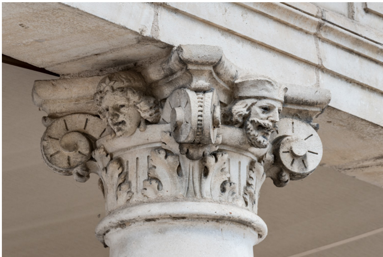
2e colonne, chapiteau : deux têtes (sur les faces gauche et avant).

58, Nevers, 8 place des Reines de Pologne