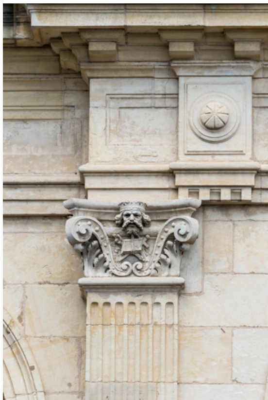
3e pilastre à l'étage carré, chapiteau : une tête.

58, Nevers, 8 place des Reines de Pologne