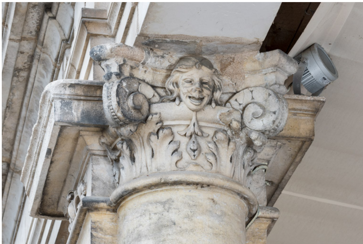
1re colonne (de gauche à droite), chapiteau : une tête souriante (sur la face droite). 58, Nevers, 8 place des Reines de Pologne