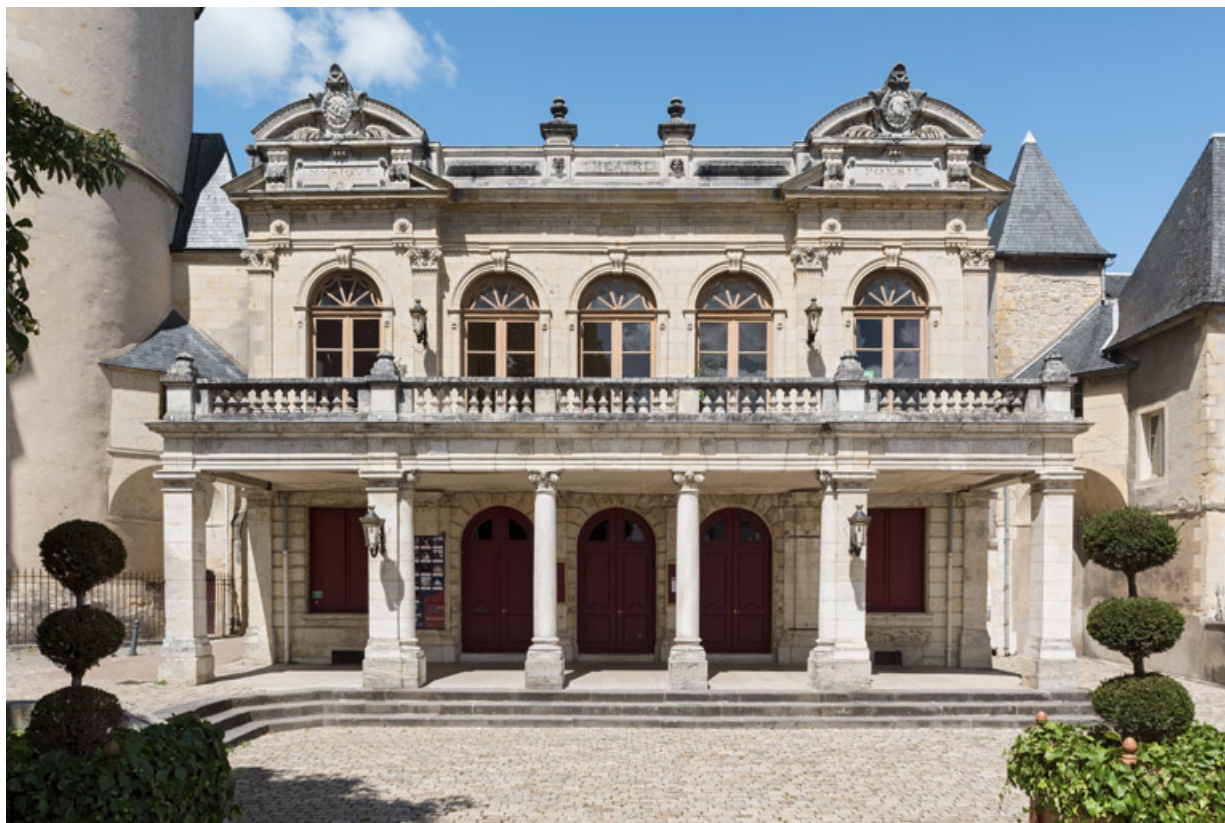
La façade principale du théâtre et son porche.

58, Nevers, 8 place des Reines de Pologne