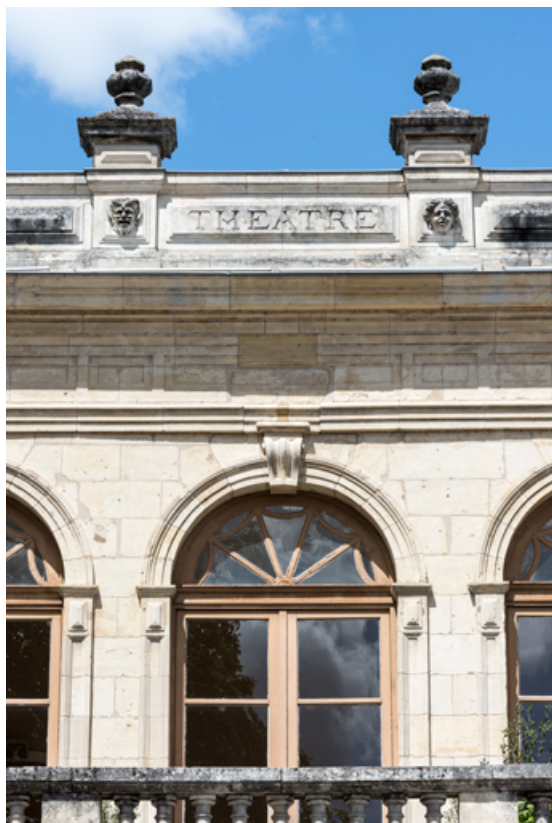
Travée centrale de la façade, à l'étage carré.

58, Nevers, 8 place des Reines de Pologne