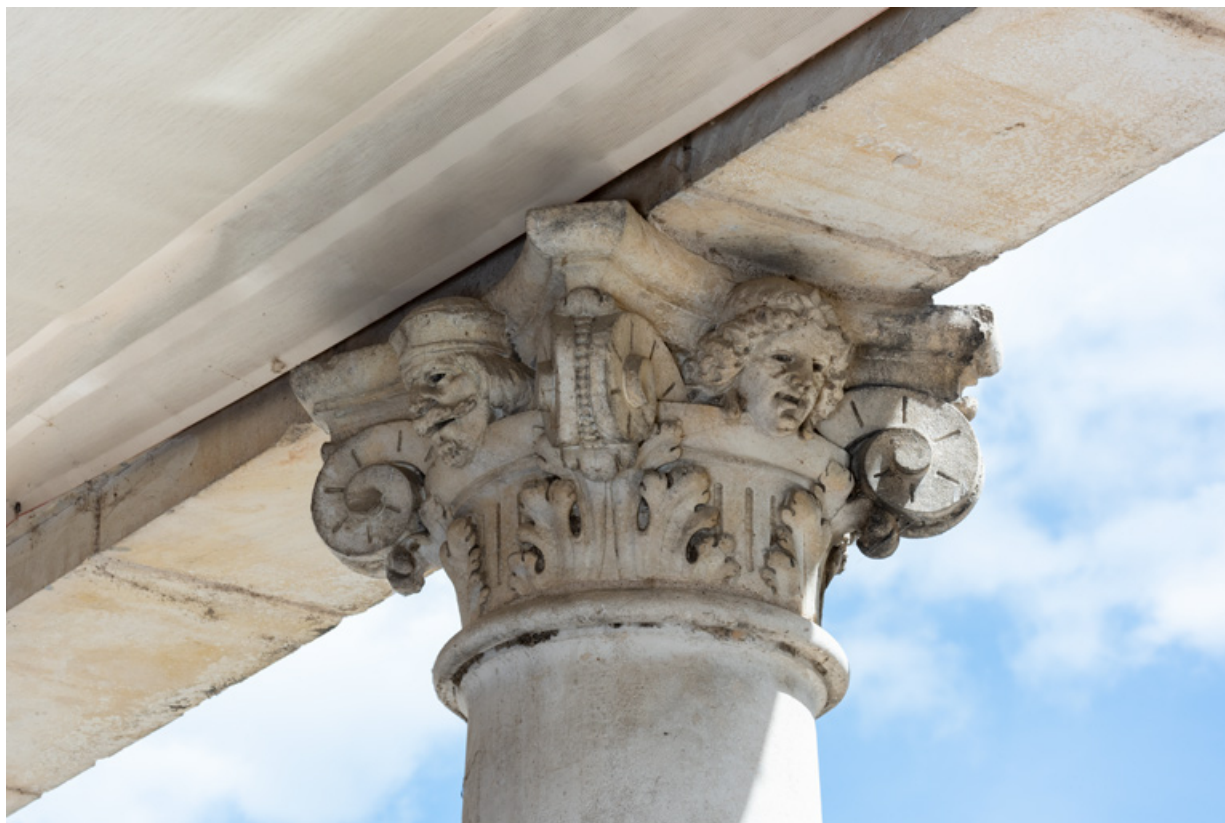
2e colonne, chapiteau : deux têtes (sur les faces arrière et gauche). 58, Nevers, 8 place des Reines de Pologne