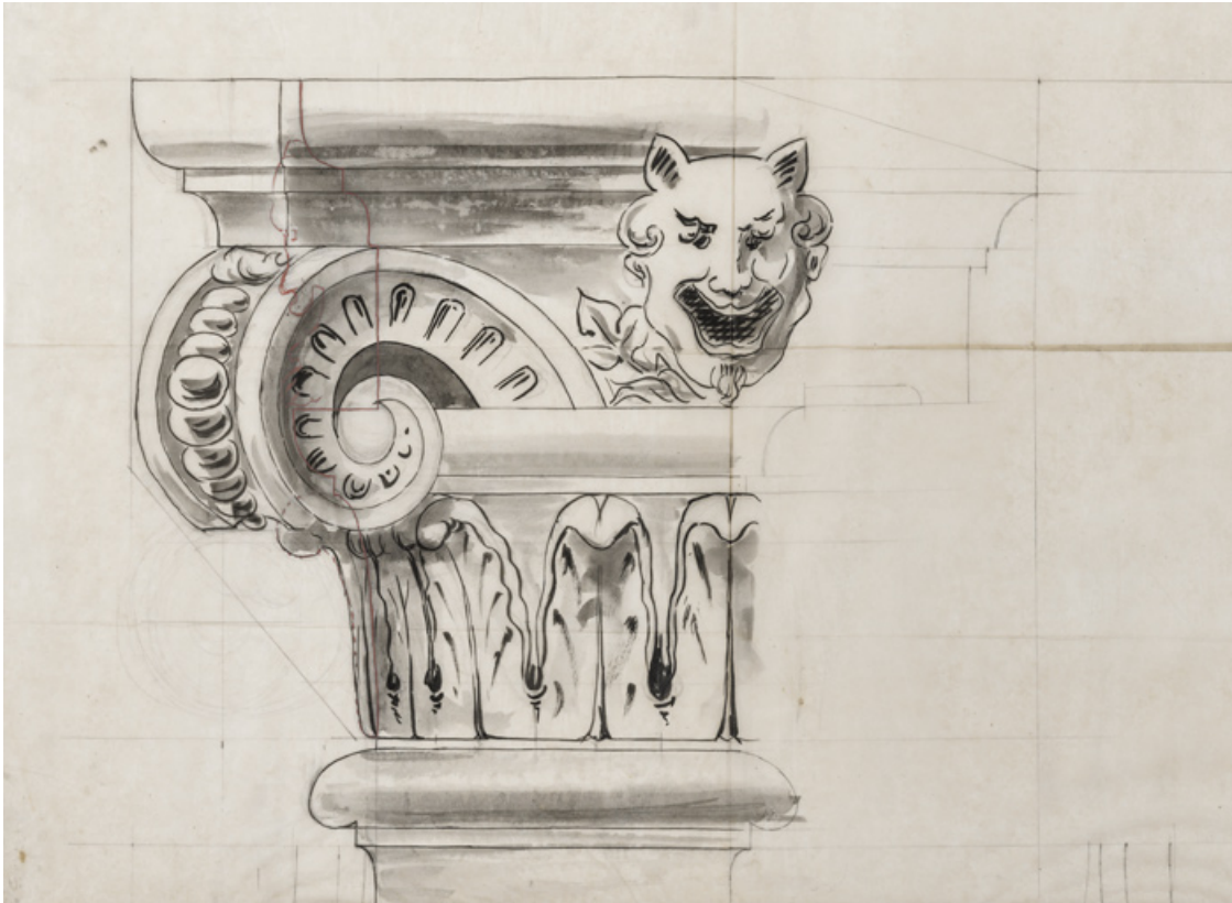
[Plan, coupe et élévation d'un chapiteau du porche]. 27 mars 1899.

58, Nevers, 8 place des Reines de Pologne