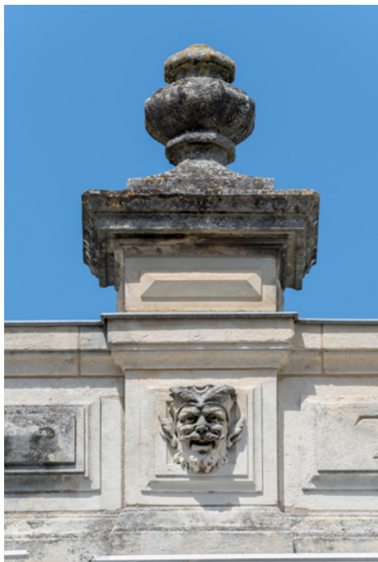
Partie centrale de l'attique : tête masculine (Faust ?).

58, Nevers, 8 place des Reines de Pologne