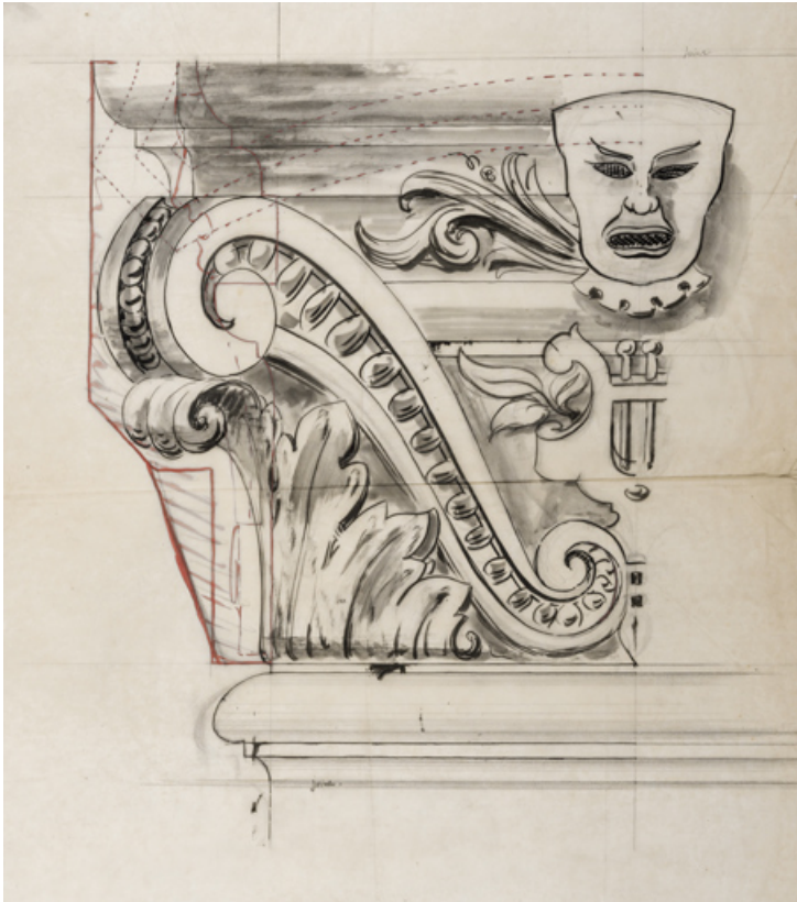
[Décor de chapiteau de pilastre, avec masque]. S.d. [1899 ?]. 58, Nevers, 8 place des Reines de Pologne