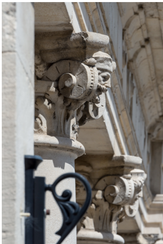
2e et 3e colonnes (de gauche à droite) : chapiteaux vus en enfilade. 58, Nevers, 8 place des Reines de Pologne