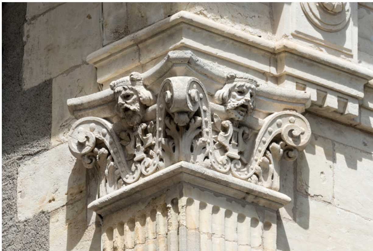
1er pilastre à l'étage carré (de gauche à droite), chapiteau : deux têtes.

58, Nevers, 8 place des Reines de Pologne