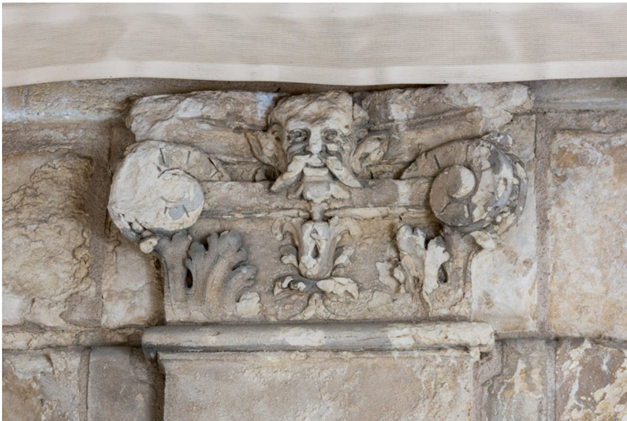
3e pilastre, chapiteau : tête (de faune ?). 58, Nevers, 8 place des Reines de Pologne