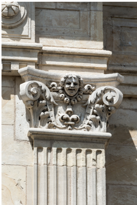
2e pilastre à l'étage carré, chapiteau : une tête.

58, Nevers, 8 place des Reines de Pologne