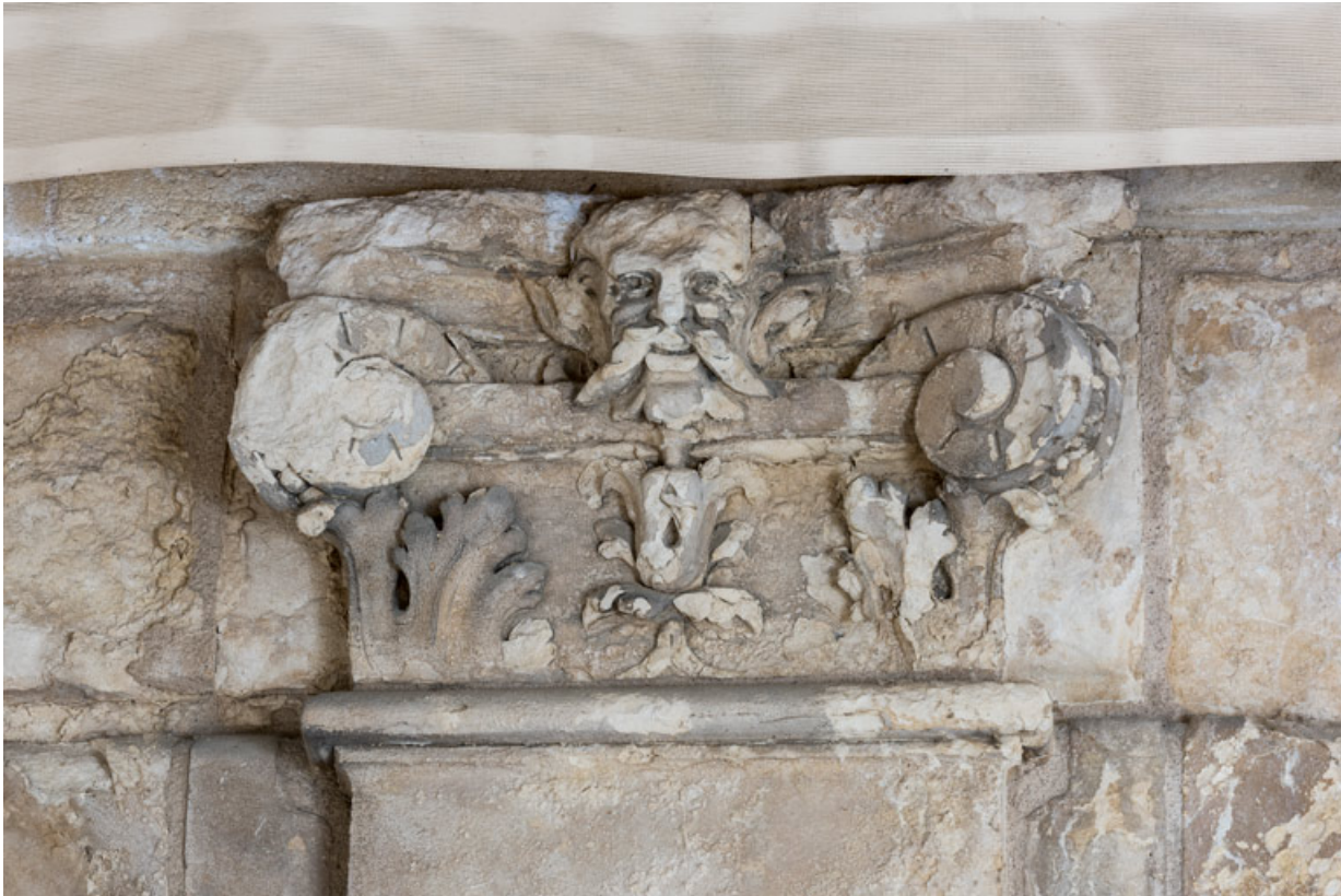
3e pilastre, chapiteau : tête (de faune ?).

58, Nevers, 8 place des Reines de Pologne