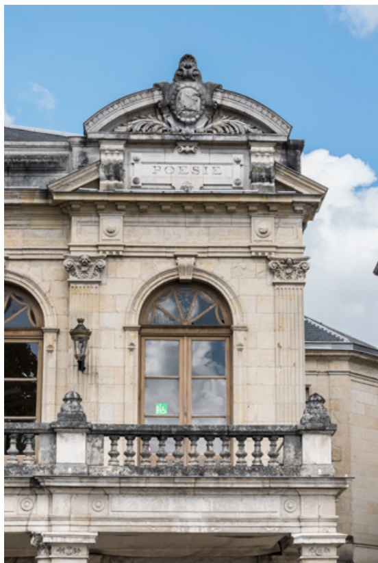
Travée droite de la façade, à l'étage carré.

58, Nevers, 8 place des Reines de Pologne