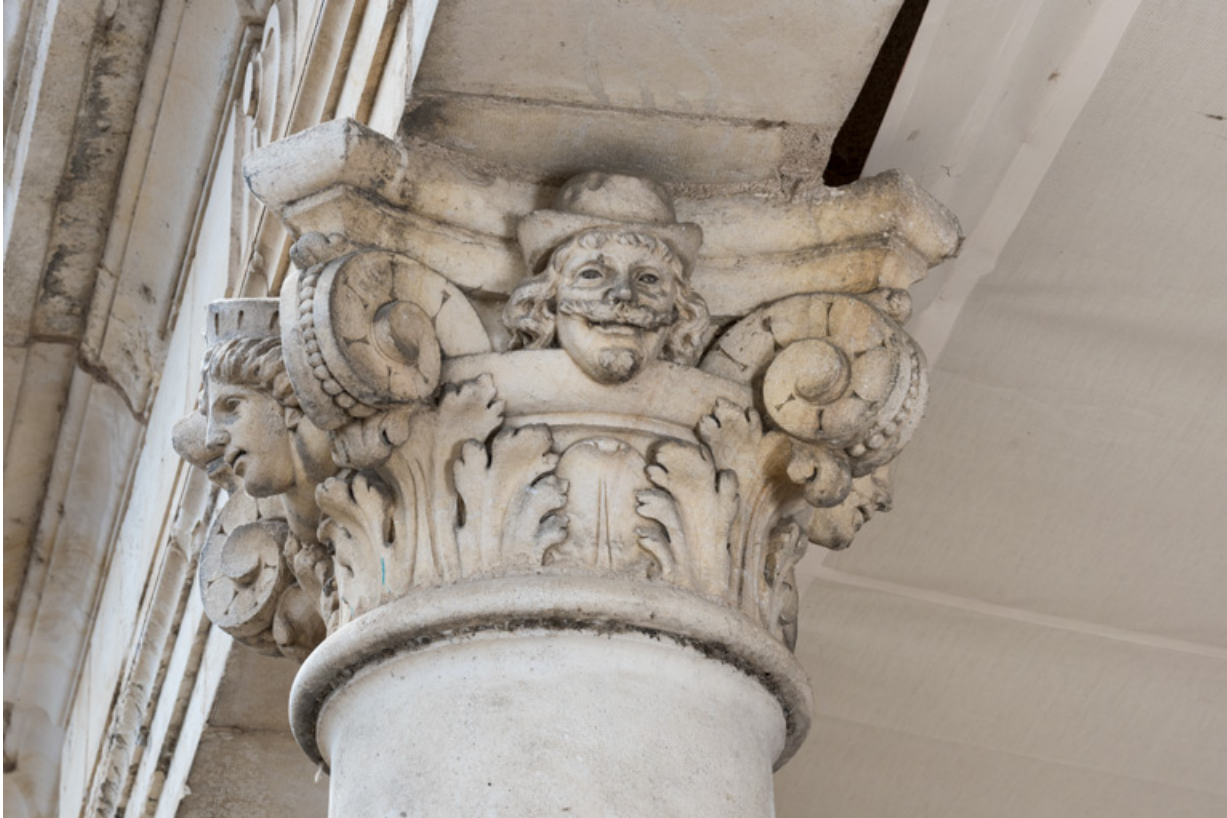
3e colonne, chapiteau : deux têtes (sur les faces avant et droite).

58, Nevers, 8 place des Reines de Pologne