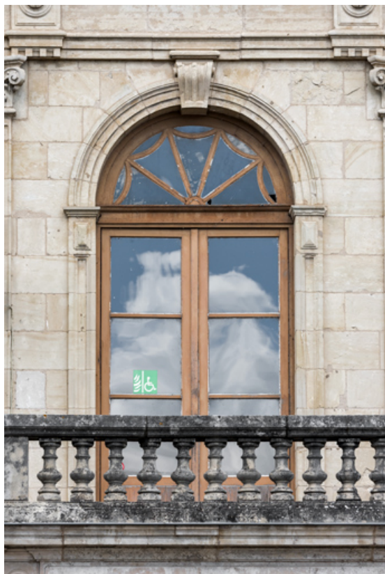
Travée droite : baie de l'étage carré.

58, Nevers, 8 place des Reines de Pologne