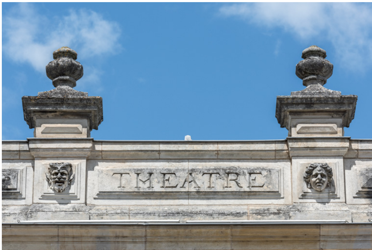
Partie centrale de l'attique, avec inscription et deux têtes.

58, Nevers, 8 place des Reines de Pologne