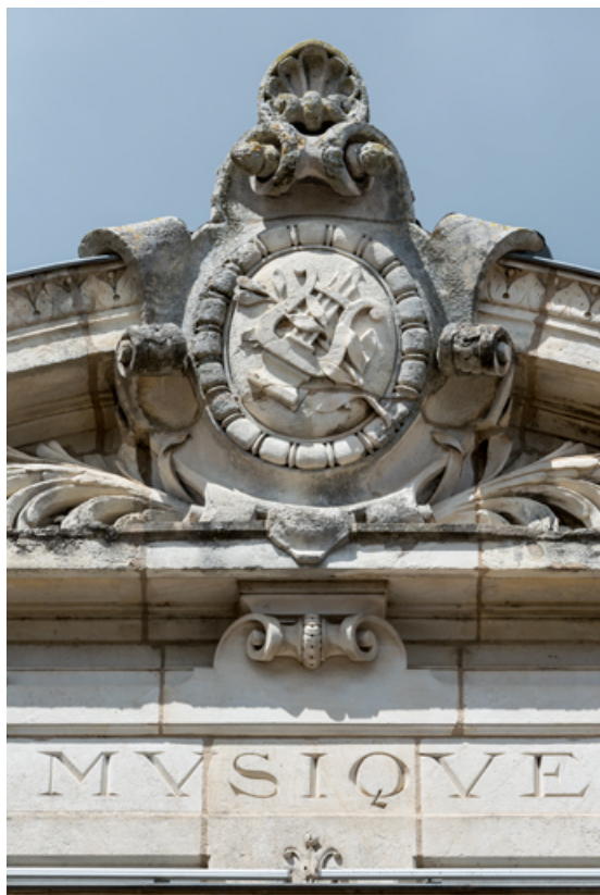
Travée gauche : décor du fronton.

58, Nevers, 8 place des Reines de Pologne