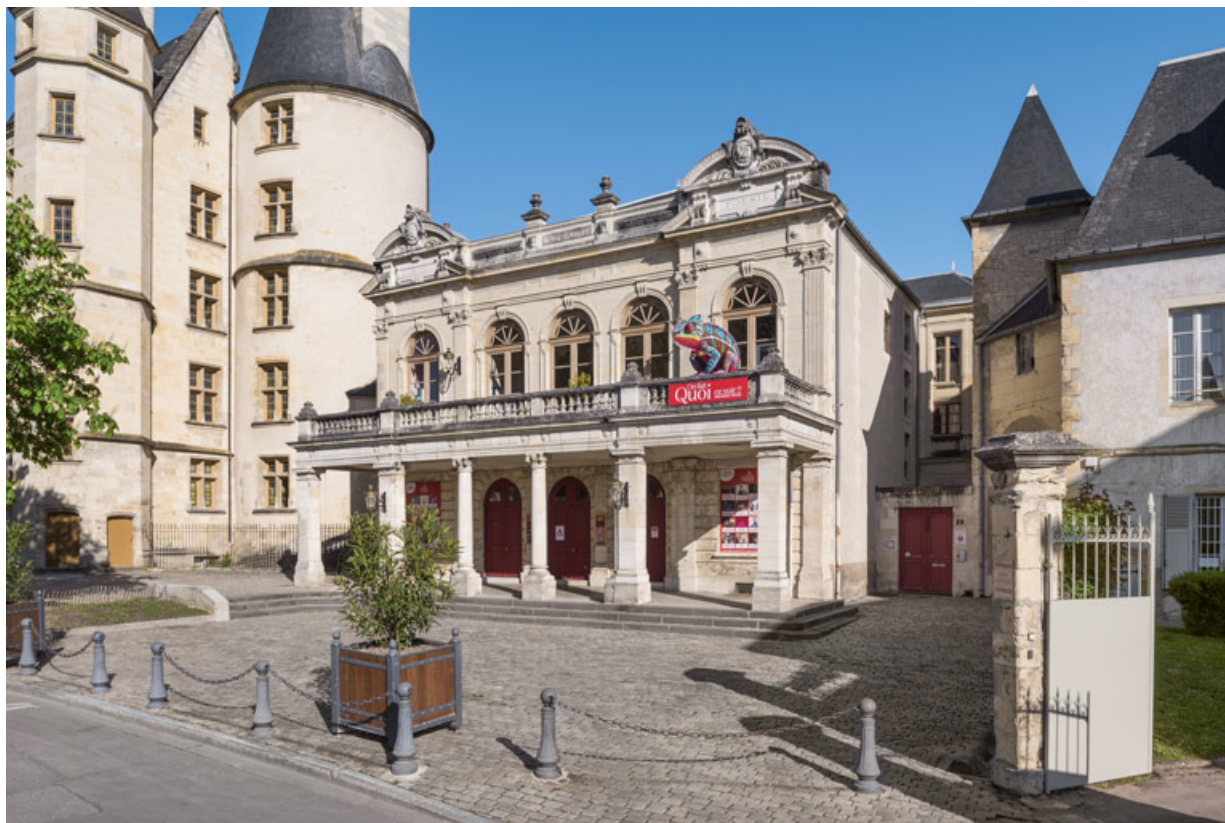
La façade principale du théâtre et son porche.

58, Nevers, 8 place des Reines de Pologne