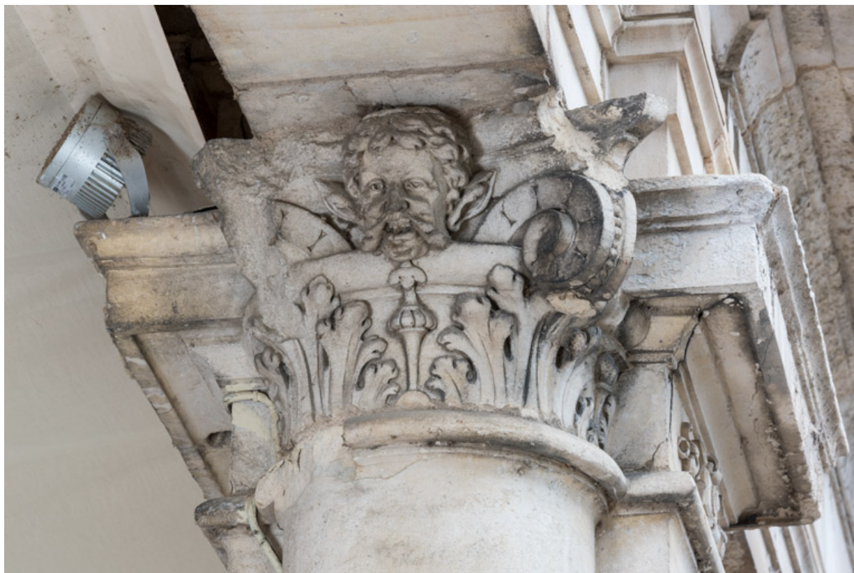
4e colonne (à droite), chapiteau : une tête souriante (sur la face gauche). 58, Nevers, 8 place des Reines de Pologne