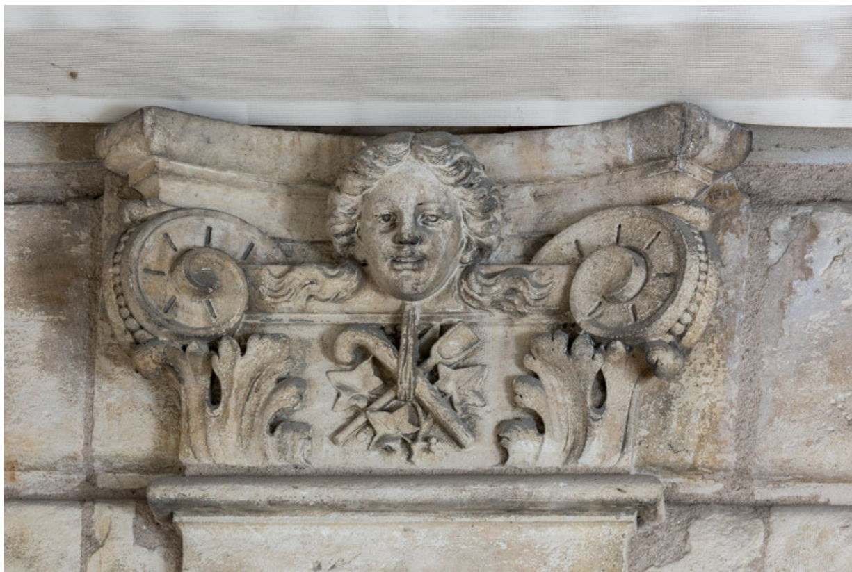
2e pilastre, chapiteau : tête et trophées d'instruments (pelle et canne).

58, Nevers, 8 place des Reines de Pologne