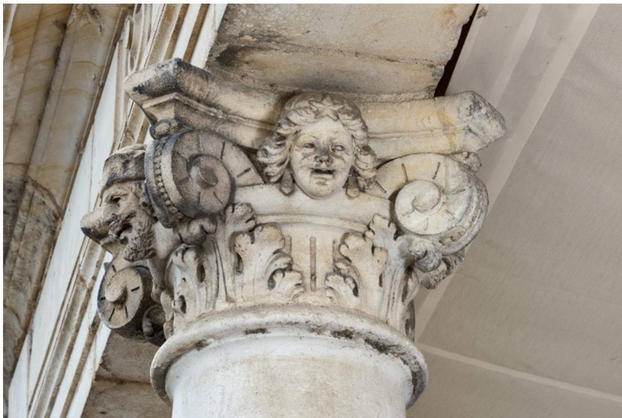
2e colonne, chapiteau : deux têtes (sur les faces avant et droite). 58, Nevers, 8 place des Reines de Pologne