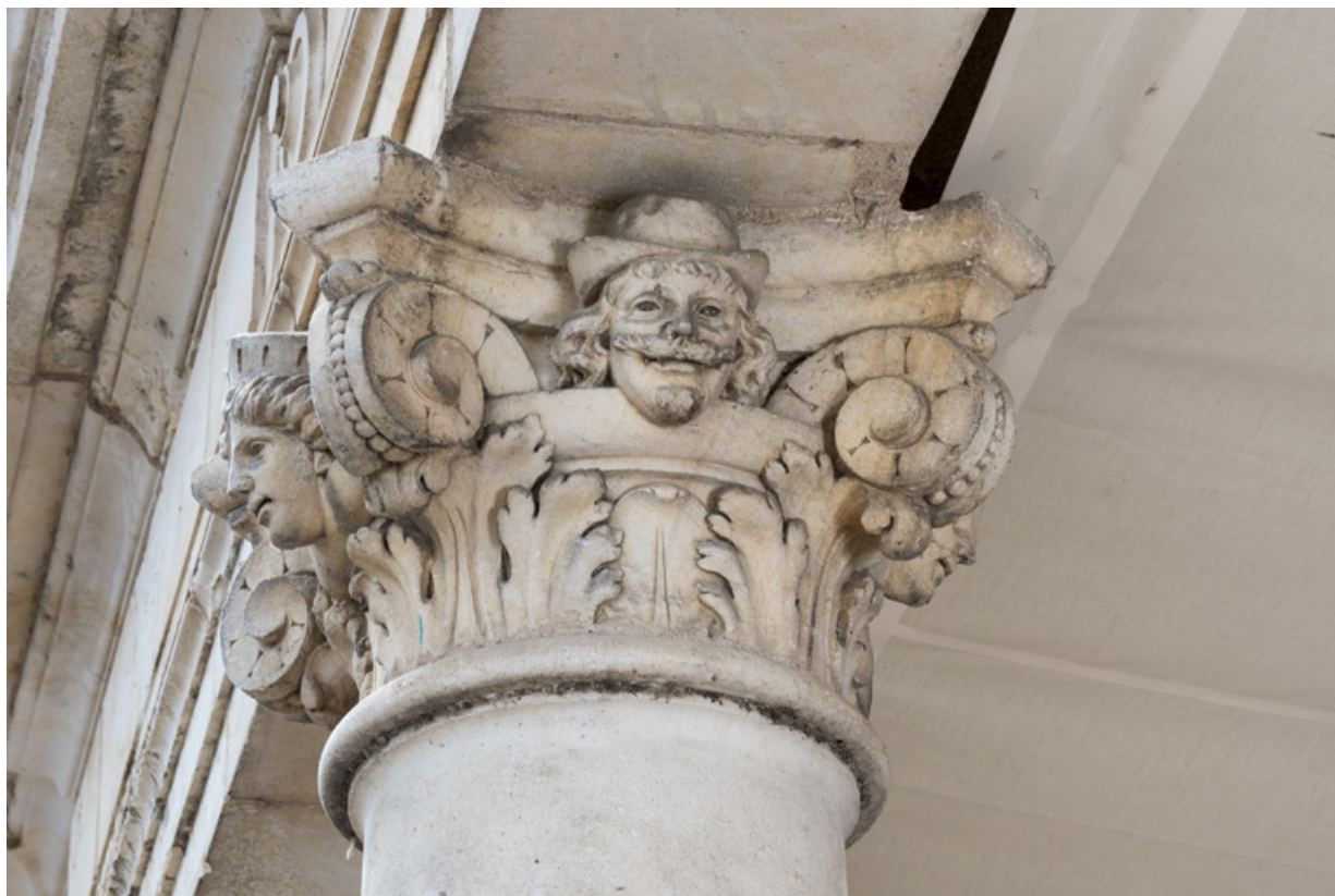
3e colonne, chapiteau : deux têtes (sur les faces avant et droite).

58, Nevers, 8 place des Reines de Pologne