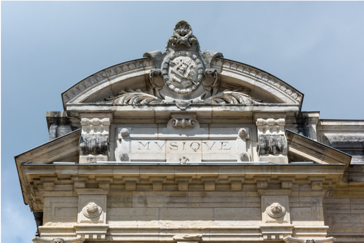
Travée gauche de la façade : inscription et frontons.

58, Nevers, 8 place des Reines de Pologne