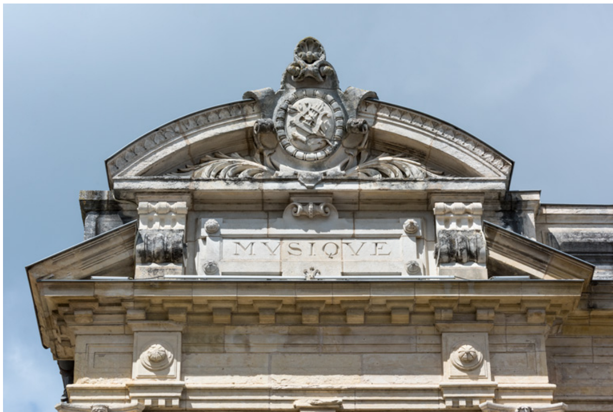
Travée gauche de la façade : inscription et frontons.

58, Nevers, 8 place des Reines de Pologne