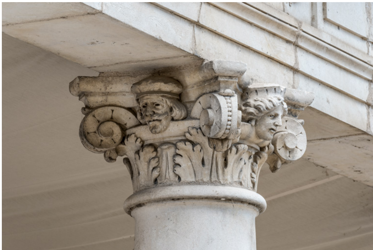
3e colonne, chapiteau : deux têtes (sur les faces gauche et avant).

58, Nevers, 8 place des Reines de Pologne