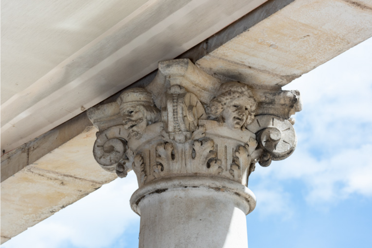
2e colonne, chapiteau : deux têtes (sur les faces arrière et gauche).

58, Nevers, 8 place des Reines de Pologne