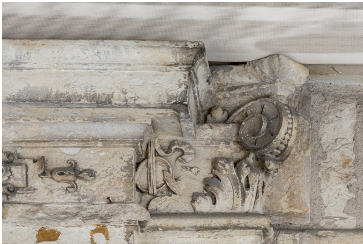
1er pilastre (de gauche à droite), chapiteau : tambourin.

58, Nevers, 8 place des Reines de Pologne