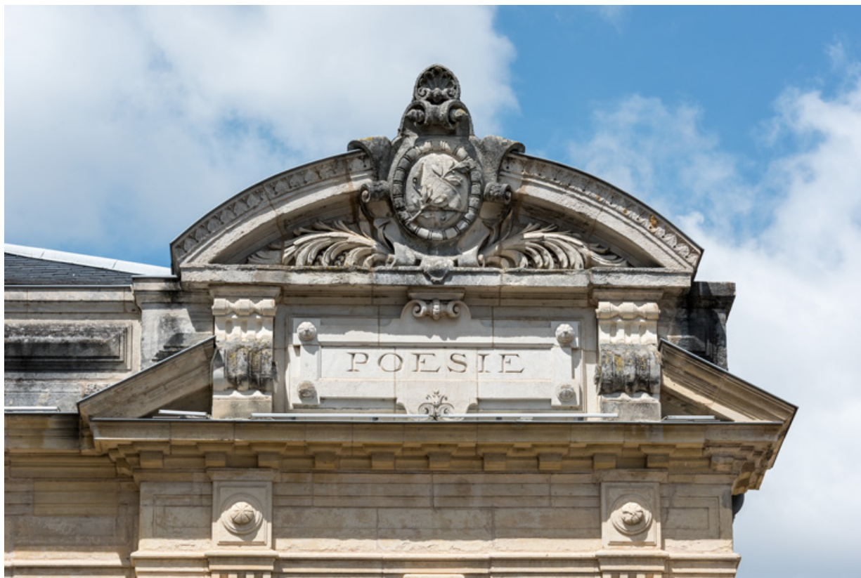
Travée droite : inscription et frontons.

58, Nevers, 8 place des Reines de Pologne