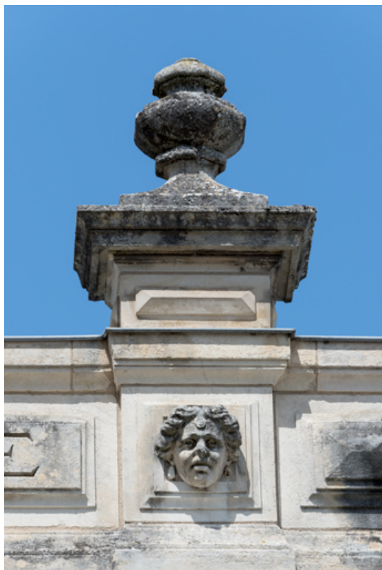
Partie centrale de l'attique : tête féminine (Marguerite ?).

58, Nevers, 8 place des Reines de Pologne