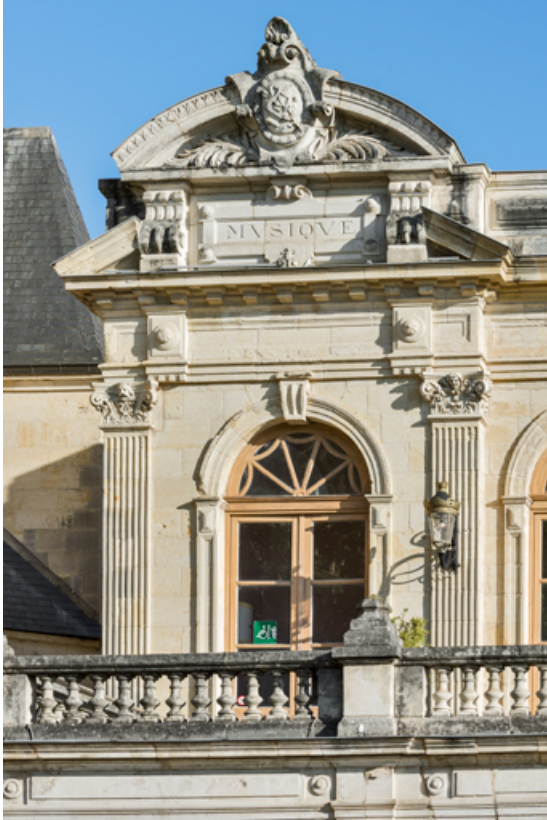
Travée gauche de la façade, à l'étage carré.

58, Nevers, 8 place des Reines de Pologne