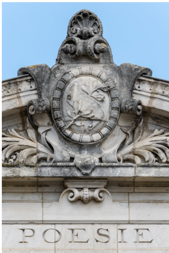
Travée droite : décor du fronton.

58, Nevers, 8 place des Reines de Pologne