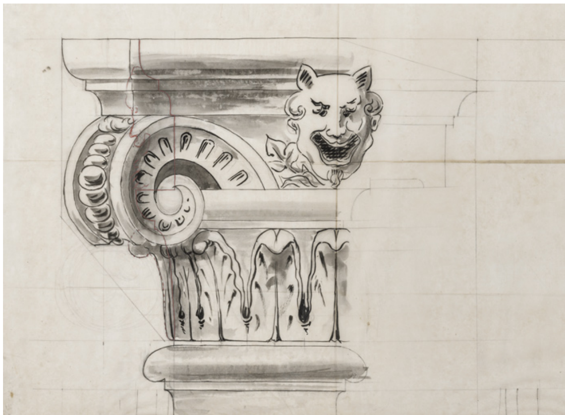
[Plan, coupe et élévation d'un chapiteau du porche]. 27 mars 1899.

58, Nevers, 8 place des Reines de Pologne