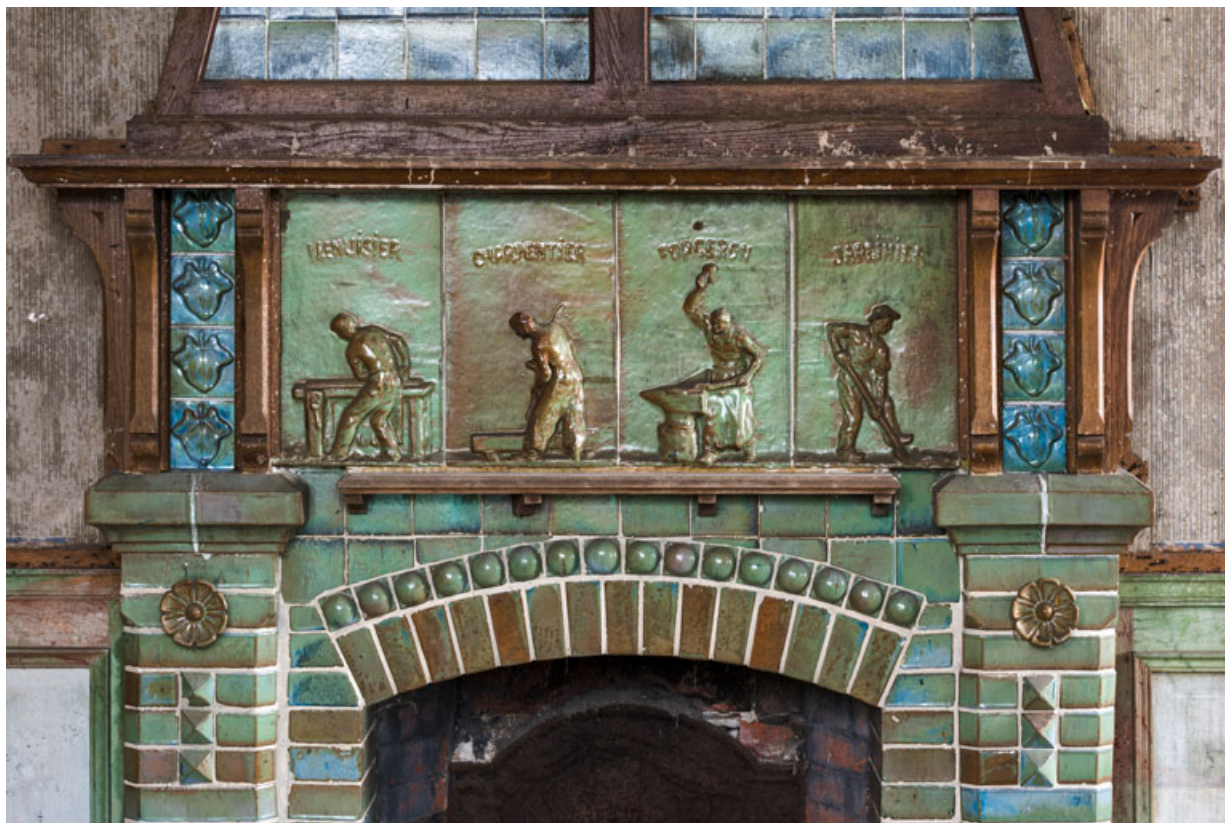
Partie supérieure du manteau et partie inférieure de la hotte.

58, Pougues-les-Eaux, 130 avenue de Paris, lieudit : La Montjaie