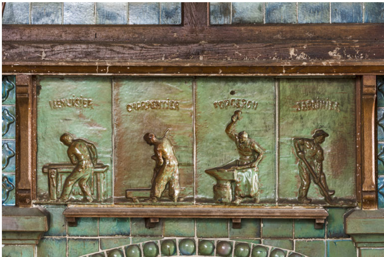
Partie inférieure de la hotte, détail : menuisier, charpentier, forgeron et jardinier.

58, Pougues-les-Eaux, 130 avenue de Paris, lieudit : La Montjaie