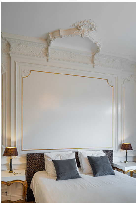
Décor de moulures du mur nord de la grande chambre.

58, Saint-Honoré-les-Bains, 5 avenue Claude Dellys