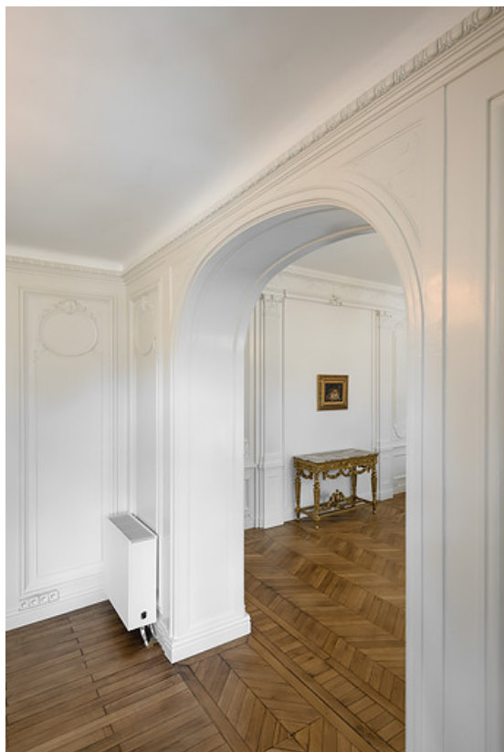
Arc séparant la chambre de toilette et la grande chambre (vue depuis la chambre de toilette). 58, Saint-Honoré-les-Bains, 5 avenue Claude Dellys