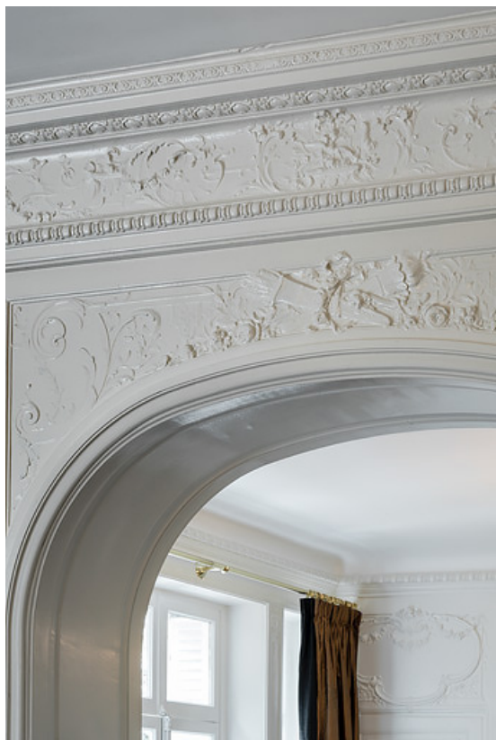
Arc séparant la chambre de toilette et la grande chambre (vue depuis la grande chambre). 58, Saint-Honoré-les-Bains, 5 avenue Claude Dellys