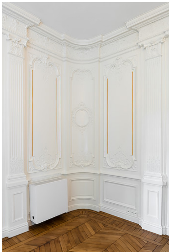
Décor de pilastres dans l'angle sud-ouest de la grande chambre.

58, Saint-Honoré-les-Bains, 5 avenue Claude Dellys