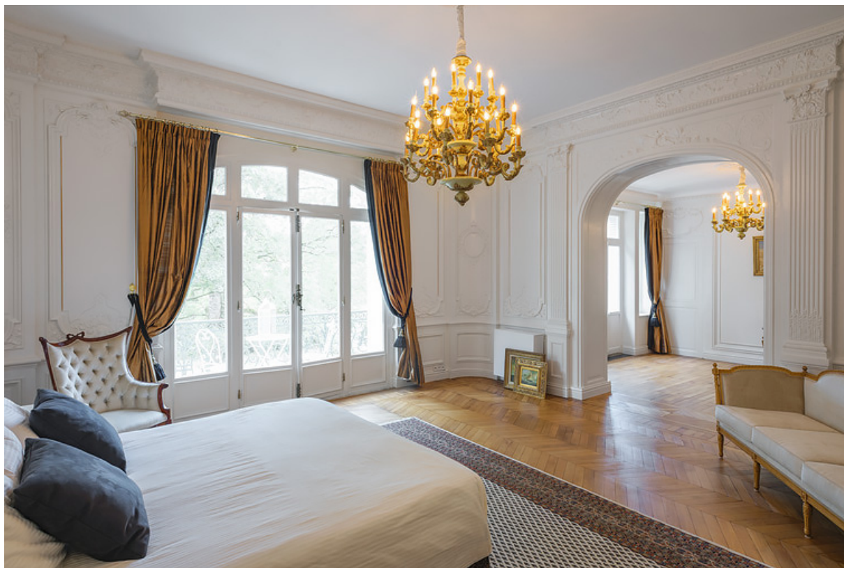
Vue intérieure de la grande chambre, au premier étage.

58, Saint-Honoré-les-Bains, 5 avenue Claude Dellys