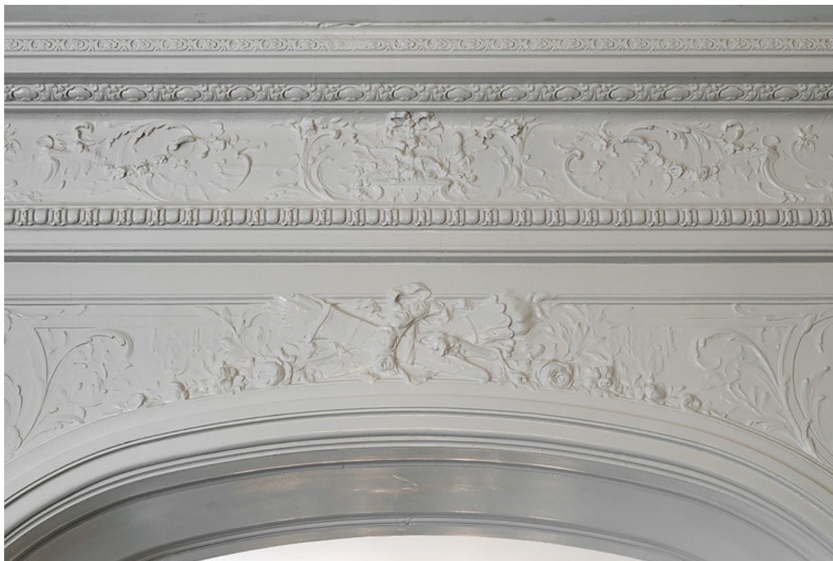
Détail du décor de la grande chambre (arcs et carquois, torches, rubans, guirlandes de roses).

58, Saint-Honoré-les-Bains, 5 avenue Claude Dellys