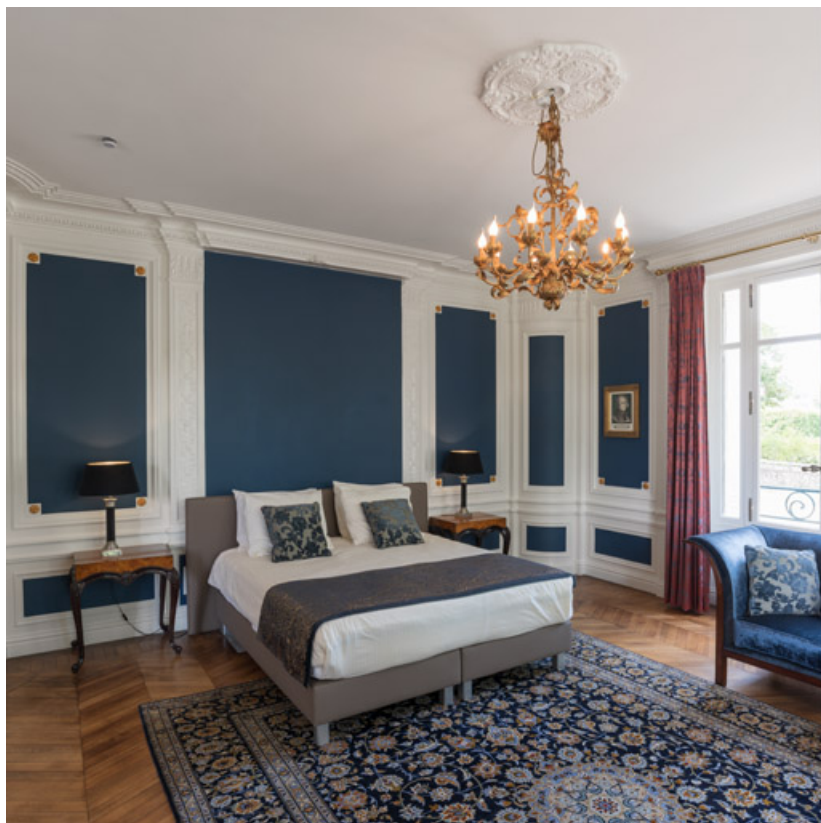
Vue intérieure du grand salon, au rez-de-chaussée.

58, Saint-Honoré-les-Bains, 5 avenue Claude Dellys