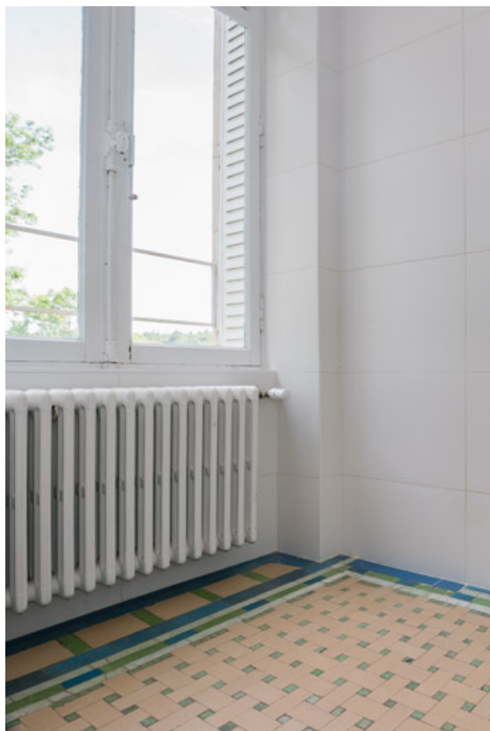
Vue d'un angle de la salle de bain.

58, Saint-Honoré-les-Bains, 5 avenue Claude Dellys