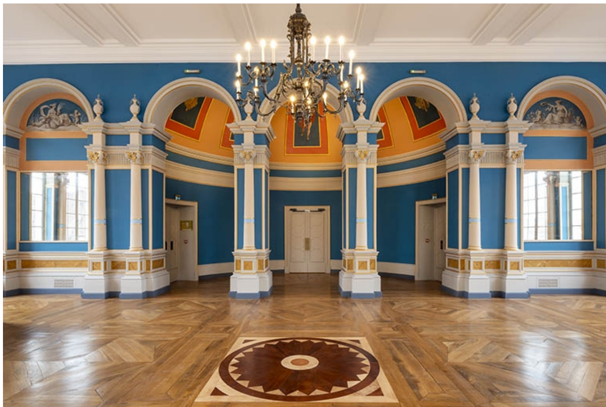
Vue d'ensemble du foyer, en direction de la salle, montrant le Printemps à droite et l'Eté à gauche.