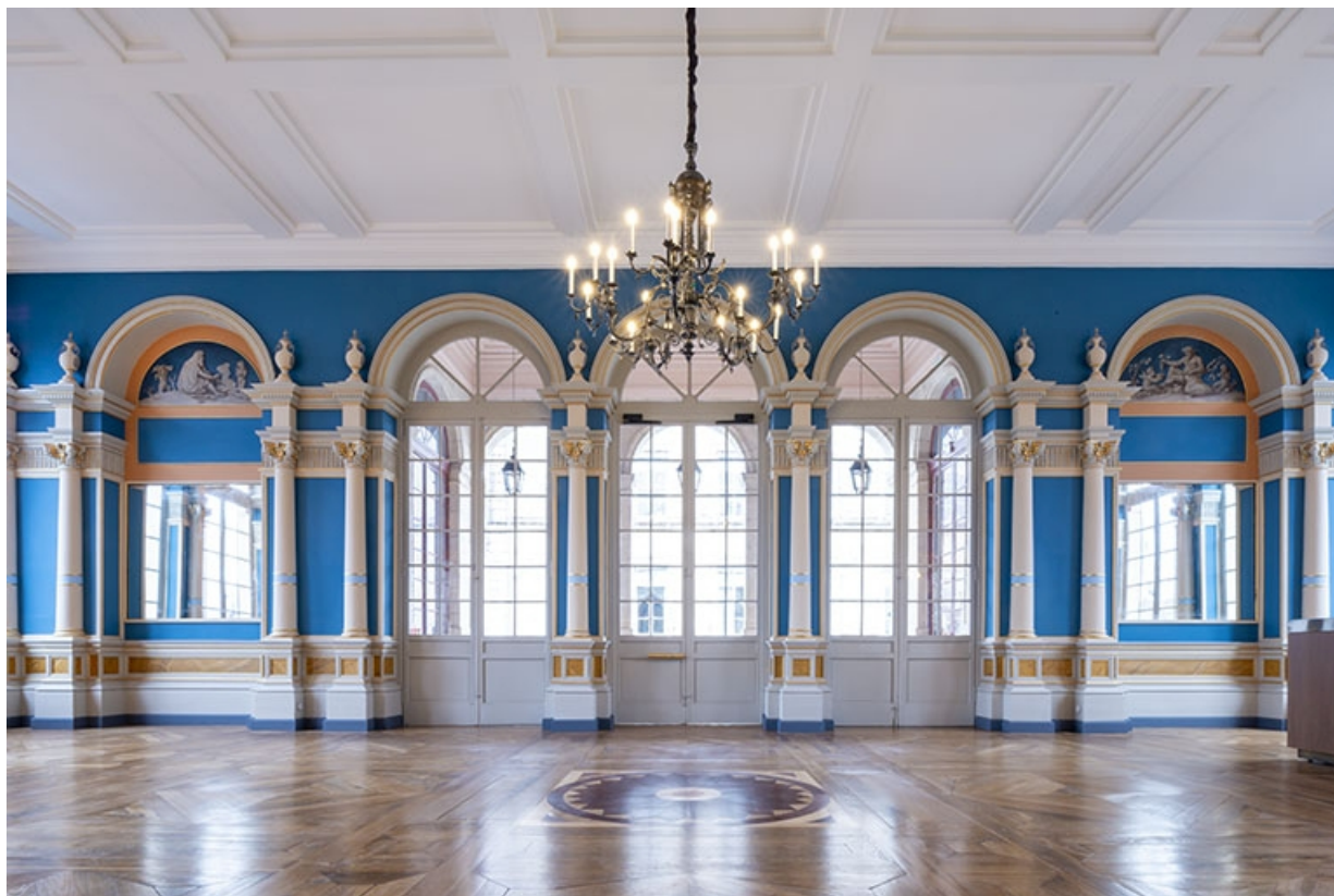
Vue d'ensemble du foyer, en direction de la loggia, montrant l'Automne à droite et l'Hiver à gauche.