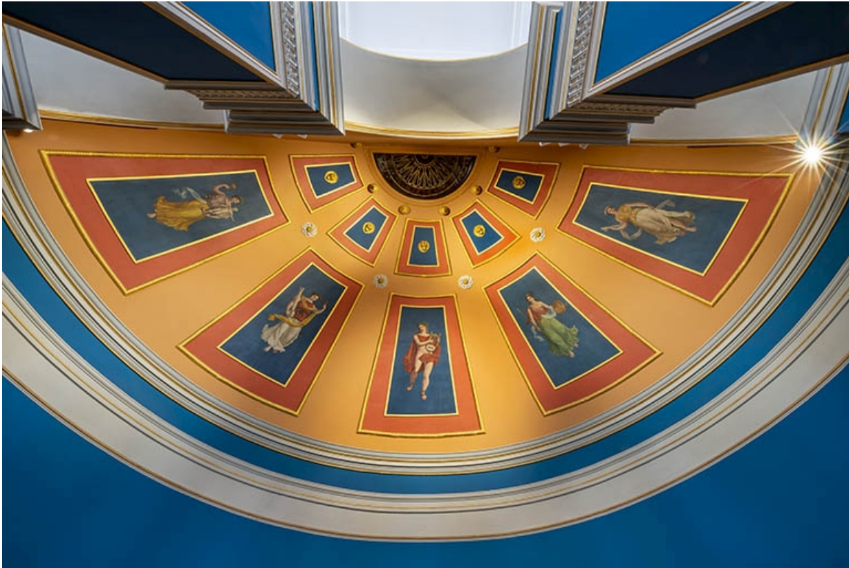
Vue d'ensemble des peintures sur la fausse-voûte en cul-de-four.