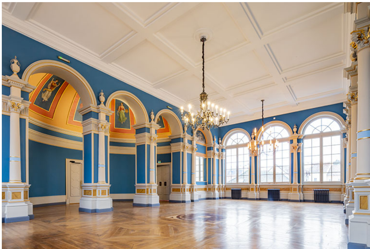
Vue d'ensemble du foyer avec l'antichambre en hémicycle à gauche.