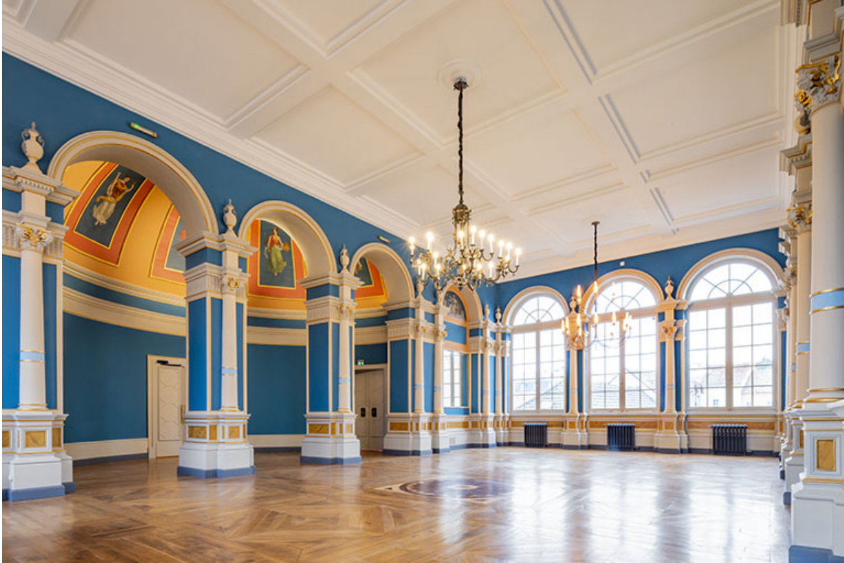
Vue d'ensemble du foyer avec l'antichambre en hémicycle à gauche.