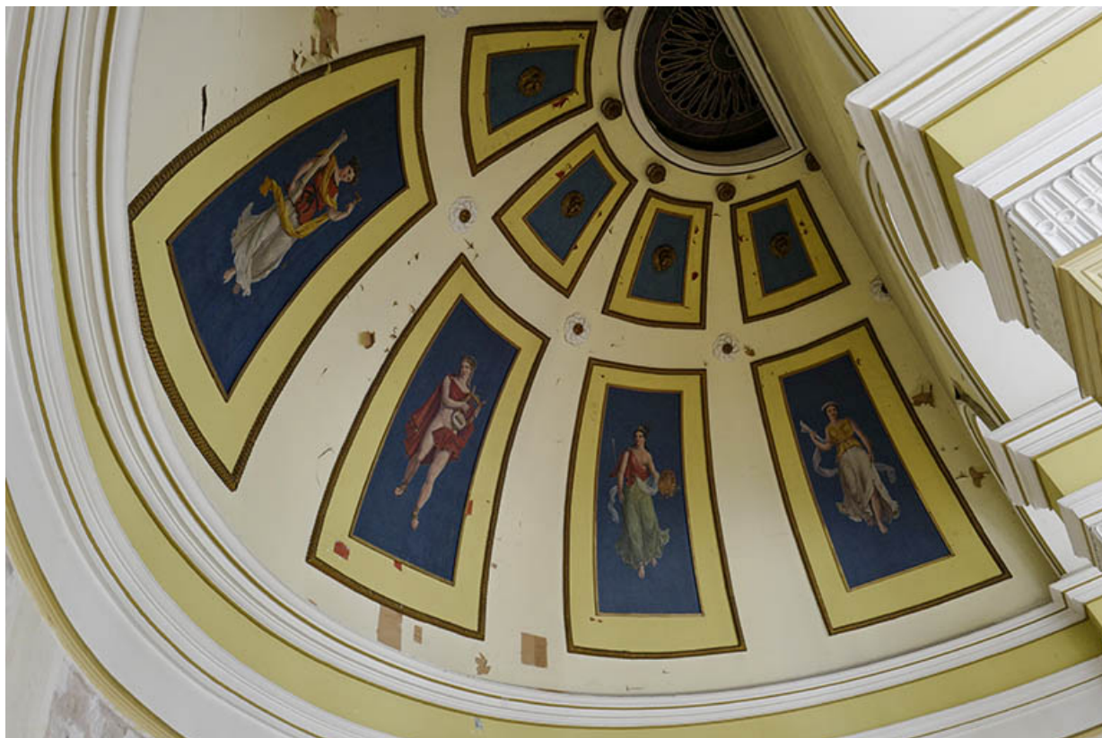
Le décor en 2020, avant restauration.