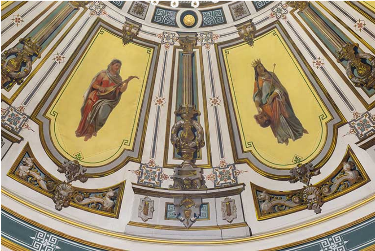
Détail de deux panneaux : la Musique et la Tragédie.