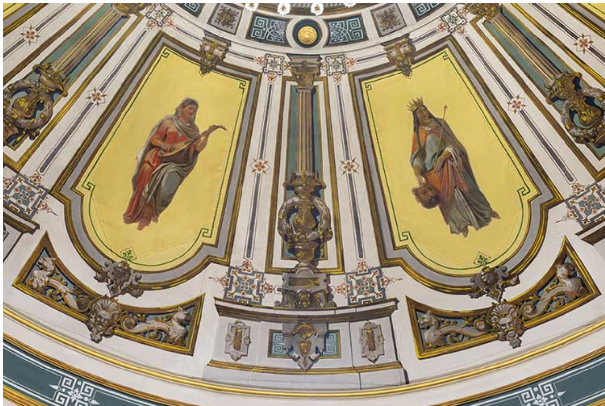
Détail de deux panneaux : la Musique et la Tragédie.