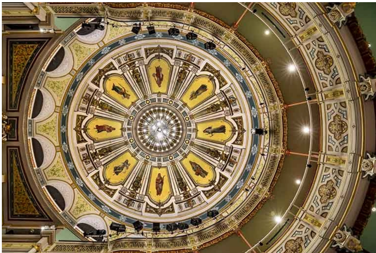
Vue d'ensemble du plafond.