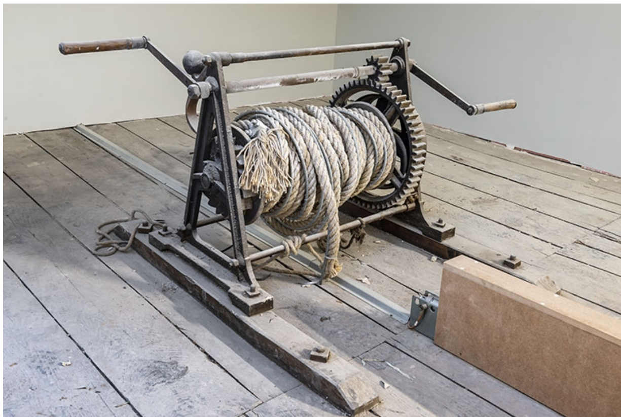
Treuil (désaffecté) du lustre de la salle.