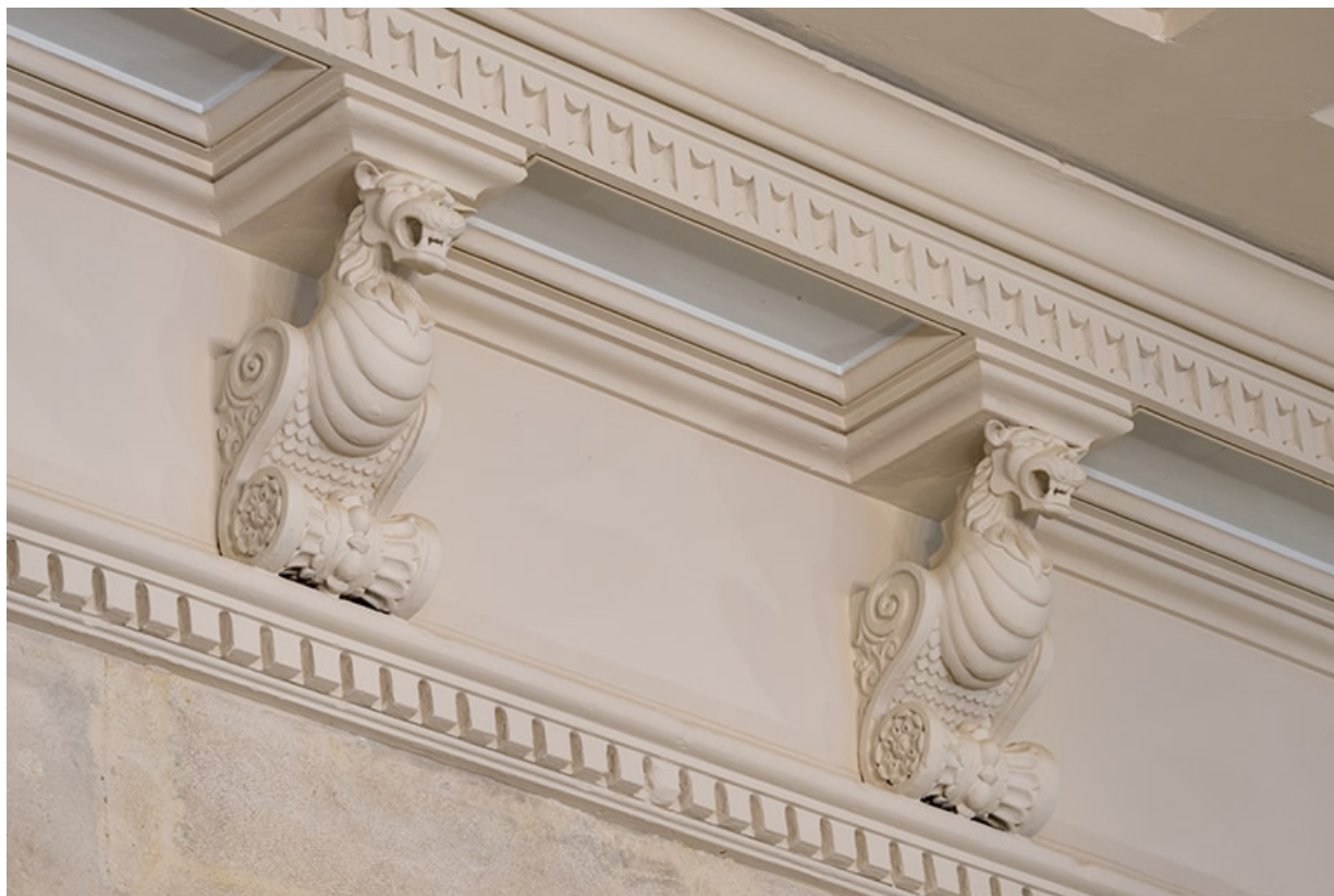
Vestibule : décor de modillons zoomorphes.