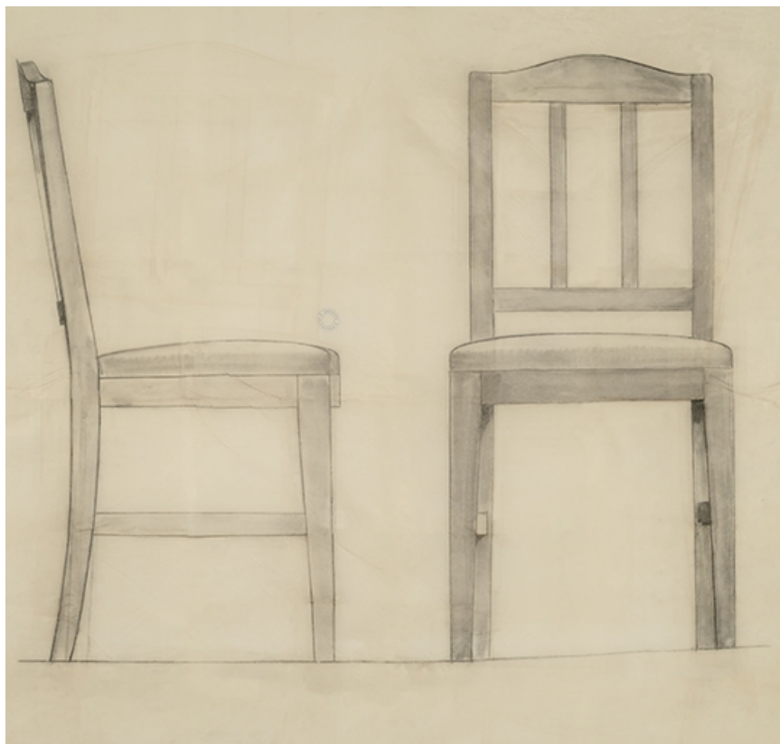
[Elévations de face et de profil d'une chaise de la société Gallot Frères]. S.d. [1923 ?]. 39, Dole, 30 rue du Mont-Roland