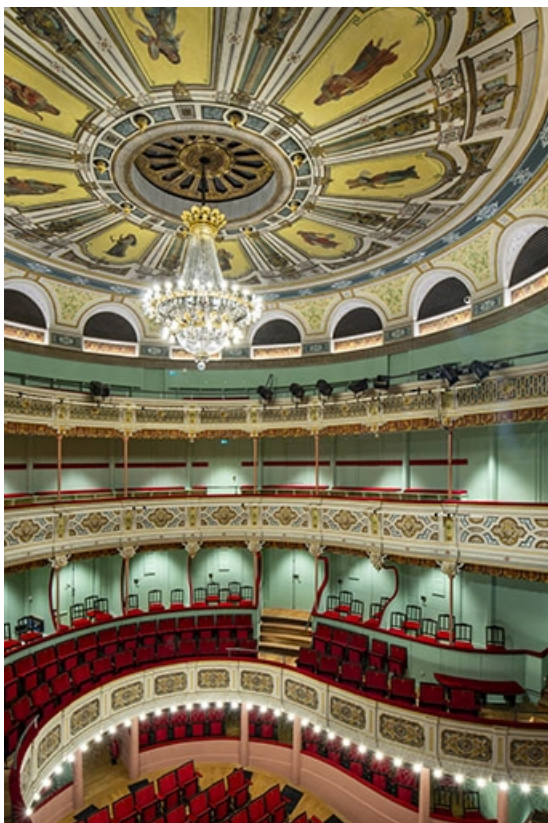
Salle : les balcons côté jardin, vus du 2e balcon. Vue montrant le plafond et son lustre, ainsi que les chaises. 39, Dole, 30 rue du Mont-Roland