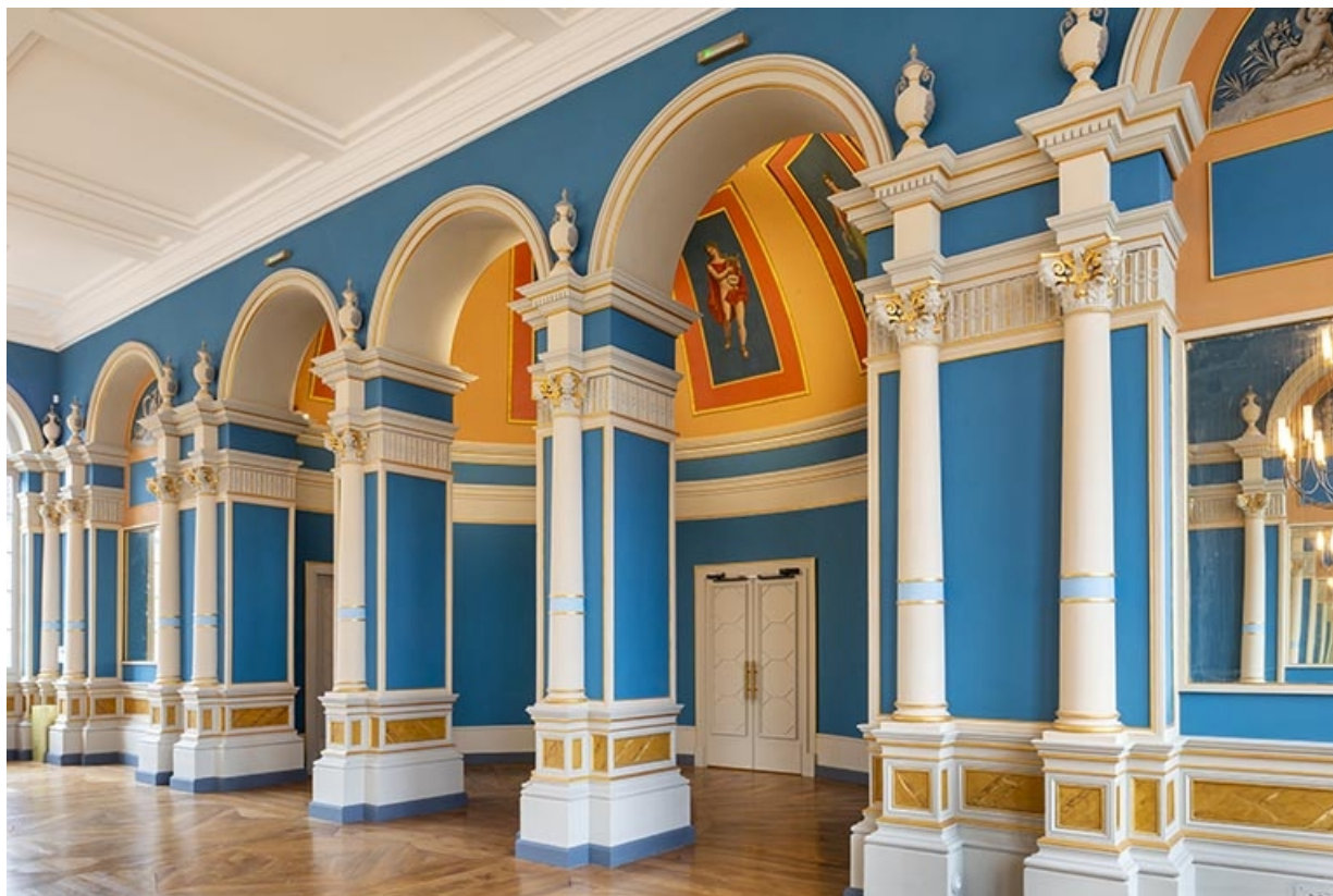
Foyer : mur sud (entrée), vu de trois quarts droite 39, Dole, 30 rue du Mont-Roland